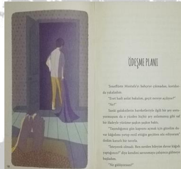
Resim 3. Ada'nın babası odayı terk ederken (Odamdaki Hayalet, s. 48-49)

Aşağıda, yapıtlarda kullanılan resimlerin kullanıldığı yer ile ilgili kesite yer verilmiştir: