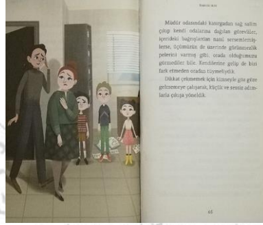
Resim 2. Sersemleşmiş görevliler ve çocuklar (Sihirbazın Kuyruğu, s. 64-65)

Aşağıda, yapıtlarda kullanılan resimlerin anlatıları somutlaması ile ilgili kesitlere yer verilmiştir: