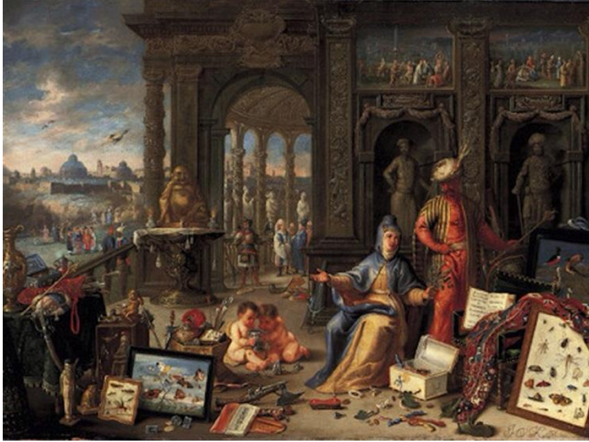
Resim 3. Jan van Kessel (Baba), "Asya" Tuvale Yağlı Boya, 1666.