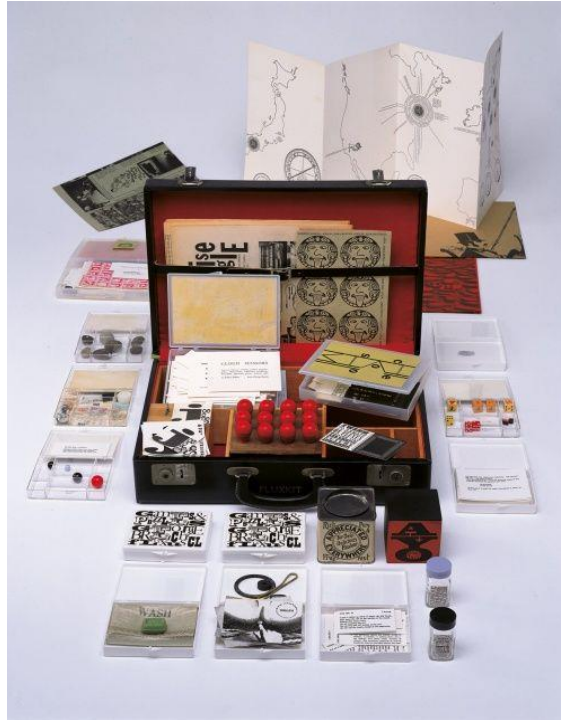
Resim 10. Fluxus Kit, George Maciunas