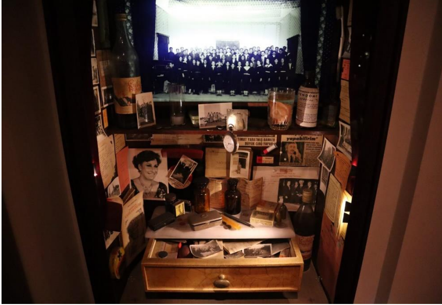
Resim 8. Masumiyet Müzesi

Müze, bugün yaygın olarak bildiğimiz müze anlayışının epey uzağındadır ve mekânın kullanımı ile dolap, kutu ve çekmece gibi alanların düzenlemesiyle biçimsel olarak nadire kabinelerine benzemesine rağmen onlardan oldukça farklıdır. Koleksiyonerin hayal dünyasını ve anılarını kendi hisleriyle bir araya getirdiği nesnelere kurulumu burayı nadire kabinelerine yaklaştırırsa da içerisinde yer alan nesnelere nadire kabinelerinin aksine, olağandışı nesnelere, egzotik yaratıklardan, tuhaf olduğu düşünülen şeylerden değil de, fazlasıyla sıradan nesnelere oluşması onu nadirelerden ayırır. Ayrıca Nadire Kabineleri, kişinin gücünü ve servetini gösterişli bir şekilde temsil ederken, Masumiyet Müzesi günlük eşyaların sıradanlığının taşıdığı kişisel değerleri temsil eder. Bu değerler, nesnelere ya da şeylerin yarattığı bellektir.