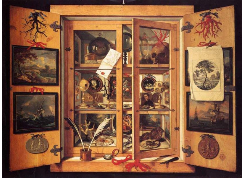
Resim 2. Domenico Remps, "Nadire Kabineleri" Tuval Üzerine Yağlı Boya, 1690.

oldukları kişi tarafından ziyaret edilirler. "Kunstkammer veya Nadire Kabineleri (cabinet de curiosites) Avrupa'da 15. ve 18. yüzyıllar arasında kurulan ve egemenlerin hayal dünyalarındaki bir mikro kozmosu canlandırdıkları, çoğu kolonilerden derlenenmiş tuhaf, acayip, nadirelerden oluşan koleksiyonlardır" (Artun, 2017,s.41). Nadire Kabineleri modern anlamda müzenin kökeni olsa da belli bir taksonomiye bağlı kalmamaları ve kamusal bir anlatımı değil de bireysel bir dili esas almaları bakımından bugünkü müzelerden çok farklıdır.