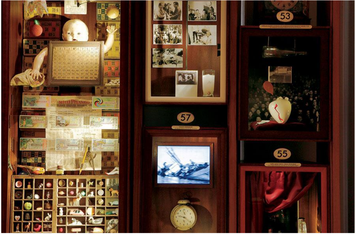
Resim 7. Masumiyet Müzesi