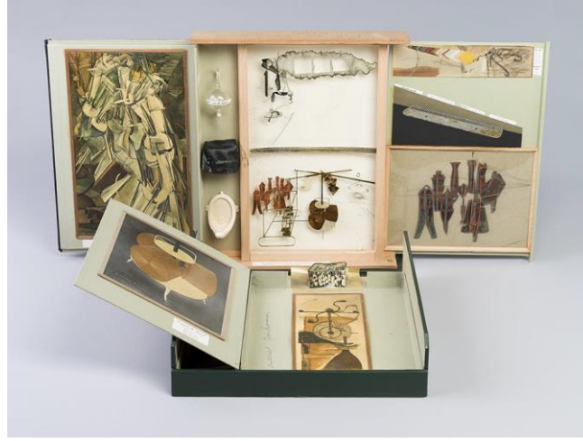
Resim 9. "La Boite en Valise", Marcel Duchamp