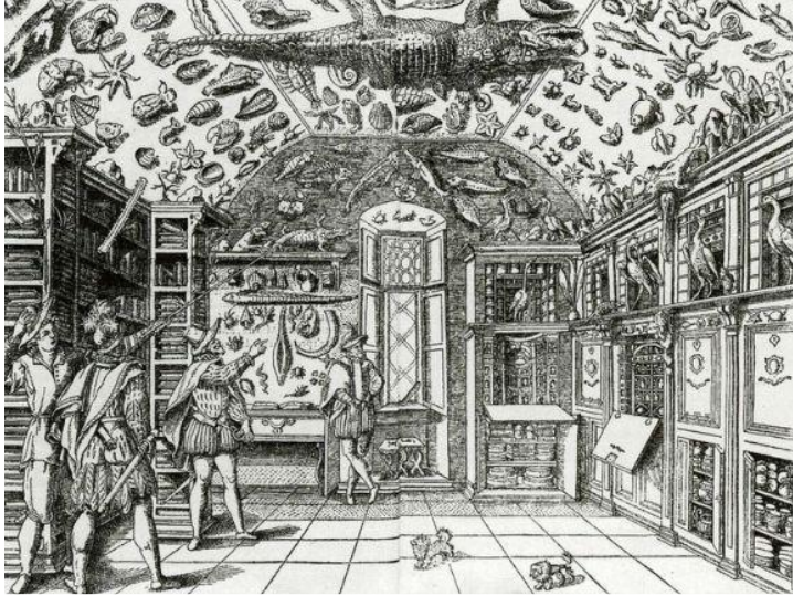
Resim 1. Napoli'deki Ferrate Imperato Müzesi, Imperato'nun Historia Naturele (1599) adlı eserinden.

Nadire kabineleri herhangi bir taksonomik düzenden bağımsız olarak farklı ölçü ve formda olabilmektedir. Biçimsel olarak herhangi bir evrensel kaidesi yoktur, burada önemli olan nesnelere arasındaki gizemli ilişkiyi ifade edebilmek için doğru kurgunun yapılmasıdır. Bu kurguda koleksiyoncunun doğru metaforlar kullanması oldukça önemlidir. Kabineler ait oldukları kişinin değerli ya da tuhaf olduğunu düşündüğü her türlü nesneyi içerebilir. Kurutulmuş bitkiler, deniz kabukları, büyüdüğüne inanılan devekuşu yumurtaları ya da mercan gibi tabiat ürünlerinin olduğu naturalia , resim, heykel, mücevher ve silah içeren artificialia , pusula, küre, teleskop barındıran scientifica , iki parmağı olan bir insan, hilat garibesi ya da ucubenin olduğu mirabilia ve harita, şema, katalog ürünlerinin biriktirildiği bibliotheca gibi bölümlerden oluşur. Böcekler, doldurulmuş hayvanlar, bebek başları, ceninler, mumyalanmış kollar ve bacaklar ile kavanozlanmış sürüngenler de nadire örnekleridir. Unicorn, yani tek boynuzlu at ise nadirelerin en değerlilerindedir. (Agk.)