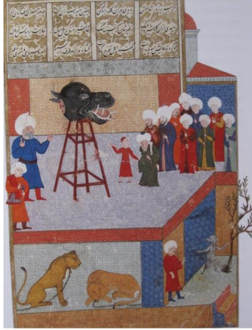
Resim 4. Mısır'dan gelen su aygırının aslanhanede halka gösterilmesi. Şahname-i Seyyid Han, 1581.

güç gösterisini kabinelerde de görmekteyiz. Fatih Köşkü'nde doldurulmuş bir zürafa, Eski Aya Yani Kilisesi'ndeki kuşhane, saray bahçelerinde yetiştirilen egzotik bitkiler ve kaplumbağa ile ispermeçet gibi hayvanlar, Osmanlı'nın naturalia koleksiyonunu oluşturur. Saat, pusula ve usturlab gibi aletlerin olduğu scientifica dışında aslında en önemli koleksiyon ise silah koleksiyonu Mecmua-i Ešliha-i Atika yani artificialia 'dır. Mirabilia 'da ise cüceler ve hilkat garibeleri bulunur.