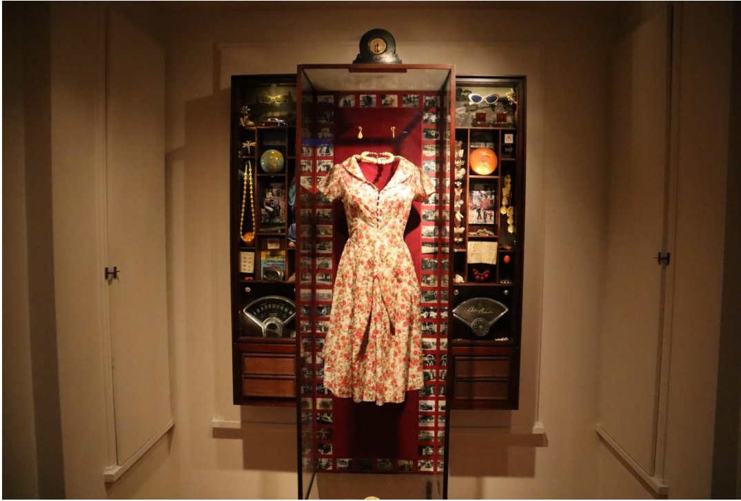
Resim 6. Masumiyet Müzesi

Dört katlı binanın giriş katında "4312 İzmarit" isimli vitrin ve sigara videoları bulunmaktadır. İzmaritler Füsun'un içtiği sigaraların izmaritleridir ve tüm duvarı kaplayan bir vitrin içerisinde, romandan alıntılanan cümlelerle birlikte sergilenmektedir. Cümleler bizzat Orhan Pamuk tarafından yazılmıştır. Birinci kat, kitabın birinci bölümünden elli birinci bölüme dek olan kısmı, ikinci kat elli ikinci bölümünden yetmiş dokuzuncu bölüme dek olan kısmı anlatır. Üçüncü katta ise sekseninci bölümünden seksen üçüncü yani son bölüme dek olan kısım anlatılırken, burada aynı zamanda Kemal Basmacı'nın Füsun'un ölümünden sonra satın alıp yerleştiği bu evdeki odası bulunmaktadır. Masumiyet Müzesi romanının çeşitli dillerdeki basımları, Orhan Pamuk'un el yazıları ve müze için yaptığı çizimler de burada sergilenmektedir.