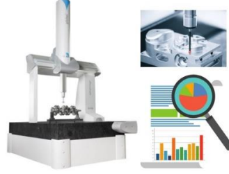
Şekil. Grafik özet / Figure. Graphical abstract

Koordinat Ölçme Makinelerinin işletmelere kalite ve verimlilik açısından katkıları, firmalarda kullanımı anket uygulanarak incelenmiştir. İstatistiksel olarak anket sonuçları paylaşılmıştır. / The contributions of Coordinate Measuring Machines to businesses in terms of quality and efficiency and their use in companies were examined by applying a survey. Statistically, the survey results were shared.