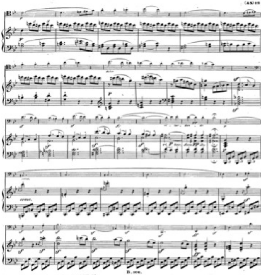
Görsel 3. Breitkopf und Hartel edisyonu (1863) s. 13.

Bu dönemde girişlerin genel olarak hızlı olduğu bilinmektedir. Beethoven Op:5 No:1 sonatında olduğu gibi Op:5 No:2 sonatında da piyano partisindeki yoğun akorlar ve ani nüans değişimlerini, daha durağan fakat tutkulu bir viyolonsel melodisi karşılar. İlk ölçülerde gelen melodi ana temayı oluşturur ve tüm geçişlerde her iki enstrümanda birden aynı melodi yinelenir. Bu Bölümü 3/4'lük, çok canlı Allegro molto piu presto bölüm takip eder. Allegro bölüm viyolonselinin temayı çalışısıyla başlar, piyanonun üçlemeleri bölüme daha da aceleci bir hava katar (Görsel 3).