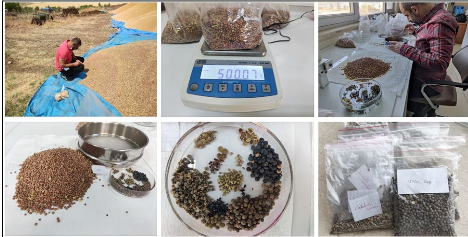
Şekil 1. Mercimek örnek alma ve yabancı ot tohumları ayıklama işlemine ait çalışmalar Figure 1. Studies on lentil sampling and weed seed extraction

Toplanan mercimek numuneleri Siirt Üniversitesi, Ziraat Fakültesi, Toprak ve Bitki Besleme Bölüm Laboratuvarı'na getirilmiştir. Numunelerden hassas terazi kullanılarak 500 gramlık alt numuneler alınmıştır. Bu numuneler içerisindeki kaba ve cansız materyalinin temizlenmesi için farklı boyutlardaki (6-60 mesh) eleklerden geçirilmiş ve yabancı otlar ayıklanması işlemine geçilmiştir. Mercimek ürününe karışan yabancı ot tohumları elle tek tek ayıklanmış ve morfolojik özelliklerine göre gruplandırılmıştır (Şekil 1). Ayıklanan yabancı ot tohumları, stereo mikroskop altında incelenmiş, laboratuvardaki tohum koleksiyonu, tohum teşhis kitapları (Özer