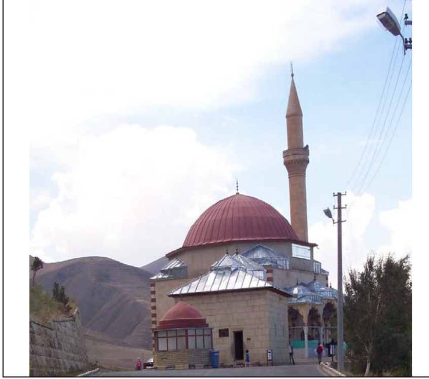
Ek I: Abdurrahman Gazi Cami ve Türbesi