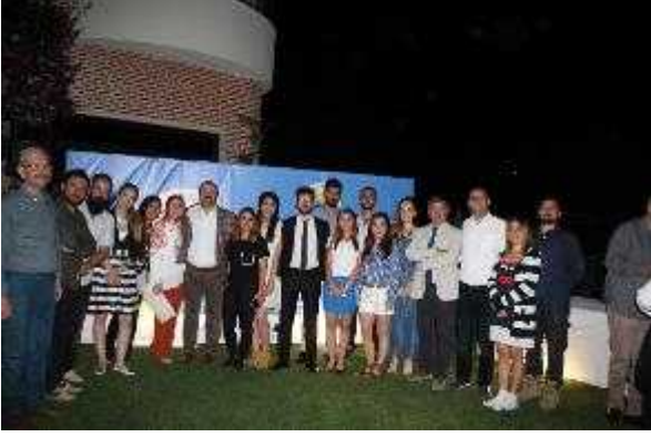
Foto 49-50. 16. UKSD Kapanı /Ödül Töreni