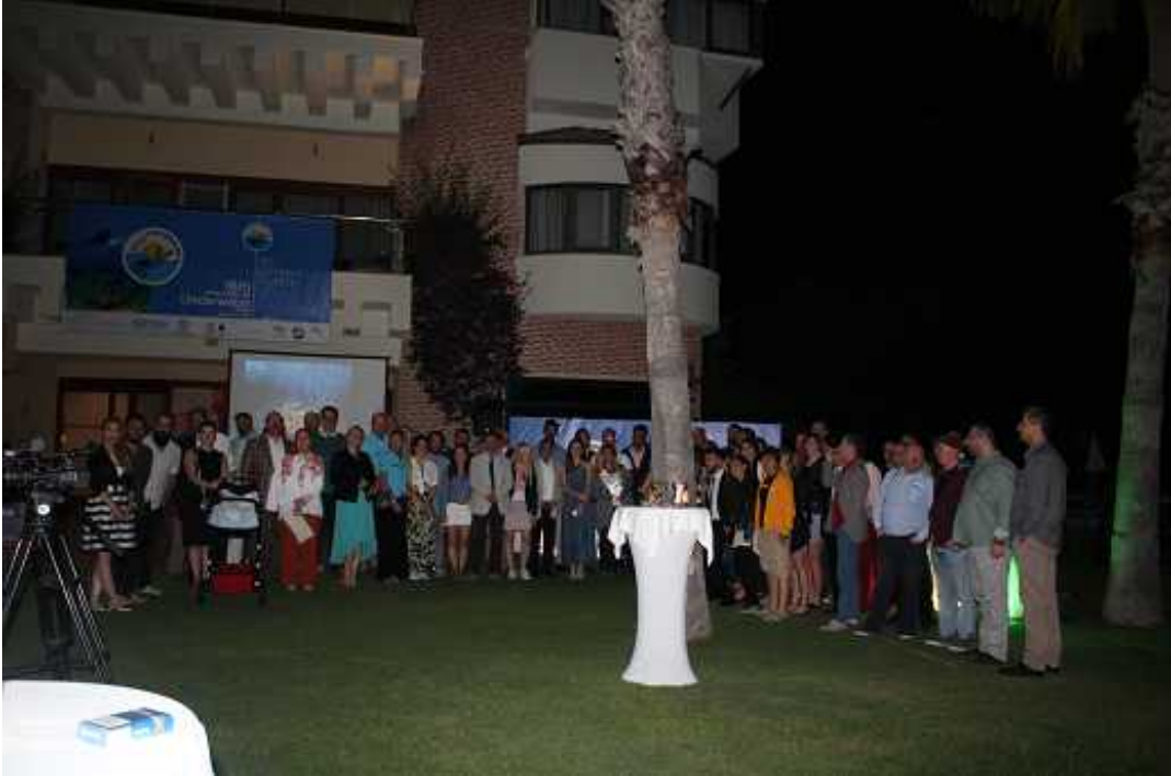
Foto 48. 16. UKSD Kapanı /Ödül Töreni