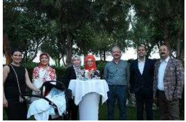
Foto 55-56. 16. UKSD Kapanı /Ödül Töreni