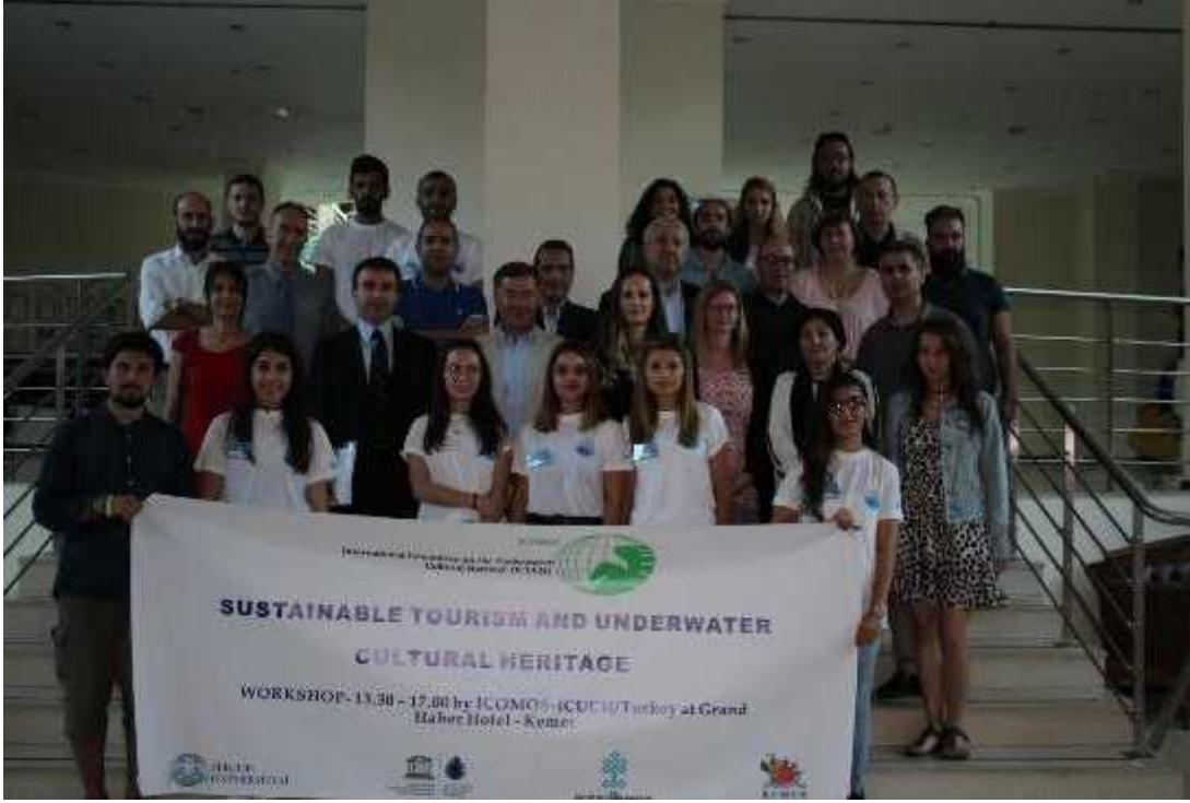
Foto 47. Workshop Sürdürülebilir Turizm ve Sualtı Kültür Mirası, ICOMOS-ICUCH