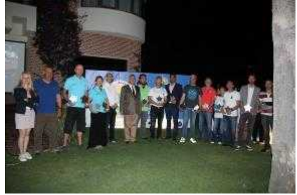
Foto 51-52. 16. UKSD Kapanı /Ödül Töreni