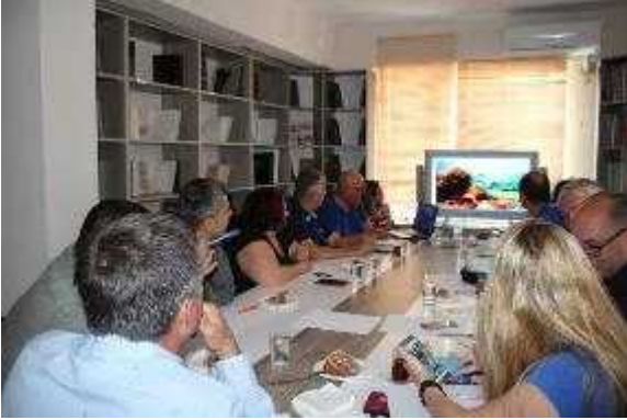
Foto 33-34. 16.UKSG Jüri Toplantısı