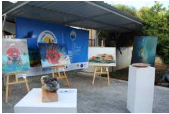
Foto 12-13. Akdeniz Üni. Güzel Sanatlar Fakültesi “Suyun Rengi” Güzel Sanatlar Sergisi