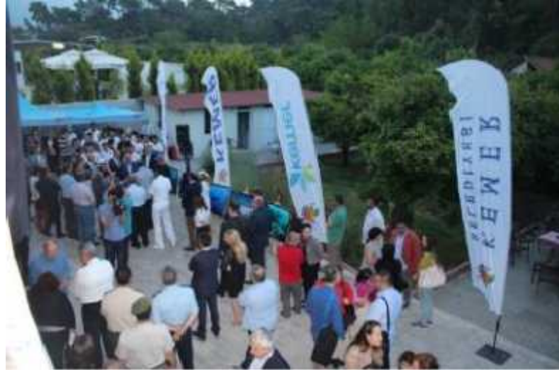
Foto 10-11. Akdeniz Ü.. Güzel Sanatlar Fakültesi “Suyun Rengi” Güzel Sanatlar Sergisi – Kemer Selçuk Üniversitesi Binası