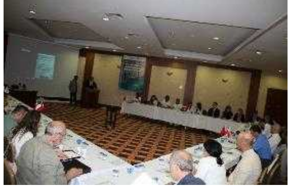
Foto 24-25. II. Akdeniz Ortaça Çalı maları Sempozyumu: “Türkiye, Polonya ve talya Ortak Projeleri”