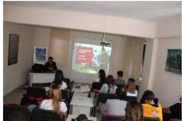
Foto 39-40. Workshop Sürdürülebilir Dalı Endüstrisi Divers Alert Network; H2020 – Green Bubbles

Aynı gün Grand Haber Hotel- Kemer’de ICOMOS ( ULUSLARARASI ANITLAR VE S TLER KONSEY ) adına “Sürdürülebilir Turizm ve Sualtı Kültür Mirası” ba lı ıyla bir