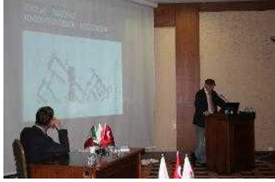
Foto 26-27 II. Akdeniz Ortaça Çalı maları Sempozyumu: “Türkiye, Polonya ve talya Ortak Projeleri”