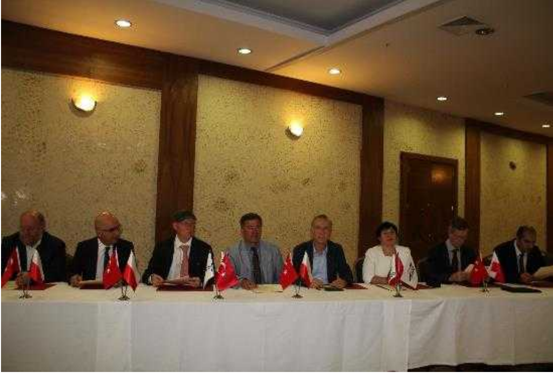
Foto 32. Türkiye Polonya Tarihi Dinamikler ve Sosyal Gelişim Akademi” Basın Toplantısı