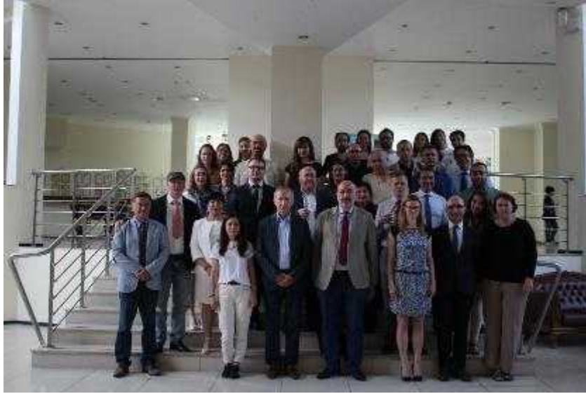
Foto 30-31. II. Akdeniz Ortaça Çalımaları Sempozyumu: “Türkiye, Polonya ve İtalya Ortak Projeleri”