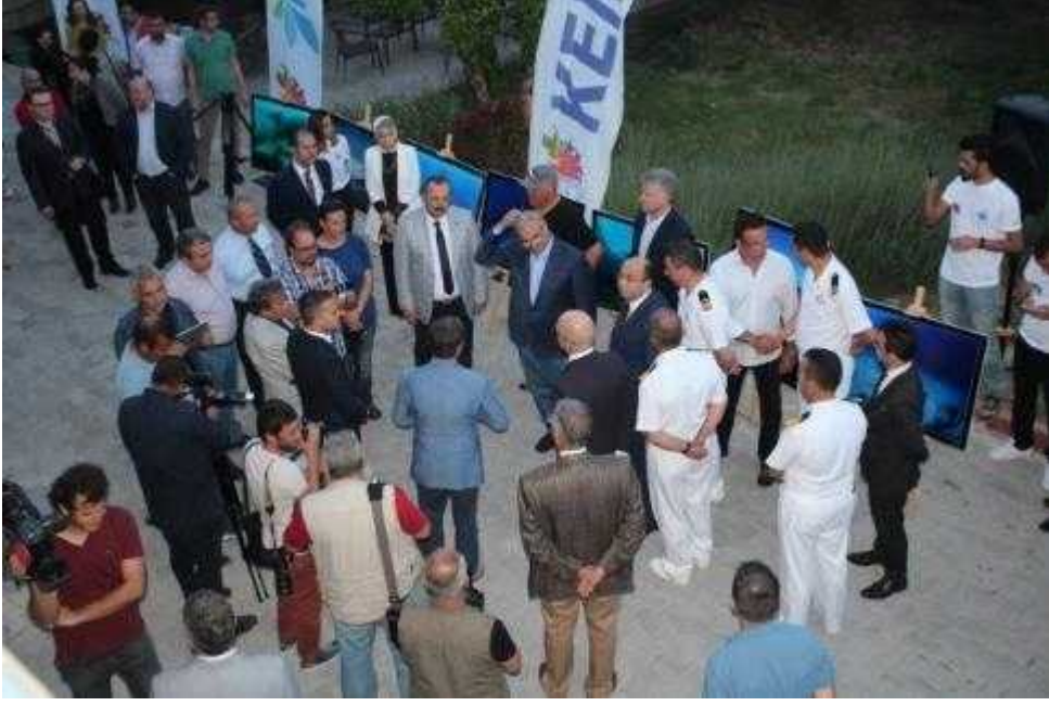
Foto 14. 16.UKSG Açılı ından bir kare