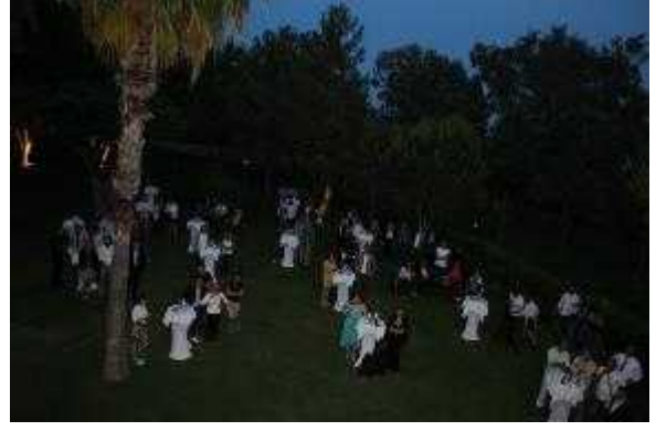
Foto 53-54. 16. UKSD Kapanı /Ödül Töreni