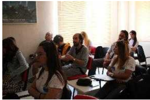
Foto 37-38. Workshop Sürdürülebilir Dalı Endüstrisi Divers Alert Network; H2020 – Green Bubbles