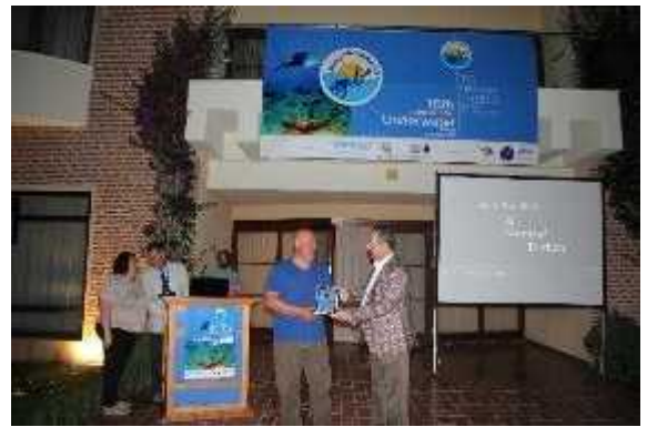
Foto 57-58. 16. UKSD Kapanı /Ödül Töreni