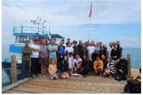
Foto 23. Yarı ma Bitimi