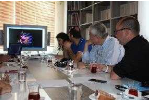
Foto 35-36. 16.UKSG Jüri Toplantısı