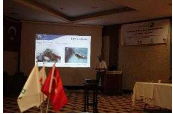
Foto 45-46. Workshop Sürdürülebilir Turizm ve Sualtı Kültür Mirası, ICOMOS-ICUCH