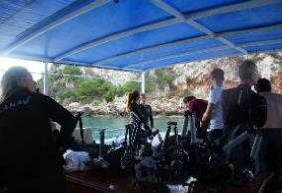
Foto 18-19. Sualtı Foto. Video Görüntüleme Yarışması öncesi Hazırlıkları