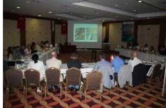
Foto 28-29. II. Akdeniz Ortaça Çalı maları Sempozyumu: “Türkiye, Polonya ve talya Ortak Projeleri”