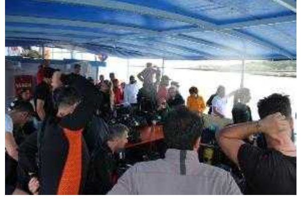
Foto 20-21. Yarı ma Hazırlıkları / Selçuk 1 Gemisinden görüntüler