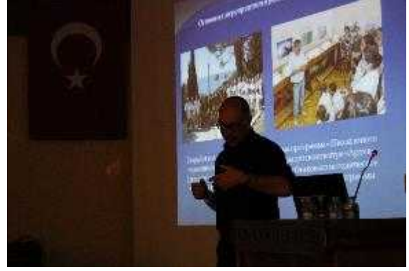
Foto 43-44. Workshop Sürdürülebilir Turizm ve Sualtı Kültür Mirası, ICOMOS-ICUCH