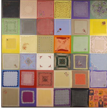
Görsel 3. Miriam Schapiro, 1971, Bağlantı / Connection. sanathayatsanat.com. (Erişim: 10.05.2023). https://bit.ly/3FOCzE5