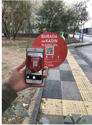
Görsel 8. Dijital Karanfil Projesi / Digital Carnation Project. https://www.haberturk.com (Erişim: 22.01.2023). https://bit.ly/3smImh5