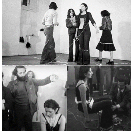
Görsel 4. Marina Abramoviç, 1974, Ritim 0 Performansı / Rhythm 0 Performance. Cavemancircus.com. (Erişim: 22.04.2023). https://bit.ly/3u2xvcT