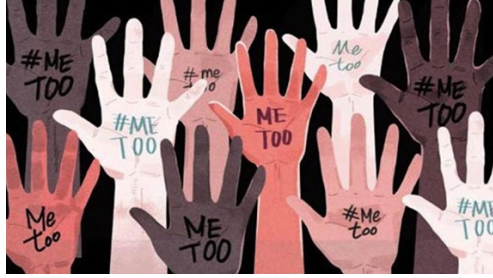
Görsel 7. #MeToo (Ben De) Hareketi Afişi / MeToo (Me Too) Movement Poster.