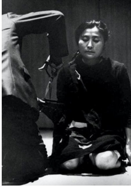
Görsel 1. Yoko Ono, 1964, Kesilmiş Parça / Cut Piece. Mardi. (Erişim: 19.05.2023). https://bit.ly/3SvFn0t