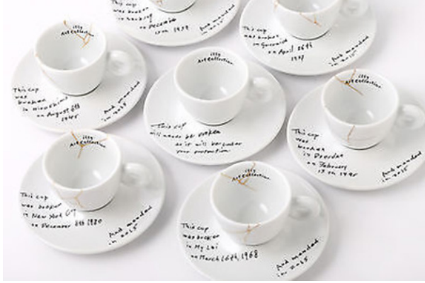
Görsel 2. Yoko Ono, 1964, Onarılmış Kupalar / Repaired Mugs. www.amazon.com.tr . (Erişim: 02.05.2023). https://bit.ly/3QMqV2R

Kendimizi kandırmayalım ve kendimizi eski ve olgunlaşmış bir medeniyet olarak düşünmeyelim. Hiçbir şekilde olgun değiliz. Ama sorun değil. Bu güzel. Yavaşlayalım ve yeni doğmuş bir bebek kadar organik ve sağlıklı bir şekilde büyümeye çalışalım. Kadın devriminin amacı bir bütün olmak zorundadır. Bu onu sonunda tüm dünya için bir devrim haline getirecektir. Kabilenin anneleri olarak, erkek şovenistlerin suçluluğunu paylaşıyoruz ve yüzümüz de onların aynası. Baştan başlamak için asla çok geç olmadığından, şimdi başlamak iyidir” (Ono, 1972).