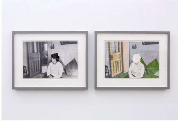
Görsel 5. Nil Yalter, Rahime, 1979. www.ideayayinevi.com (Erişim: 17.09.2023). https://bit.ly/49jQGPz

çizimler yapılırken, yemek yedirilir, suyla ıslatılır, soyulur ve kesilir. Hatta bir izleyici masadaki silahı doldurarak Abramović'e doğrultup boynuna dayamasını istediği bir kavgaya bile sebep olur. Abramović, sözünde durur ve sessizce en iyi ve en kötü tepkilere maruz kalırken kendini bir beyaz tuval gibi sunar. Performans sona erdiğinde, Abramović trans benzeri halinden sakin bir şekilde çıkar ve doğrudan kalabalığın içine yürür. Bu duygusal iş, Abramović'in inancını, konsantrasyonunu ve azmini test ederken, normalde pasif olan sanat izleyicisinin yüzeyin altında saklı destekçi ve kindar doğasını ortaya çıkarır. Abramović, performansın ardından şöyle ifade etmiştir: "Eğer seyirciye bırakırsanız, sizi öldürebilirler... Gerçekten ihlal edilmiş hissettim." Bu pasiflikle ilgili sonuçlar, ürkütücü ve büyüleyici bir ders niteliğindedir. Rhythm O performansı, şiddet konusunu ön plana çıkararak "Kişisel olan politiktir" söylemiyle kadına yönelik baskılara karşı kadın dayanışmasının zorunluluğuna dikkat çeker. Abramović'in cesur ve provokatif işi, izleyicilerde şiddetin varoluşunu sorgulama ve feminist mücadeleye katılma çağrısı niteliği taşır.