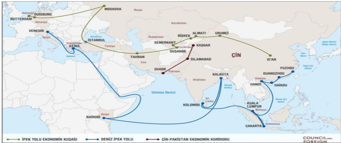
Harita 1: Kuşak ve Yol Girişimi Güzergâhları