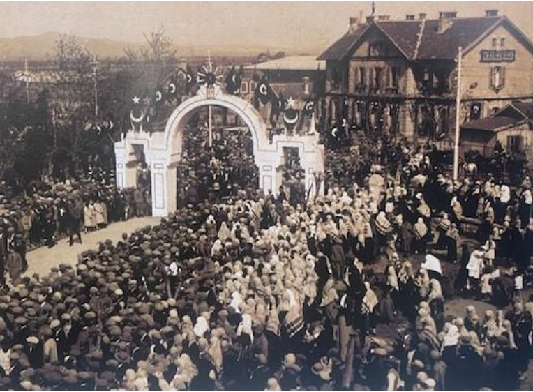
Resim 3: 1932 Yılında Balıkesir-Kütahya Demiryolu Hattının

Aynı tarihlerde belediyenin meşguliyet alanlarından biri de bölgenin eko- nomik açıdan kalkınmasını sağlayacak olan Balıkesir-Kütahya hattı demiryolu yapımıdır. 29 Kasım 1927 yılında başlanılan demiryolu hattı için Balıkesir Beledi- yesi inşaatı tamamlayabilmek için demiryolları idaresi ile birlikte hareket etmiş, ancak bu hat gerek ekonomik gerekse araç- gereç imkânlarının yetersizliğinden dolayı Almanların desteği sağlanarak bitirilmiştir. Yaklaşık 252 km olan Balıkesir- Kütahya demiryolu işletmesinin 23 Nisan 1932 yılında açılışı gerçekleştirilmiş- tir 96 (Bkz. Resim 3).