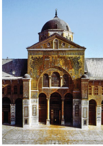
Görsel 1. Emeviyye Camii'nin Harim Kapısının Bulunduğu Cephe (Yâzîcî, 1995, C. 11, s. 108-109).

Özel, 1995, C. 11, s. 109; İbnü'l-Verdî, 1996, C. 1, s. 171; Flood, 2001, ss. 1-3; Hamza, 2008, s. 246; Can, 2019, s. 148; İstahrî, 2020, s. 67; Erkoçoğlu, 2021, C. 3, s. 500).