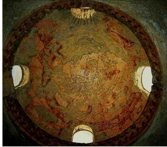
Görsel 7. Kusayru Amre'nin Astroloji Çizimlerinin Bulunduğu Hamamın Tavan Kısmı (Ettinghausen, Grabar & Jenkins, 2001, s. 46).