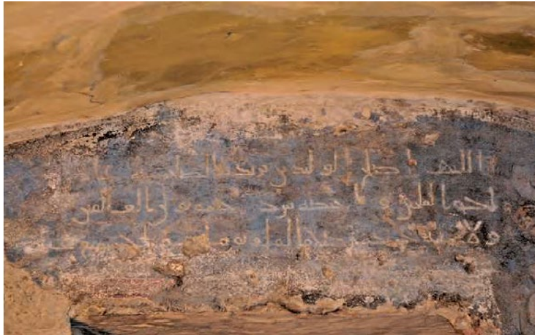
Görsel 3. Kusayru Amre'de Arkeolojik Kazılar Sonrasında Ortaya Çıkarılan Yazıt (Imbert, 2016, s. 334).