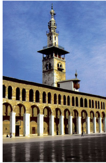
Görsel 2. Emeviyye Camii'nin Minaresi (Yâzîcî, 1995, C. 11, s. 108-109).

İslam sanatının oluşmaya başladığı bu dönemde Emeviyye Camii'ndeki sanat anlayışı yeni bir sentez içermektedir. Yapımında Rum ustalarının çalışması, bazı malzemelerin Mısır'dan getirilmesi ve bölgesel bazı unsurlar içermesiyle çeşitli kültürlerden etkilenerek şaşalı bir sanat anlayışı geliştiren "Emevî Sanatı" adeta bu camide vücut bulmuştur. Duvarlarının ve zeminin büyük çoğunluğu mermer, altın ve gümüşle kaplı olan bu camide bitkiler, ağaçlar ve şehir tasvirleri gibi altınla bezeli çeşitli motifler bulunmaktadır (İbn Havkal, 1938, s. 175; İbn Kesîr, 1986, C. 9, s. 146-148; Kalkaşandî, 1987, C. 4, s. 99-100, C. 14, s. 413; Hitti, 1989, C. 1, s. 413-414; Yâkût el-Hamevî, 1995, C. 2, s. 466; Yâzîcî, 1995, C. 11, s. 109; Ya'kûbî, 2001, s. 164; İstahrî, 2020, s. 66-67). Hatta kuzey sütununda bulunan bir tekne ve üstündeki iki kişinin olduğu motifin cennetin bir tasviri şeklinde yorumlanabilecek kadar estetik anlayışa sahip olması Emevî-İslam sanatının gelişimini göstermektedir (Friedman, 2015, ss. 25-30). Avlulu cami tipinin ilk örneği olan Emeviyye Camii bundan sonraki süreçte doğudan batıya birçok İslam beldesinin cami