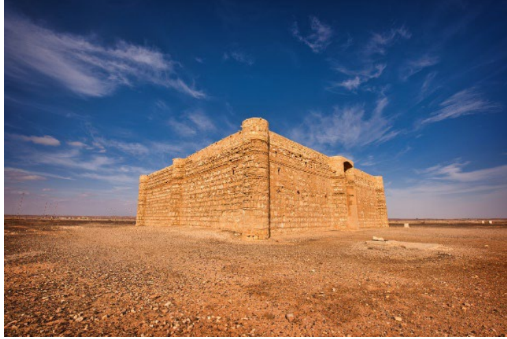
Görsel 11. Kasru'l-Harana'nın Dış Görünümü.

su imkanlarına sahip olmaması ve çölde bulunması nedeniyle bir süre sonra terk edilmiştir. Bu kasrın duvarlarına resmedilmiş çeşitli tasvirlerde ve mimarî yapısında Sâsânî ve Bizans tarzlarının etkisinin olduğu görülmektedir (Yetkin, 1965, s. 30; Erkoçoğlu vd., 2011, s. 245; Ettinghausen, Grabar & Jenkins, 2001, ss. 39-40).