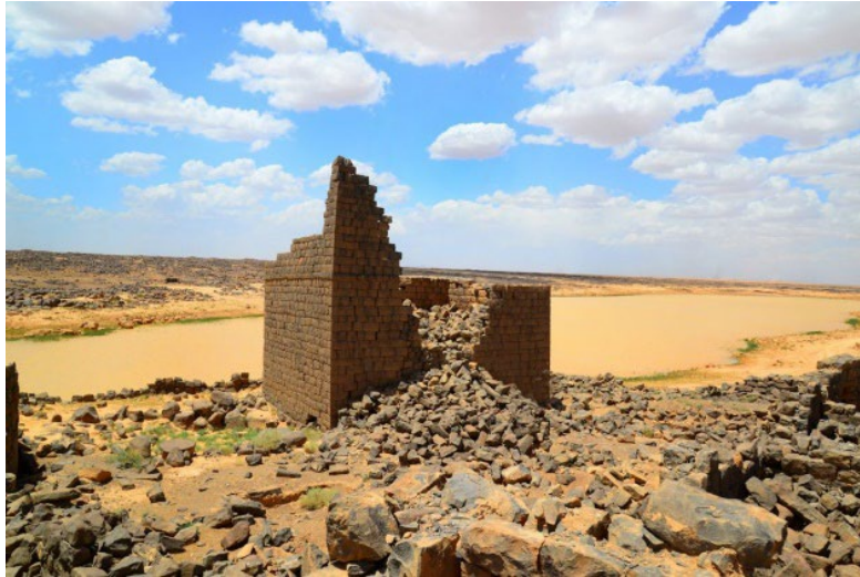
Görsel 10. Kasru Burku'nun Günümüzdeki Kalıntıları.