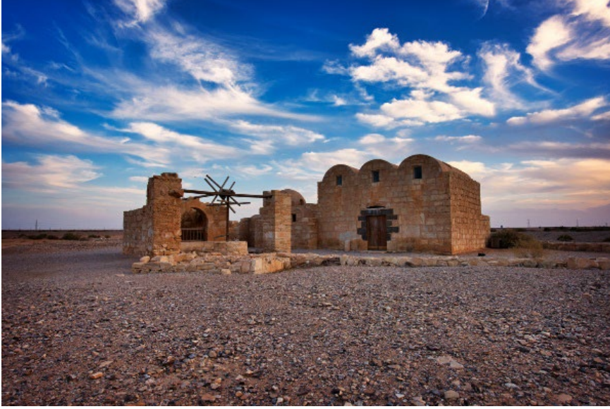
Görsel 5. Kusayru Amre'nin Dış Görünümü (© Alex Bezrukov'un seyahatlerini resmettiği https://alextravel.world/ sitesinden izniyle alınmıştır).

s. 179; Graber, 2004, s. 58; Hattstein-Delius, 2007, s. 85). Zikredilen bu özellikleriyle İslam kültür ve medeniyetinde ilklerden olan bu sarayın -her ne kadar çeşitli açılardan başka kültür ve medeniyetlerin tesiriyle inşa edilmişse de- kendinden sonraki dönemlerde mimarî ve tezyinat sanatında yeni bir tarzın ortaya çıkmasına öncülük ettiği söylenebilir.