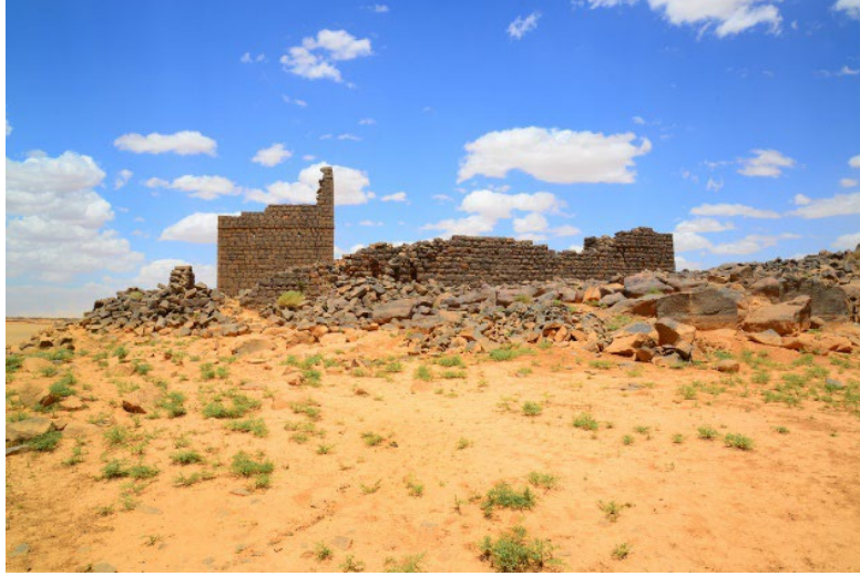
Görsel 9. Kasru Burku'nun Günümüzdeki Kalıntıları.

Kasırlardan diğer bir tanesi Kasru Burku'dur. Kasır, Ürdün'ün Ruvayşed bölgesinde bulunmaktadır ( https://archnet.org/sites/5560 , son erişim: 20.09.2022). Sarayın kalıntılarında anlaşıldığı kadarıyla düz duvarlarla çevrilmiş bir avlusu ve sıra odalardan oluşan bir yapısı vardır. Sarayın konumu ve tarımla olan alakası dolayısıyla bir av sarayı olduğu düşünülmektedir (Erkoçoğlu vd., 2011, s. 242-243). Kasru Burku'nun Velid'in halifeliği döneminde yapıldığı sanılmaktadır. Ancak Bacharach, buranın 81/701 yılında veya daha erken bir tarihte Velid halife olmadan önce veliahtlığı döneminde yapıldığını söylemektedir (1996, s. 32). Yapıda bulunan yazıt da bunu desteklemektedir (Ritter, 2016, s. 76).