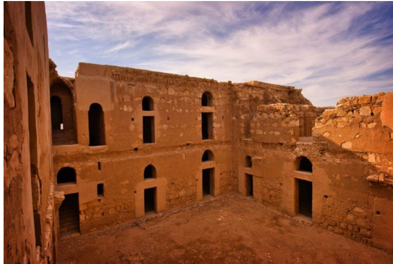
Görsel 12. Kasru'l-Harana'nın İç Görünümü.