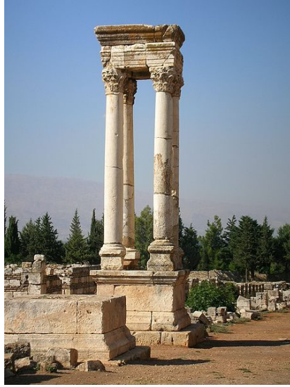
Görsel 14. Medinetü'l-Ancere şehrinin ortasına bulunan Tetrapylon.

Kaynaklarda Vâsıt şehrinin inşasına Haccâc b. Yusuf tarafından 82/702 veya 83/703 yılında başlandığı ve bitişinin 86/705 yılında olduğu belirtilmektedir (Streck, 1986, C. 13, s. 222; İbn Kesîr, 1986, C. 9, s. 118; Belâzürî, 1988, s. 284; Söylemez, 2012, C. 42, s. 542). Irak'ın güneyindeki bataklıklar bölgesinde, Kûfe ve Basra'nın tam ortasında kurulmuştur. Şehrin kuruluş amacı Haccâc b. Yusuf'un Kûfe'ye getirdiği Suriyeli askerlerle Kûfeliler arasında sorunların baş göstermesidir. Bataklıkları kurutarak bölgeyi ihya eden Haccâc, Şam'daki hilafet sarayını örnek alarak 400x400 zirâ' büyüklüğündeki sarayını ve buranın hemen yanına 200x200 zirâ' büyüklüğündeki camiye inşa ettirmiştir. Pazar ise şehrin merkezinden ziyade doğu bölgesinde kurulmuş ve her meslek erbabına ayrı ayrı yerler tahsis edilmiştir. Vâsıt şehrinin kurulduğu bölgenin ticaret yollarının geçiş güzergahında olması şehrin önemini daha da artırmıştır. Haccâc burada Dîmas adıyla zikredilen bir hapisane de inşa ettirmiştir (Bahşel, 1967, s. 84). Şehrin imarı için çok büyük meblağlarda para harcanmıştır. Şehir, Emevî Devleti'nin yıkılışına kadar Irak bölgesinin idarî merkezi olarak kullanılmıştır (Streck, 1986, C. 13, s. 221-222; Erkoçoğlu vd., 2011, s. 209-211; Söylemez, 2012, C. 42, s. 541-542; Yılmaz, 2015, s. 3-29).