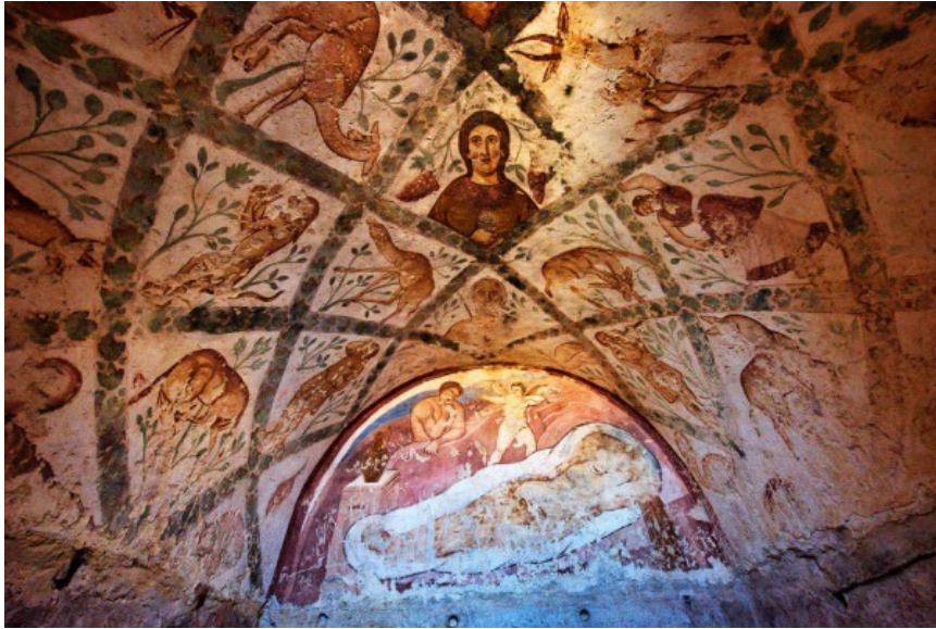
Görsel 6. Kusayru Amre'nin iç görünümü.