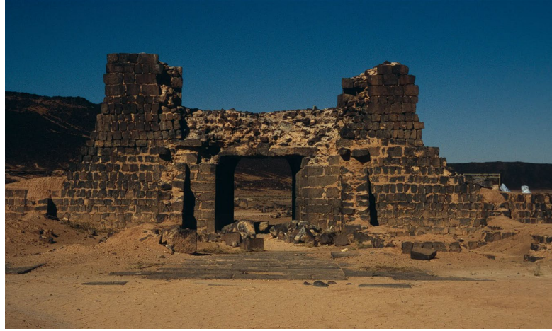
Görsel 13. Kasru Seys'in kalıntıları.