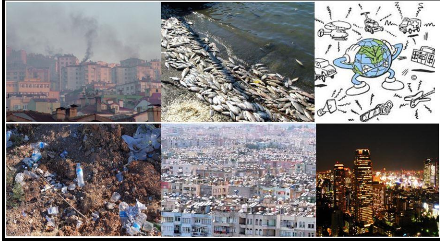
Şekil 1: Başlıca Çevre Sorunları

Çevre sorunlarını önlemeye yönelik korumacı akımlar 20. yüzyılın ortalarında ortaya çıkmıştır. 1960'lardan itibaren ulusal ve uluslararası kuruluşların gündemleri arasına girmiş ve zaman içinde siyasete bile yön vermeye başlamıştır. Bu kapsamda Stockholm Konferansı (1972), Brutland Raporu (1987), Rio Konferansı (1992) ve Johannesburg Zirvesi (2002) gibi uluslararası organizasyonlar düzenlenmiştir.