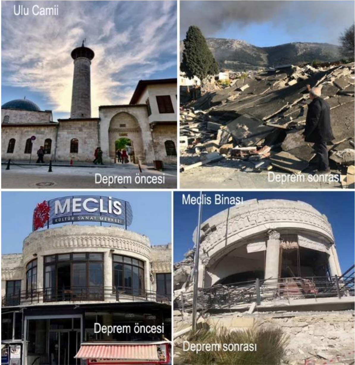
Fotoğraf 4. Ulu camii ve Eski Meclis Binasının deprem öncesi ve sonrası durumları.