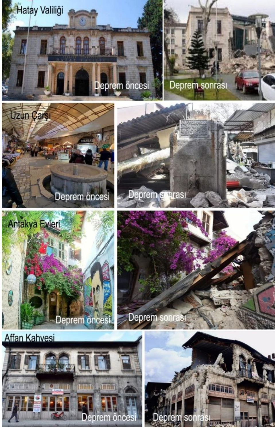
Fotoğraf 5. Hatay Valiliği, Uzun Çarşı, Antakya Evleri ve Affan Kahvesi'nin deprem öncesi ve sonrası durumları.

Depremde yıkılan ya da ağır hasar alan yapılar değerlendirildiğinde Antakya'da tüm dönemlere ait kentsel kültürel mirasın çok büyük kayba uğradığı görülmektedir.