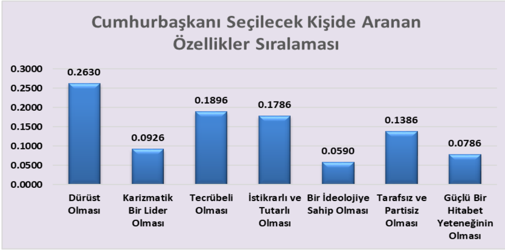
Şekil 2. Cumhurbaşkanında Aranılan Özelliklerinin Görel Önem Değerleri

Adım 6: Genel Öncelik Sıralamasının Elde Edilmesi: Analitik Hiyerarşi sürecine göre hesaplanan özelliklerin yüzdelik ağırlıklarına göre oluşturulan Grafik Şekil 2’ de yer almaktadır.