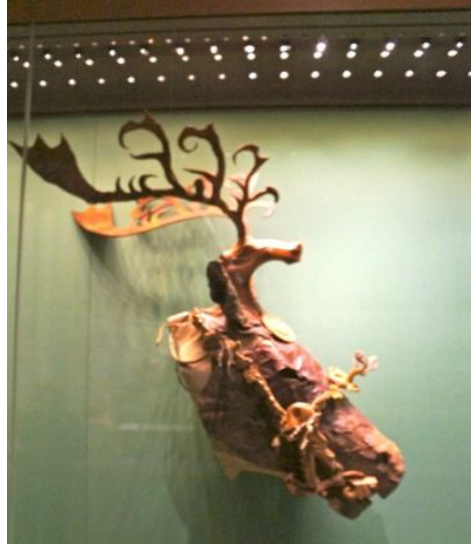
Resim 10: Deri At Koşum Takımı, Pazırık Kurganı 5, 4-3-th B.C., Ermitage Devlet Müzesi, (Yücel-Sazak 2012).

Türklerde kutsal hayvan olan geyik, yırtıcı bir kuşla tasvir edildiğinde; kurban edilerek öbür alemde canlanacağına ve tabiatüstü bir özellik taşıdığına inanılan geyiği temsil etmektedir 85 . Tabak II'deki geyik motifi de yırtıcı bir kuş'la birlikte resmedilmiş olduğundan Alpin ruhu için adanan kurbanı sembolize etmektedir. Pazırık Kurganları'ndan çıkarılan kağanın ruhuna kurban edilmiş ve onunla birlikte kurgana konulan muhteşem deri, altın ve at kılı bezemeli geyik maskeli atlar da aynı anlamda kurban edilmiş geyiği sembolize etmektedir ( Resim 10 ).