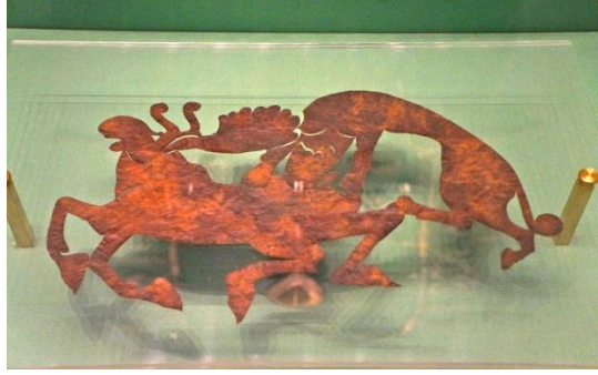
Resim 4: Kut-güç alış-veriş sahnesi, Deri Aplik, Pazırık Kurganı. Envanter No:1295/250 M.Ö.5-4.yüzyıl, Ermitage Devlet Müzesi, (Yücel-Sazak 2012).

aynıdır. Tek fark Pazırık'ta geyiği kurt yerine bars avlamaktadır. Bu da Türk boyları arasındaki ongun farklılıklarından kaynaklanmaktadır.