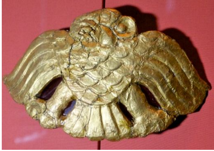
Resim 9: Ahşap üstü altın kaplama, Kartal Motifi, eyer Süsü, Başadar Kurganı, 6-7th B.C., Ermitage Museum, (Yücel-Sazak, 2012).

Kartal/Doğancı/Tuğrul kısaca yırtıcı kuş ikonografisi hakkındaki en eski yazılı kaynak Beyzare'nin Sahib-i Türk/ Melikü't- Türk adlı kaynağa dayanarak doğancılık üzerine halife Mehdi (775-85) için yazdığı Arapça bir risalede geçmektedir 79 . Beyzare'de olduğu gibi pek çok Rus kaynağa göre de Hazar Harezmi kağanlığı bölgesi ve Hazar Denizi kıyılarında yırtıcı kuş ikonografisinin eski bir gelenek olduğu yazılmaktadır. Bu kaynaklara göre; M.Ö. 1000'de makalemizde geçen tabakların yapım ve bulunuş yeri olan Kama Irmağı bölgesinde Ananino kültürüne ait ilk bronz yırtıcı kuş figürleri bulunmuştur 80 . Rus kaynaklarında Obi bölgesi sahasındaki yırtıcı kuş figürleri Uğurlarla ilişkilendirilmektedir 81 . Öte yandan tabaktaki kuşun duruşu ile aynı duruşa sahip kartal /yırtıcı kuş figürünü, Altay bölgesinde M.Ö. 6-7. yüzyıla ait Başadar kurganından çıkarılan ahşap-altın kaplama kartal figüründe de görülmektedir (Resim 9).