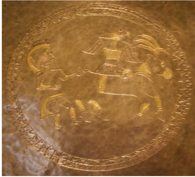
Resim 8: Tabak II'den Detay.

Araştırma konumuz olan Tabak II, Ermitaj'da Obi hazinesi adı altında sergilenmiştir. Tabak II daire şeklinde X. yüzyılda yapıldığı düşünülen İdil Bulgarlarına ait altın varak kabartmalı gümüş bir tabaktır (Resim 7). Tabağın tam merkezindeki geometrik süslemenin çevrelediği daire içinde yırtıcı bir kuşun, bir geyiğin ve bir alpin yer aldığı mitolojik bir sahne bulunmaktadır (Resim 8).