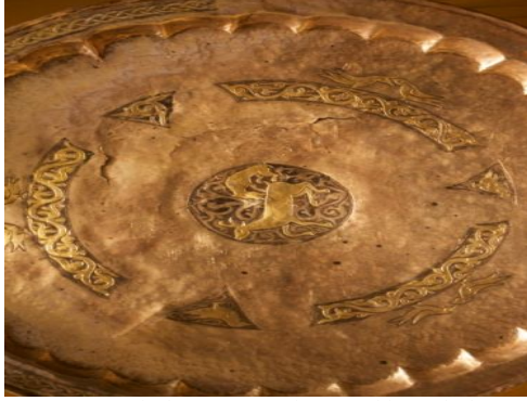
Resim 6: Tabak I'in esas duruş şekli. Tabak sol dış kenarında zencerek, üstte böke yukarı doğru yükselen kurt ve geyik.

Tabağın Resim 6'daki gibi duruşu, zencerek motifinin de sol tarafı yani Türklerin batı kanadını temsil etmektedir. Batı kanadı da tabağı yapan İdil Bulgarlarının Türk coğrafyası içinde bulunduğu yönü işaret etmektedir.