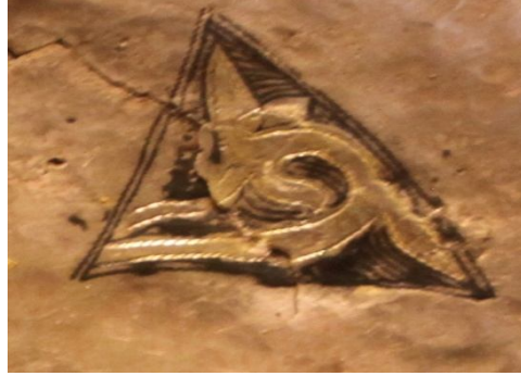
Resim 3: Tabak 1'den detay.

Kut-güç alış-veriş sahnesi 'nde yer alan kurt, Türklerde bir hayvan ata sembolü ve Türklerin kutsal bir hayvanı idi 68 . Yaşadıkları coğrafyanın zorlu koşullarını onlarla birlikte yaşayan ve paylaşan en güçlü hayvan kurt idi. Millî kült haline gelmiş olan bu hayvanın Tanrı ile bağlantı kurduğuna inanılıyordu 69 . Aynı sahnede avlanan geyik ise Türkler için kurt gibi kutsal bir hayvandır. Geyik motifini dağ keçisi motifini ile birlikte M. Ö. 1000'li yıllardan itibaren İskitler de dahil olmak üzere Avrasya'da yaşayan bütün Türk boylarında tasvir edilmiş ve ongun olarak kabul edilmiştir 70 . Dede Korkut'ta erkeği için buğa (boga, buka) kelimeleriyle karşılanan sığır cinsi hayvan 71 , yer-su kültürünü temsil eden tüm toynaklı hayvanların erkek cinsleri için kullanılmıştır 72 . Yukarıda av kültüründen bahsettiğimiz alplık ve ad almayı temsil eden kut-güç alış-veriş sahnesi Tabak 1'de geyiği avlayan kurt motifini ile sembolize edilmiştir. Bu sahne M.Ö. V-IV. yüzyıla ait Pazırık kurganlarından çıkarılan deri bir aplik üzerinde de görülmektedir ( Resim 4 ). İki sahne hayvanların konumları, kurtun geyiği avlarkenki hamlesi ve hayvanların resmedilme üslûbu açısından birebir