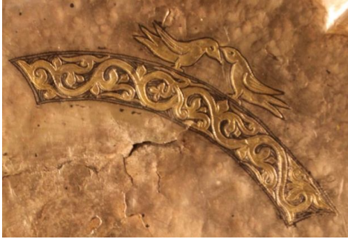
Resim 2: Tabak 1'den detay.

Tabak 1 daire şeklinde yaldızlı kakma-kabartmalı XII-XIII. yüzyıl yapımı İdil Bulgarlarına ait gümüş bir tabaktır ( Resim 1 ). Tabağın tam merkezindeki daire içinde, arka planda bitkisel formda süslemelerin bulunduğu, bir geyiğe saldıran kurt motifinin yer aldığı kut-güç alış-veriş sahnesi görülmektedir. Bu mücadele sahnesini çevreleyen üç parçadan oluşan bitkisel süslemeli şeridin üstünde, birbirlerine karşılıklı bakan bir çift kuş ( Resim 2 ) durmaktadır. Bitkisel süslemeli şeridin parçaları arasında üçgenler içinde iki adet aynı kuştan, bir adet ise kuş başını andıran bitkisel süslemenin başlangıç noktasını oluşturan figür ( Resim 3 ) yer almaktadır. Tabağın en dışında ise tabağın sadece yarısını çevreleyen zencerek motifini bulunmaktadır.