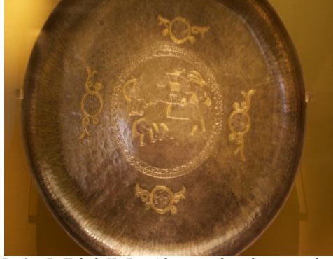
Resim 7: Tabak II: Bir Adam, geyik ve bir yırtıcı kuş (kartal), altın varak kabartmalı gümüş tabak Tomsk Bölgesi, Ural ve Batı Sibiry. İdil Bulgarları X. (?) yüzyıl, Ermitage Devlet Müzesi, (Yücel-Sazak, 2012).