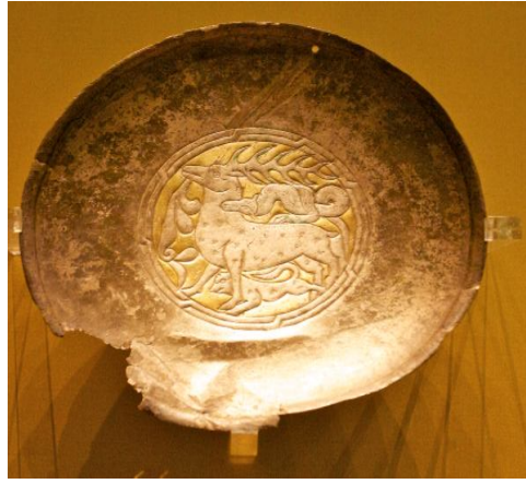
Resim 12: Tabak III: Yılanın Geyiğe Saldırması, Yıldızlı Gümüş Tabak, Ural Bölgesi ve batı Sibirya, İdil Bulgarlar, X. yüzyıl, Ermitage Devlet Müzesi, (Yücel-Sazak, 2012).

Tabak II'de yırtıcı kuş, geyik ve silahsız olarak resmedilmiş alp motiflerinin birlikte yer aldığı sahne; Türk kültüründe Alp'in ruhunun ölümden sonra bir kartal olarak Tanrı'nın yanına, bu yolculukta ve diğer dünyada kendisine yardım etmesi için kurban edilen geyik ile birlikte uçmasını sembolize etmektedir. Tabaktaki alp, kartal ve geyiğin üçünün de