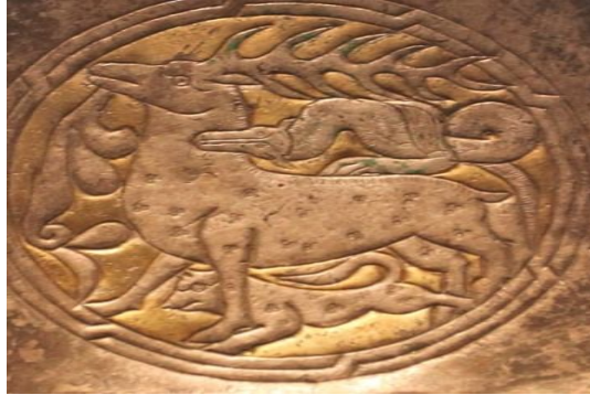
Resim 13: Tabak III'ten detay. Kurt başlı böke'nin (yılan) geyikle mücadelesi.

Tabak III'de alplık kazanmak için yapılan kut-güç alış-veriş sahnesi 'ndeki kurt başlı böke (yılan) Alp'i, geyik Alp'in yenmesi gereken düşmanı, geyik'in sol tarafında aşağı doğru sarkan yılan'la aynı formdaki boynuz geyiğin kırılan boynuzunu, geyik'in ve kurt'un üzerlerinde üç daireden meydana gelen çintemani 95 motifi ise alp'in düşmanlarını yendiğini ve alplık sembolü olarak çintemani bu motiflere (geyik ve kurt) aktarıldığını ifade etmektedir (Resim 13).