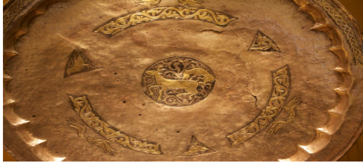
Resim 1: Tabak I: Bir vahşi hayvanın bir geyiğe saldırısı sahnesi, Yıldızlı kakmakabartmalı, kararmış gümüşlü tabak. Barsov Gordok arkeolojik alanı, Surgut bölgesi, 1975. Envanter No: ZO-743. İdil Bulgarları XII-XIII. yüzyıl, Ermitage Devlet Müzesi, (Yücel-Sazak, 2012).

yüzyıl Yamal 64 . N. V. Federov ise B. I. Marşak'ın ayırdığı bu üç bölümü Bulgar, Macar-Ural, günümüz Batı Sibiryası olarak tanımlamıştır. N. V. Federov, aslında bu bölümlerin maden sanatının temelini; ikonografik (binici, doğancı ve vahşi hayvan), mitolojik konuları ve resim üslubu açısından eski Ural Ekolü'ne dayanmakta olduğunu tespit etmiştir. Bu maden eserlerdeki silah, at ekipmanı ve giyim süslemeleri de eski Bulgarlarla aynıdır 65 . B. İ. Marşak Ural bölgesi ve kuzeydeki boyların, VI-VII. yüzyıllar arasında Sogd ve Harezmi bölgesinden ticaret yoluyla gümüş, altın tabak ve ziyafet takımlarını alıp kürk sattıklarını belirtmiş, Sogd ve Harezmi bölgesi maden işçiliğini Ural madenlerinden daha ince işçiliğe sahip olması yönüyle ayırmıştır 66 . Rus ilim adamlarının araştırma konumuz olan üç tabak için ortak olarak vardıkları sonuç: tabakların İdil Bulgarlarına ait oldukları; İdil Bulgarlarının sanat için madeni kullanmalarının temelini M.Ö. 1000'li yıllardan itibaren Sibiryalı-Ural hattına dayandığı; tabakların içindeki motiflerin ikonografik ve üslub olarak M.Ö.1000'den X. yüzyıla kadar Ural Ekolü'ne dayandığıdır. Ayrıca Rus ilim adamları tabakların içindeki motiflerin neyi sembolize ettiğinin hala çözemediğini bu konunun karmaşık bir konu olduğunu da kabul etmişlerdir 67 .