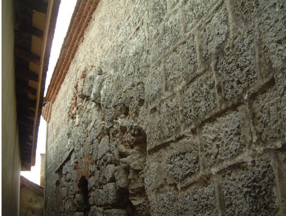
Fot. 5: Edirne- Lalapaşa Kilise- Cami'nin kuzey cephesi