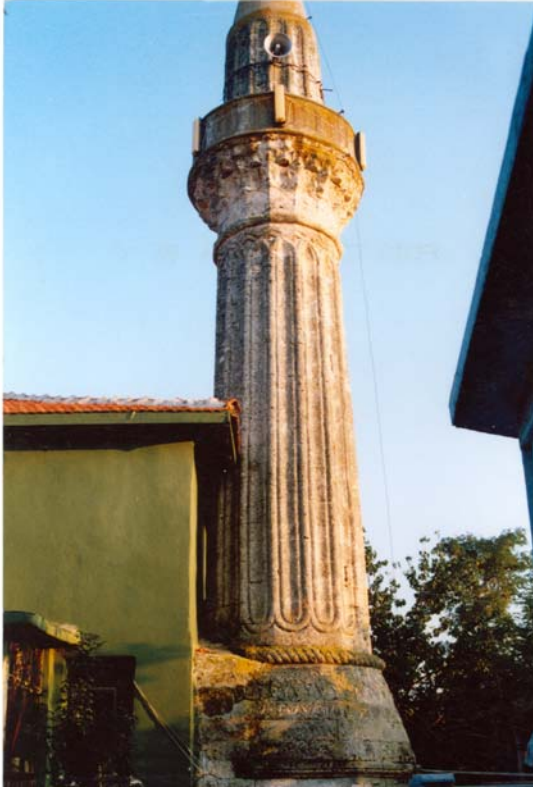
Fot. 16: Edirne- Lalapaşa- Sarıdanışment Köyü Camisi'nin Minaresinin onarım öncesi durumu