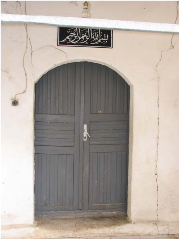
Fot. 9: Edirne- Lalapaşa Kilise- Cami'nin harim giriş kapısı