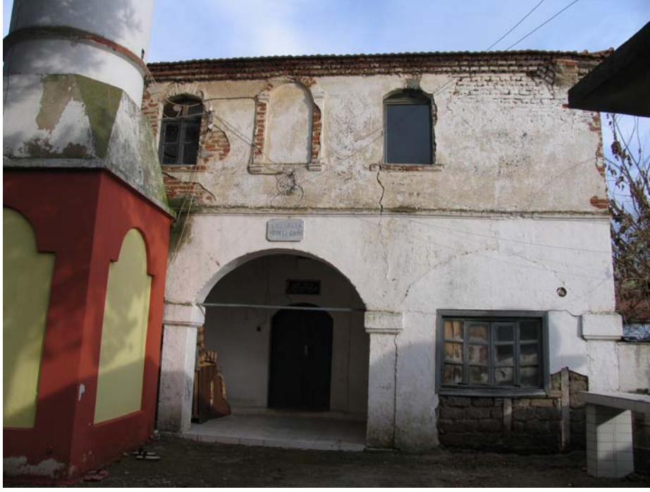
Fot. 4: Edirne- Lalapaşa Kilise- Cami'nin batı cephesi