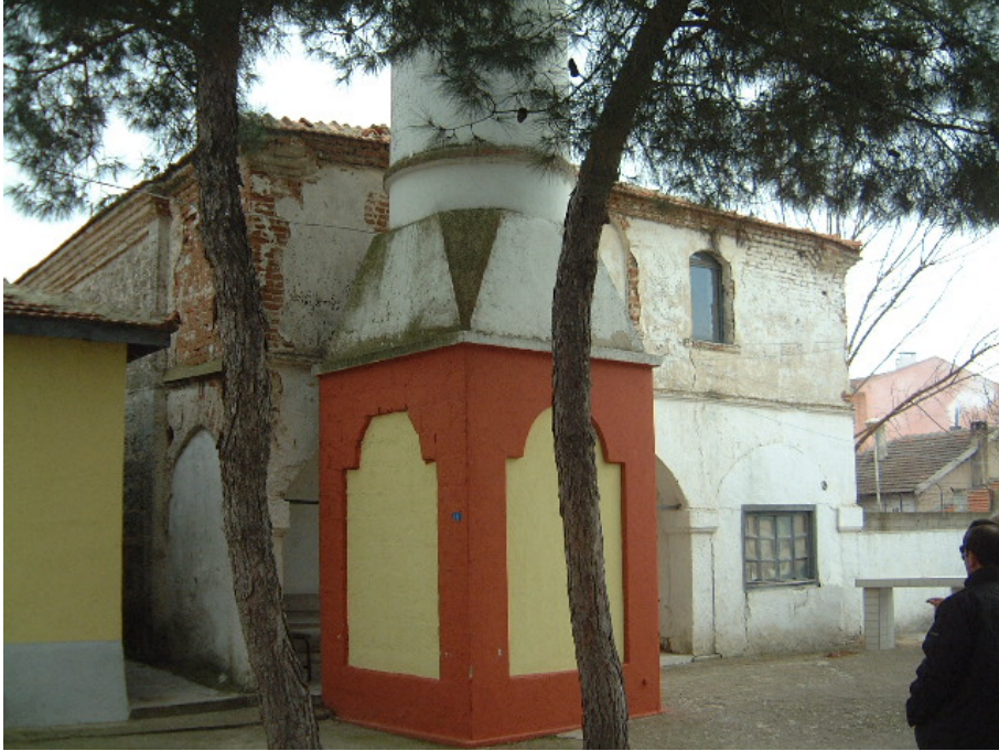
Fot. 13: Edirne- Lalapaşa Kilise- Cami'nin minare kaidesi