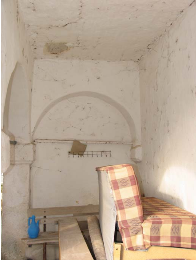
Fot. 7: Edirne- Lalapaşa Kilise-Cami'nin son cemaat yerinin kuzey kanadı