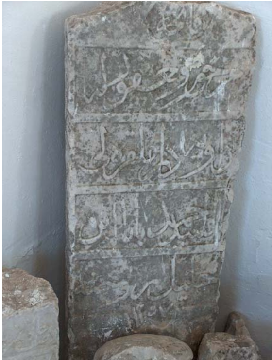
Fot. 15: Edirne- Lalapaşa- Sarıdanışment Köyü Camisi avlusundaki mezar taşlarından bir görünüm