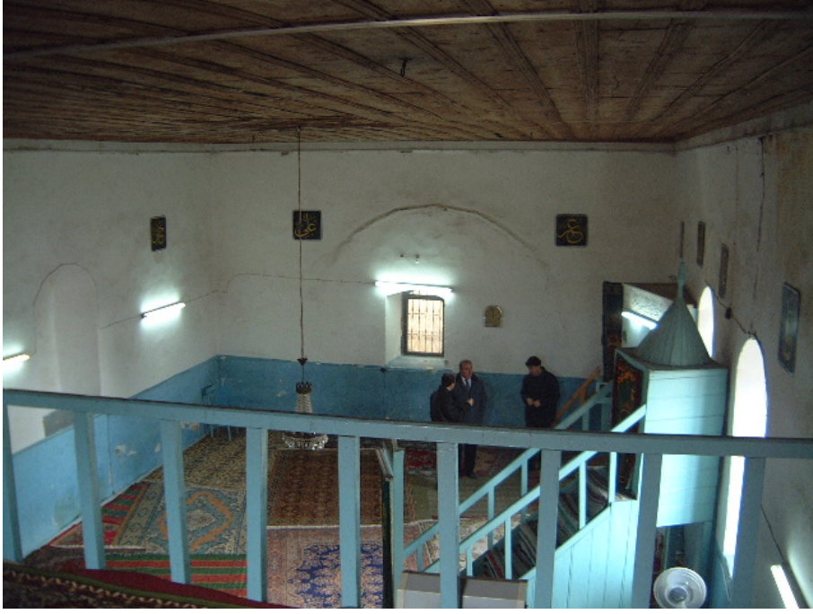
Fot.10: Edirne- Lalapaşa Kilise- Cami'nin harim mekanı