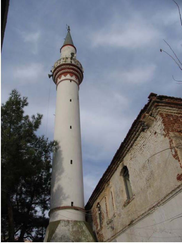
Fot. 12: Edirne- Lalapaşa Kilise- Cami'nin minaresi