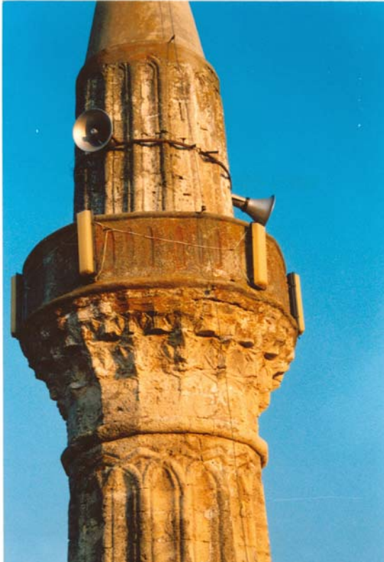
Fot. 17: Edirne- Lalapaşa- Sarıdanışment Köyü Camisi'nin minare şerefesinin onarım öncesi durumu