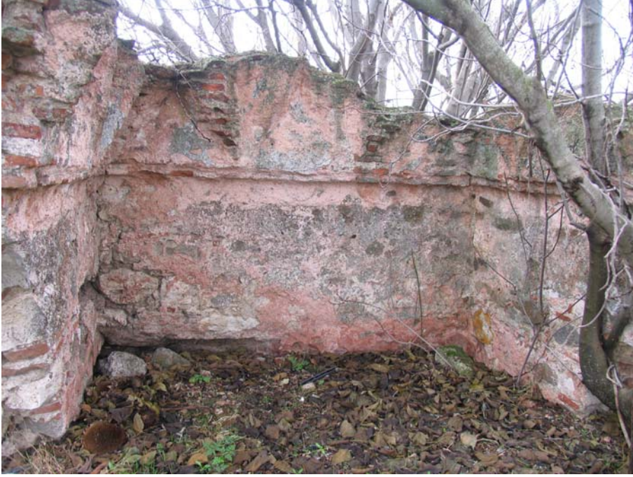
Fot. 3: Edirne- Lalapaşa Hamam kalıntısının sıcaklık mekanına (?) ait kısımlardan bir başka görünüm