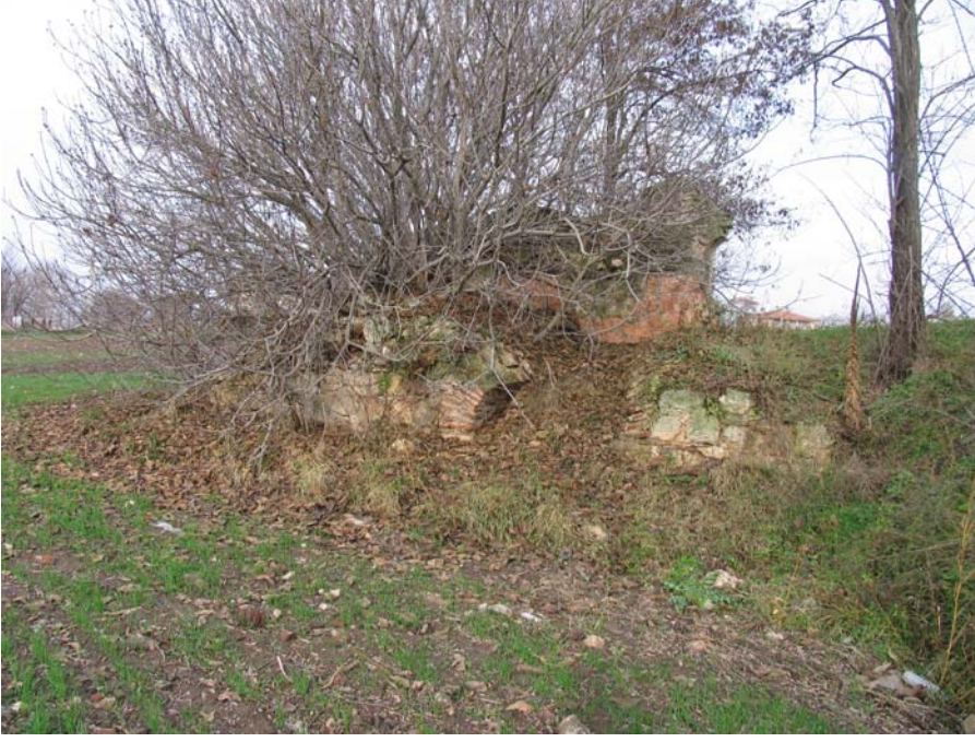
Fot. 1: Edirne- Lalapaşa Hamam kalıntısının genel görünümü