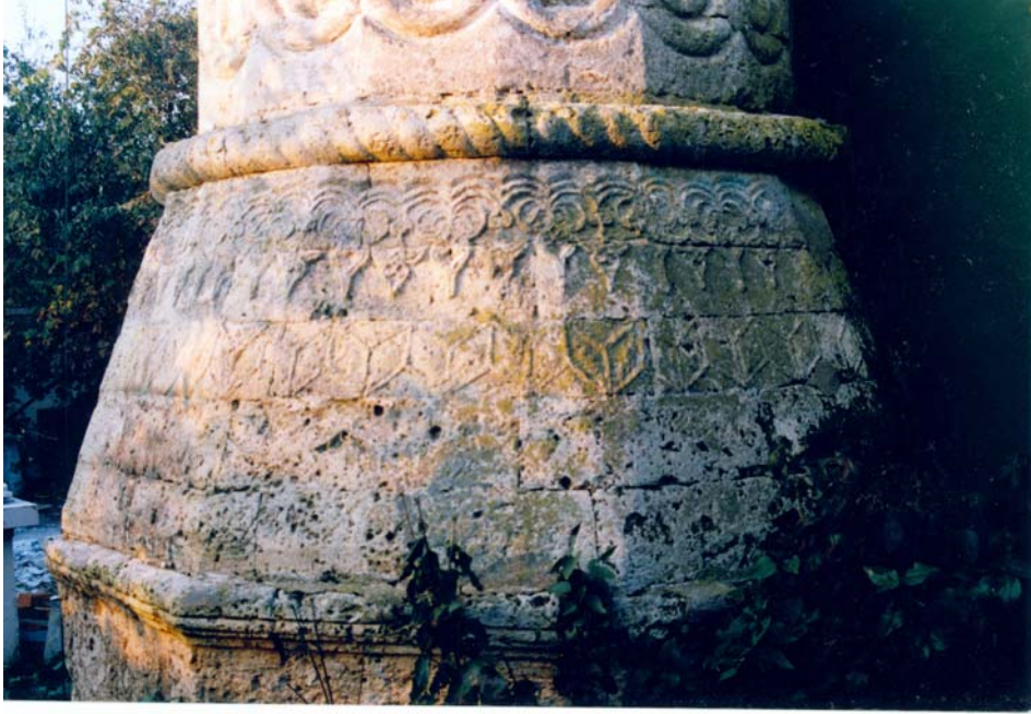
Fot. 18: Edirne- Lalapaşa- Sarıdanışment Köyü Camisi'nin minaresinin pabuç kısmındaki süslemeler