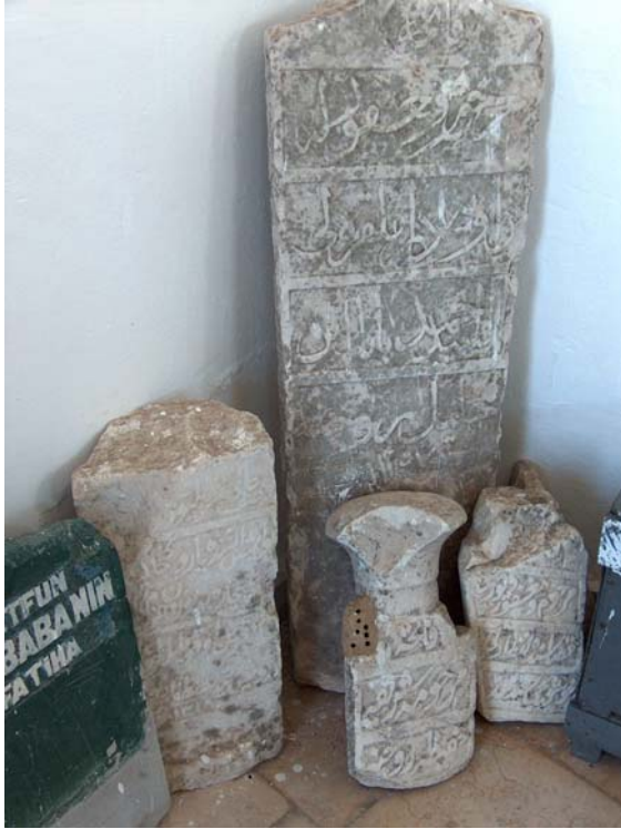
Fot. 14: Edirne- Lalapaşa- Sarıdanışment Köyü Camisi avlusundaki mezar taşlarından bir görünüm