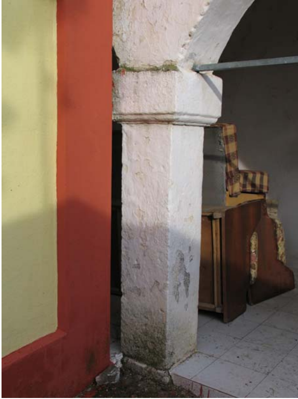
Fot. 8: Edirne- Lalapaşa Kilise- Cami'nin son cemaat yerindeki ayaklardan bir görünüm