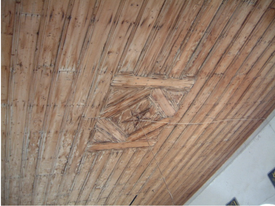
Fot. 11: Edirne- Lalapaşa Kilise- Cami'nin harim tavanı