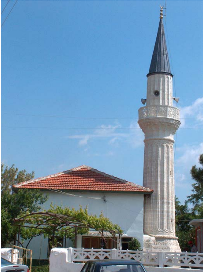
Fot. 18: Edirne- Lalapaşa- Sarıdanışment Köyü Camisi'nin onarım sonrası durumu