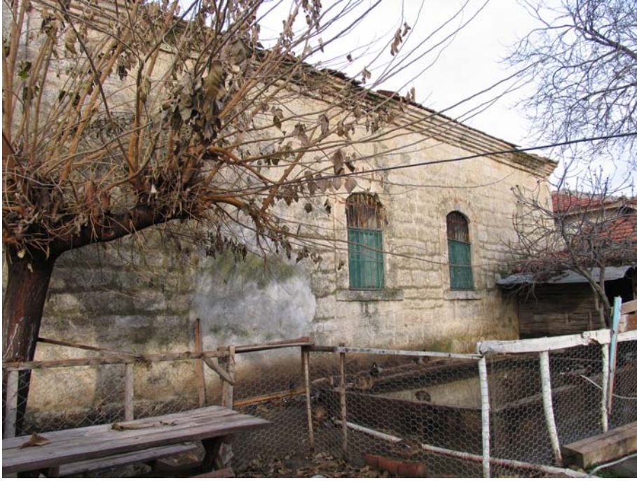
Fot.6: Edirne- Lalapaşa Kilise- Cami'nin güney cephesi