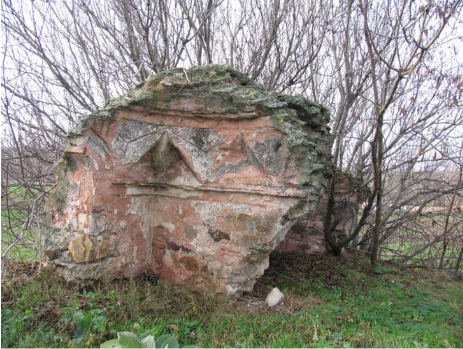
Fot. 2: Edirne- Lalapaşa Hamam kalıntısının sıcaklık mekanına (?) ait kısımlardan bir görünüm