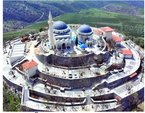
Şekil 5: Ökkeřiye Türbesinden Bir Görüntü

üzerine çevredekiler müsaade etmese de Peygamber kabul eder, sırtını açıp Ukkaře'nin kırbaç vurmasını bekleyen Hazreti Muhammed (s.a.v.), peygamberlik mühründen öpülür. Ukkaře sözlerine řöyle devam eder; ‘Kısastaki gayem budur Ya Resulallah, eđer sizde bir hakkım varsa an-nemin sütü gibi helal olsun’ der (Çolak, 2008). Hazreti Ömer'in Gaziantep'i fethi sırasında řehit düşen Ökkeřiye hazretleri bulunduğu bölgeye de kendi adını vermiştir (Kültür ve Turizm Bakanlığı, 2022). Türbenin olduđu yerde bir cami ve mesire alanı bulunmaktadır.