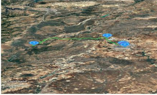
Şekil 4: İnanç turizmi rotası türbeleri kapsayan harita

hazretlerinin türbesi dıřındaki diđer altı türbe birbirlerine yürüme mesafesindedir.