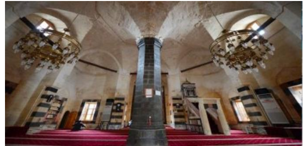
Şekil 2: Şeyh Fethullah Cami ve Külliyesi harim kısmı

Şeyh Fethullah Cami ve Külliyesi: Halk arasında 'Şıh Ocađı' 'Şıh Cami' 'Aşađı Şeyh Cami' olarak da anılmaktadır. Caminin banisi ilk halife Hazreti Ebubekir'in soyundan geldiđi bilinen Şeyh Fethullah efendidir. Gaziantep'in Şehreküstü mahallesinde yer alan bu eserin bahesinde Antep savunması sırasında şehit olan Kara Yılan (Molla Mehmet) kabri yer almaktadır. Fransız saldırısı sırasında bu cami hastane olarak kullanıldıđından ötürü top mermilerin hedefi olmaktan ıkmıştır. Bu sebeple caminin bulunduđu mahalle bile neredeyse hiç hasar görmemiştir. 1564 tarihinde yapılan bu cami Gaziantep'te yapıldıđı dönemden günümüze hiç deđiştirilmeden gelen tek camidir. Harim, ortadan sekizgen tař ayađa oturan ve yelpaze řeklinde açılan tonozlar ile askı kemere bađlanan bir örtü sistemine sahiptir (Şekil 2). Bu mimari özellikleri Dünyada bir tek Şeyh Fethullah camide bulunmaktadır. Şehirdeki diđer camilerde çođunlukla Osmanlı mimarisi göze arparken bu eserde Seluklu mimarisi görölmektedir.