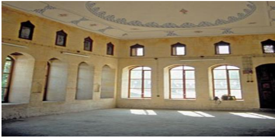
řekil 1: Gaziantep Mevlevihane'si solumluğunun iinden bir görünüř

okuyucularına aktarmıřtır. Son olarak tekkenin kitabesinde yer alan Hazreti Mevlana'nın Mesnevisinden ilk mısraya yer vermektedir (Güler, 2016). Bu tekkenin mimari yapı olarak da olduka ilgi ekici özellikleri bulunmaktadır, řehrin ticaret merkezinde bulunan tekkenin, üç farklı evreden giriři vardır. Bunlardan en önemlisi minaresi altından geilerek ulařılan kemerli cümle kapısıdır (İslam Ansiklopedisi, 1996). Günümüzde dergâh diye adlandırılan kısım müze haline getirilmiřtir.