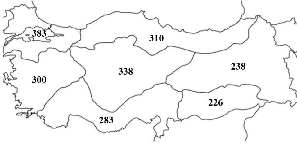
Şekil 2. Okul sayılarının bölgelere göre dağılımı

Şekil 2’de görüldüğü gibi Atatürk veya aile üyelerinin isimlerini taşıyan okul sayısının en fazla olduğu bölge Marmara Bölgesi’dir (f=383). Bu bölgeyi İç Anadolu Bölgesi (f=338), Karadeniz Bölgesi (f=310) ve Ege Bölgesi (f=300) takip ederken Akdeniz Bölgesi’nde bu özellikteki okul sayısı 283, Doğu Anadolu Bölgesi’nde 238 ve Güneydoğu Anadolu Bölgesi’nde 226 olarak tespit edilmiştir.