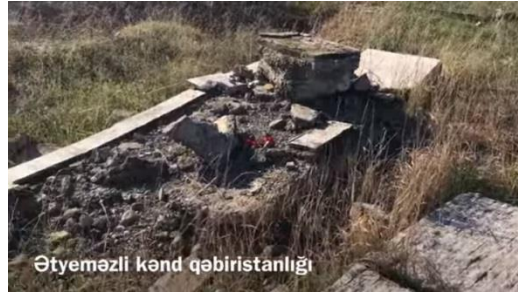
Ağdam Şehri Etyemezli Köy Mezarlığı

https://www.youtube.com/watch?v=FLPT8_2skco&t=914s Erişim 20.05.2023