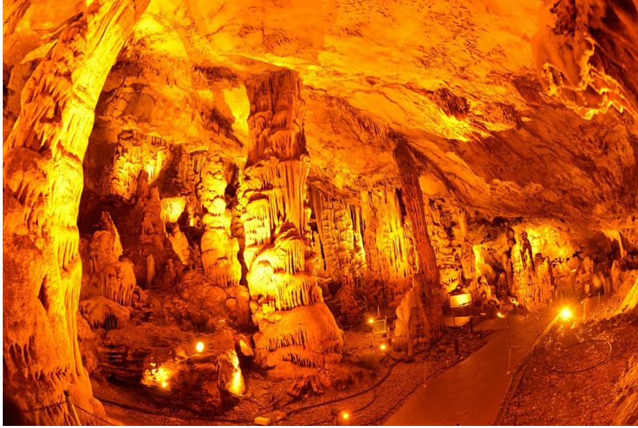
Görsel 4. Ballıca Mağarası (Tokat Valiliği, 2015)

Yeşilyurt depresyon alanında yoğun bir şekilde şeker pancarı tarımı yapılmaktadır. Şehrin logosunda vücut bulan şeker pancarı figürü halkın geçim kaynakları arasında en önde gelen zirai üründür. Çekerek Nehri'nin geçtiği ilçenin logosunda yeşilliği temsil etmek ve ismine atıfta bulunmak amacıyla yeşil halkalar kullanılmıştır (Şekil 11).