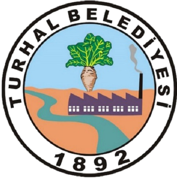
Şekil 10. Turhal İlçe Belediye Logosu.

ise ilçedeki zirai ve sanayi faaliyetlerine ek olarak Yeşilirmak ve Turhal Ovası logoda resmedilmiştir. Anlaşılır bir şekilde fiziki ve beşerî unsurlarla sembolleştirilmiş olsa da şehrin tarihi varlığını temsil eden Turhal Kalesi, ilçede yer alan Kesikbaş Camii ve Türbesi gibi tarihi ve halkın inancını simgeleyen simgelerle sembolize edilebilir.