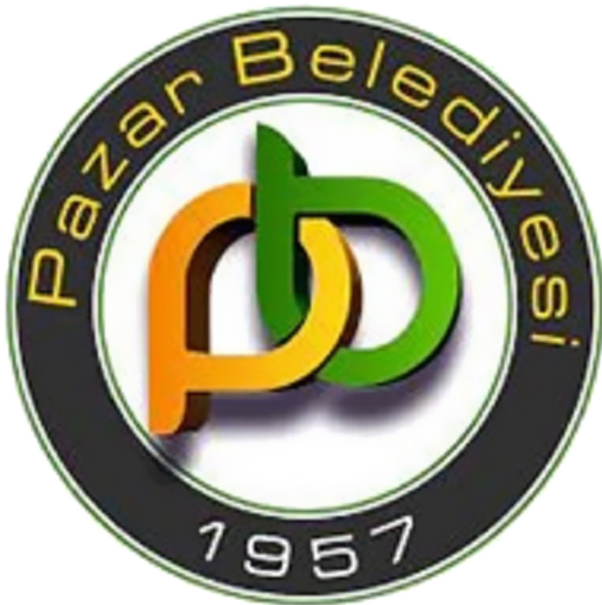
Şekil 6. Pazar İlçe Belediye Logosu.

Şehirlerin fonksiyonları ve politik yapılarında meydana gelen değişimler kimliğin yansıması olan logoları da etkilemektedir. Zile Belediyesi yöneticileri logo hususunda mutabık olamamış yeni logo tam anlamıyla kabul görmemiştir. Dolayısıyla yazışmalarda iki logo da kullanılmaktadır. Eski logoda şehrin inancını ve İslam'ı simgeleyen bir hilal, Roma Dönemi'nde aynı zamanda şehre ismini veren komutan Sulla tarafından yaptırılan Zile Kalesi ve günümüzde sit alanı ilan edilmiş tarihi Zile Evleri'ne yer verilmiştir. Yeni logoda ise yine Veni-Vidi-Vici sloganı yer almakta olup beyaz çizgilerden oluşan ve üçgeni andıran "V" harfi simgelenmektedir. Bunun yanında eski logoda olduğu gibi Zile Kalesi'ne