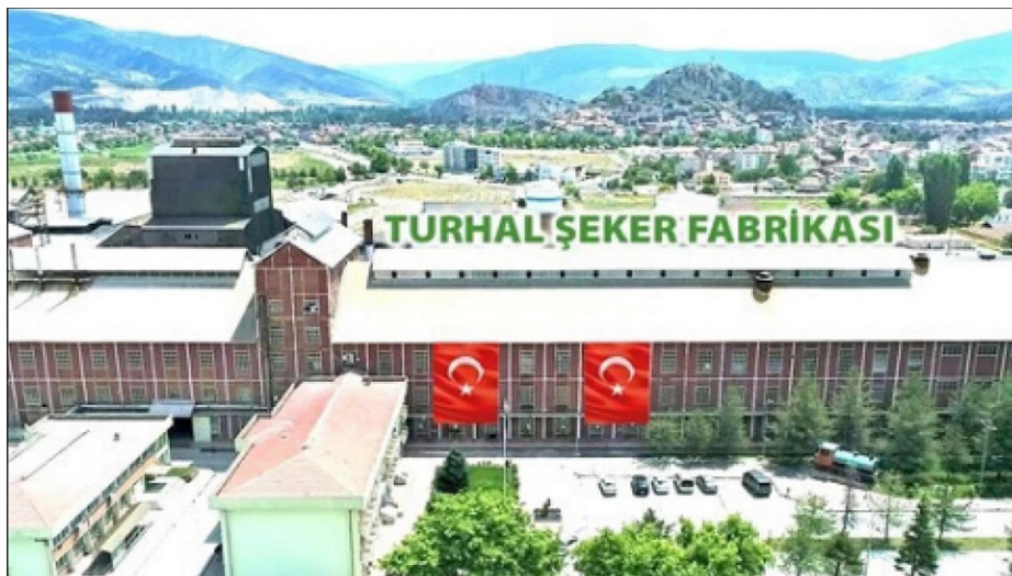
Görsel 6. Turhal Şeker Fabrikası.

Tokat ilinde yer alan bazı şehirlerin logoları ise oldukça sade ve az sembolü barındırır. Bunların başında kuşkusuz sadece şeker pancarı ile temsil edilen Yeşilyurt Belediyesi gelir. İlçe sınırlarında yer alan höyükler ve 1932 yılında Samsun-Sivas tren yolunun faaliyete geçmesiyle kurulan istasyon, şehrin kuruluş ve gelişiminde etkili olmuştur. Ayrıca Çekerek Nehri ve buğday, arpa gibi tarım ürünlerine atıfta bulunulabilir. Bunun dışında Pazar şehrini temsil eden logonun Pazar Belediyesi isminin baş harflerinden oluşması şehre ait sembollerin anlaşılmasını zorlaştırmıştır. Belediye yetkilileri "p" harfinin turuncu olmasının sebebi Ballica Mağarası sarkıtlarına tutulan ışıktan ve ortaya çıkan renkten mütevellit olduğunu, yeşilin ise bölgedeki yeşilliği temsil ettiğini aktarmışlardır. Ancak bu ayrıntılar, şehri tanımayanlar için bir anlam ifade etmeyebilir. Hatta şehirde yaşayanların bile tahmin etmesi kolay bir hadise değildir. Bunun yerine Ballica Mağarası ve Mahperi Hatun Kervansarayına doğrudan bir sembolle atıf yapılması şehrin kimliğinin daha iyi anlaşılmasını sağlayacaktır. Turhal şehrinin logosu