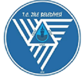
Şekil 12. Zile İlçe Belediyenin Eski ve Yeni Logosu.

önemli ovalarından biri olan ve şehrin konuşlandığı Niksar Ovası'na dair bir atıf yapılması şehrin coğrafi zenginliğinin daha iyi anlaşılmasını sağlar. Tarihi süreçte farklı medeniyetler tarafından ele geçirilmeye çalışılan Zile şehrinde logo hususunda yöneticiler mutabık kalamamıştır. Şehirdeki fiziki ve beşerî unsurların zenginliği bu sorunu ortaya çıkaran sebeplerden biridir. Yeni logoda Zile Kalesi, Veni-Vidi-Vici sloganı ve "V" harfine atıf yapan üçgenler yer alır. Belediye yetkilileri logoya ilgili bir komisyon kurulup yarışma düzenlendiğini aktarmıştır. Ancak çalışmalar doğrultusunda sunulan logo belediye meclisi tarafından kabul görmemiştir. Şehirde yer alan Zile Kalesi, tarihi evler, kaya mezar, amfiteyatrosu, Narince Üzümü, Zile pekmezi, kiraz, Hotan Çayı, mağaralar ve bunun gibi unsurlar logo seçimini zorlaştırmıştır.