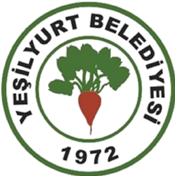
Şekil 11. Yeşilyurt İlçe Belediye Logosu.

Fiziki unsurların beşerî faaliyetleri kolaylaştırdığı ve gelişmesine katkı sunduğu Tokat ilinde tarihiyle ön plana çıkan şehirler bulunur. Bunlardan biri olan Niksar'ın şehir kimliği kale, tuğ, Anadolu'nun anahtarı ve Ayvaz suyu ile temsil edilmiştir. Ayrıca Kelkit'in kollarına mavi çizgiler ile atıf yapılmıştır. Bu şekli ile oldukça manidar ve görsel açıdan uygun olan logoya Karadeniz Bölgesi'nin