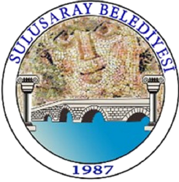
Şekil 8. Sulusaray İlçe Belediye Logosu.

vurgu yapılmıştır. Logonun mavi rengi ilçe sınırlarından geçen geçen Yeşilırmak ve onun kolu olan Hotan Çayını temsil etmektedir (Şekil 12).