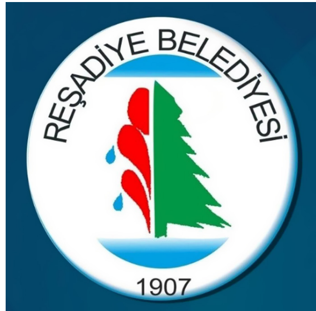
Şekil 7. Reşadiye İlçe Belediye Logosu.