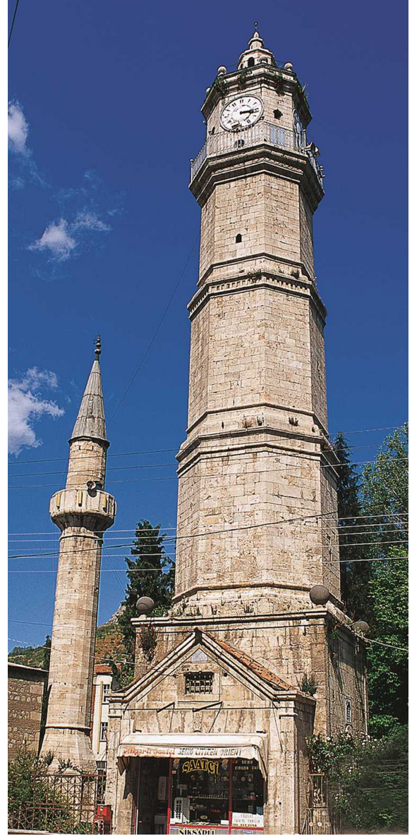
Görsel 5. Tokat Saat Kulesi

Tokat ilinde Canik, Köse, Yaylacık ve Deveci gibi önemli dağ silsileleri yer almakta olup bunları Almus, Artova ve Başçıftlık logolarında görmek mümkündür. Dağların karlı zirveleri yine yüksekliği ve Başçıftlık'te olduğu gibi bunun beşerî faaliyete dönüşmesiyle ortaya çıkan kayak merkezlerini temsil eder. Ayrıca bölgeye hayat veren Yeşilırmak ve kollarına ait semboller Pazar ve Yeşilyurt dışındaki logoların hepsinde temsil edilmiştir. Yine Almus Barajı ve üzerinde yapılan balıkçılık faaliyetleri logoda resmedilen diğer semboldür. Özellikle Niksar'da kaynak sularının bolluğu ve Ayvaz suyunun ayrı bir değere sahip olması şehrin önemli simgelerinden biri haline gelmesine neden olmuştur. Bu bakımdan Harita 1'de görüldüğü gibi bölgede bulunan akarsu ağı bölgenin fiziki unsurlarını ve beşerî faaliyetlerini doğrudan şekillendirmiştir. Ayrıca bölgedeki ovalar, şehirlerin kuruluşunu ve gelişimini hızlandıran diğer jeomorfolojik birimlerdir. Bunlar da logolarda temsil