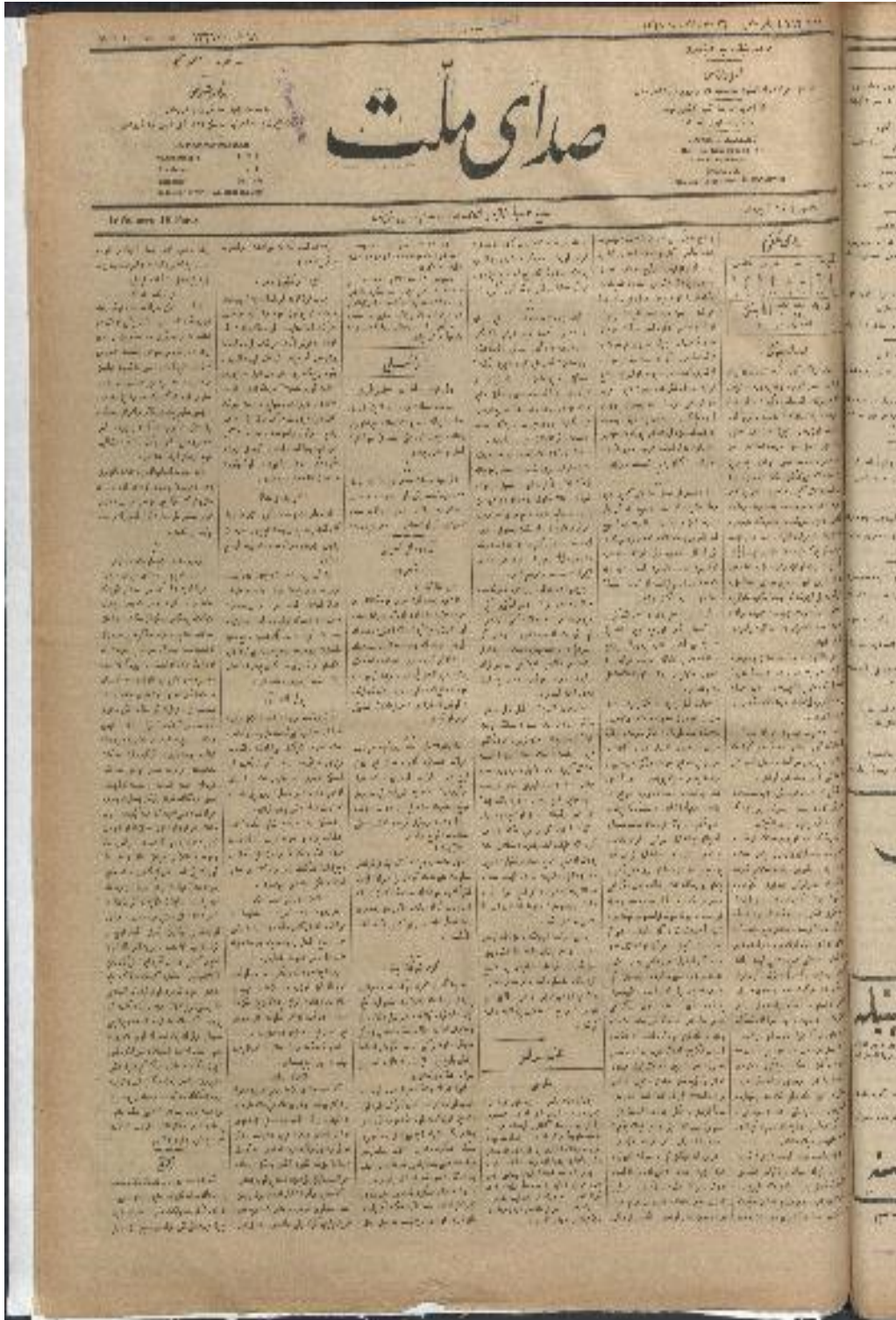
Kozmîdi Efendi'nin çıkarttığı Sada-yı Millet gazetesi