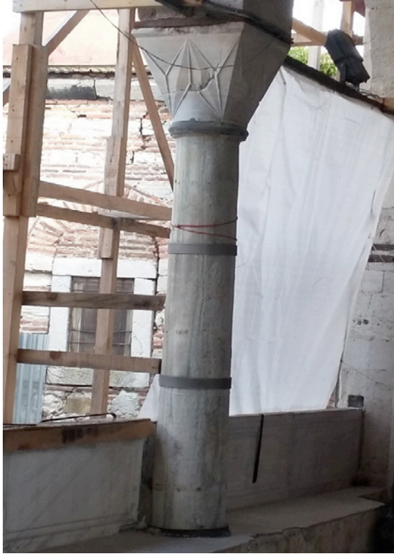
Resim 9. Karystos Mermeri Dış Revak Sütunu