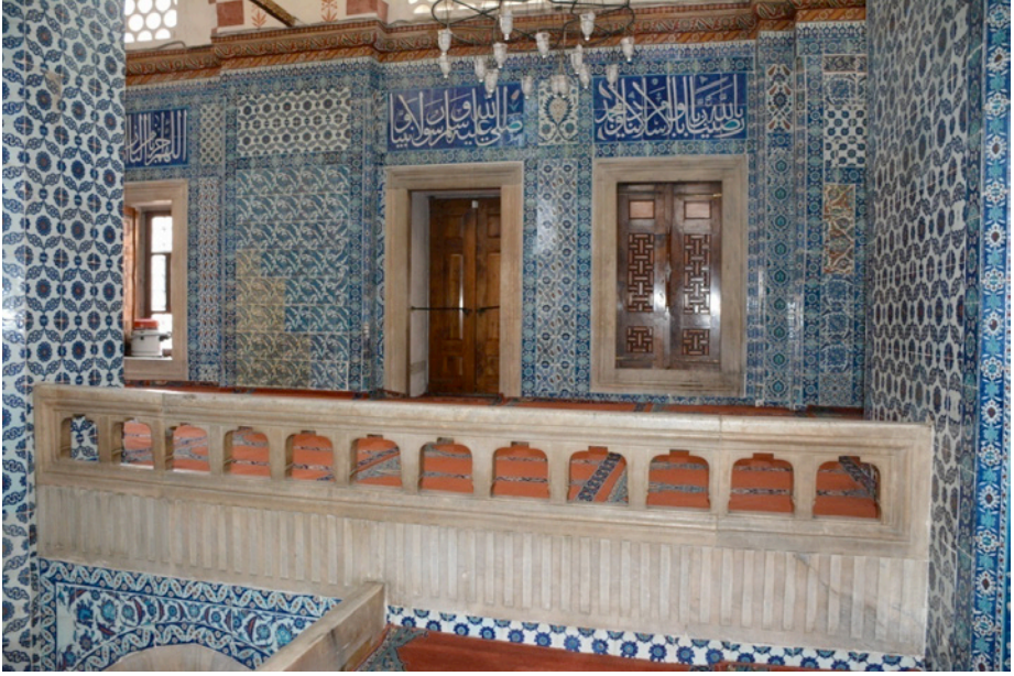
Resim 25. Mahfil Korkuluğu