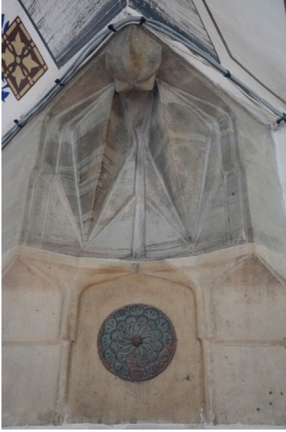
Resim 21. Paye Sslemesi