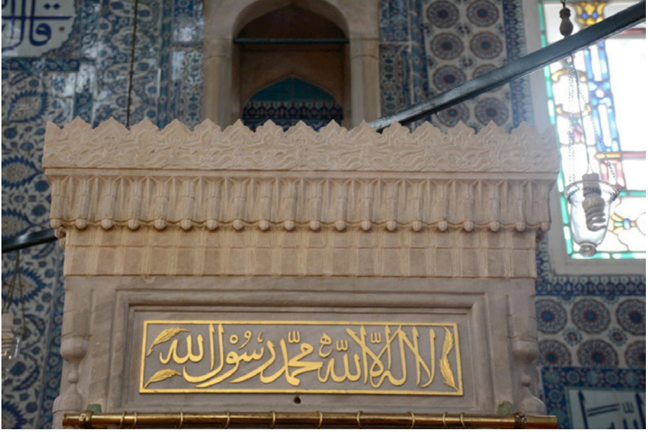
Resim 17. Minber Kapı Tepeliği