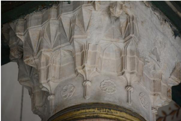
Resim 20. Son Cemaat Yeri Sütun Başlığı