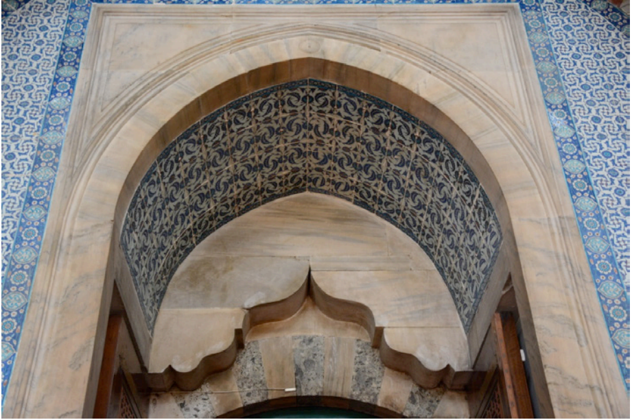
Resim 24. Kapı Kemerini