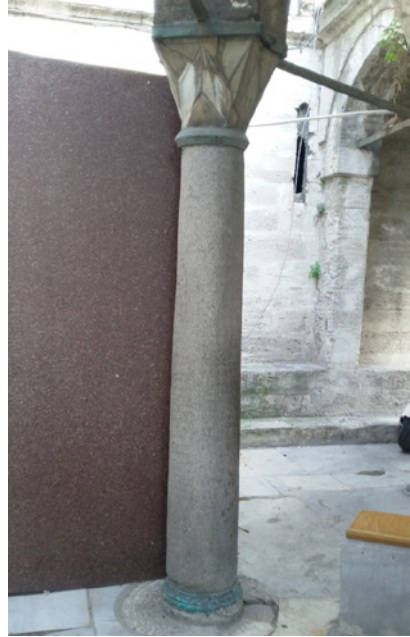
Resim 6. Armutlu Granodiyoriti Şadırvan Sütunu