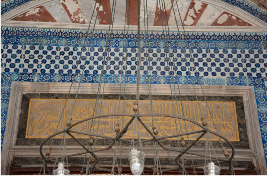
Resim 18. Kapı Kitabesi