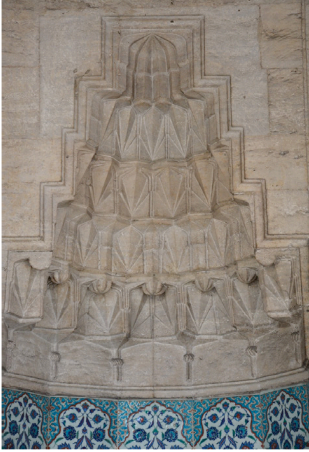
Resim 19. Mihrabiye Nişi