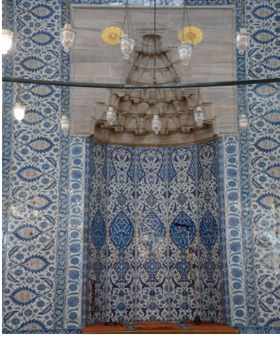
Resim 1. Mihrap Nişi