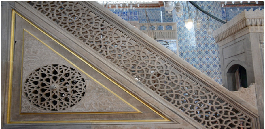
Resim 10. Minber Yan Aynalıđı ve Korkuluđu