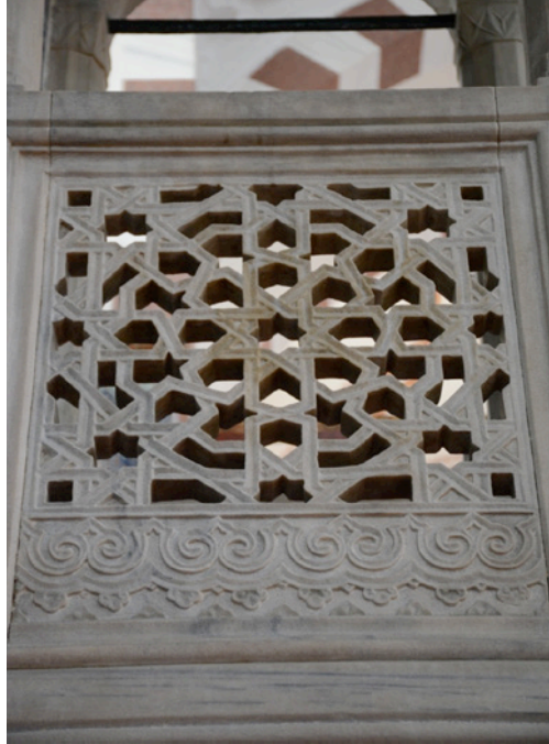
Resim 12. Minber Köşkü Yan Panosu