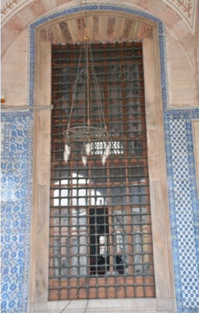
Resim 3. Son Cemaat Yeri Penceresi