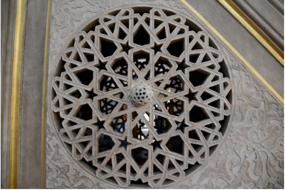
Resim 11. Minber Yan Aynalık Detayı