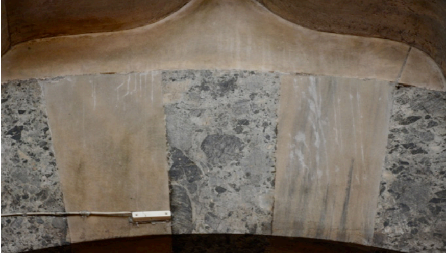
Resim 8. Serpantin Breşı ve Marmara Mermeri Kapı Kemer