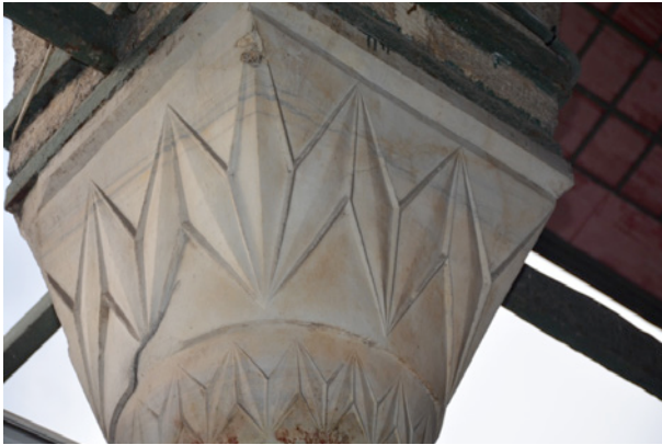
Resim 22. Dış Revak Stunu Bařlıđı