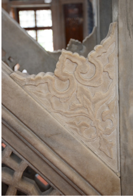
Resim 16. Minber Köşebent