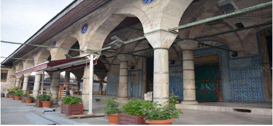
Resim 2. Çifte Revak