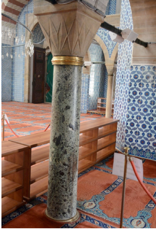
Resim 7. Serpantin Breşı Mahfil Sütunu