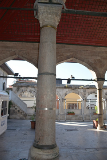
Resim 5. Kestanbol Granodiyoriti Son Cemaat Yeri Sütunu