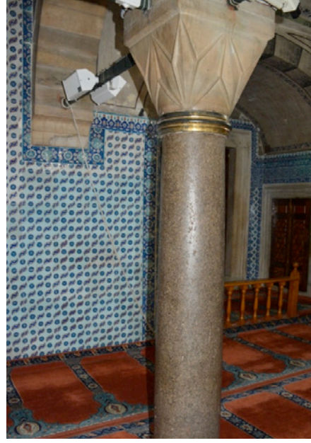
Resim 4. Kestanbol Granodiyoriti Mahfil Sütunu