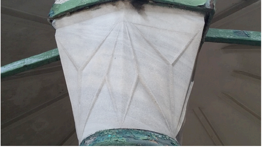
Resim 23. Şadırvan Sütunu Başlığı