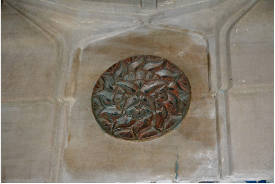
Resim 15. Gülçe