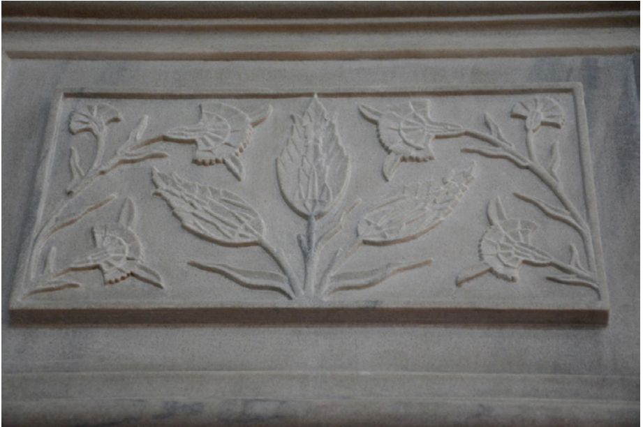
Resim 14. Minber Köşkü Altı Panosu