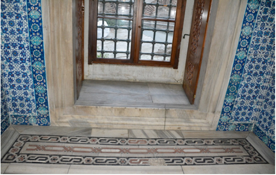
Resim 13. Pencere Önü Döşeme Panosu