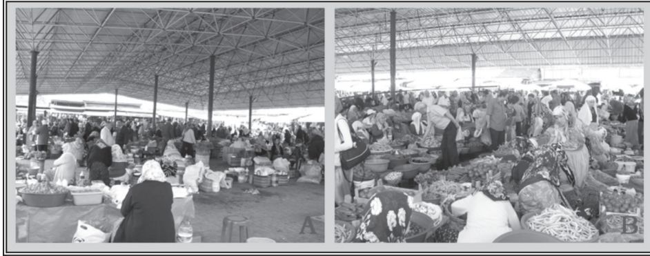
Fotoğraf 1: Bartın Kadınlar Pazarı'nda pazarcı sayısı ve ürün çeşitliliği kış aylarında (A) yaz aylarına (B) göre oldukça düşüktür.

düşmekte ve pazardaki yoğunluk azalmaktadır. Yaz aylarında ise yazlık meyve ve sebze ürünlerinin olgunlaşmaya başlamasıyla pazarcı sayısında ve pazardaki yoğunlukta artış gözlenmektedir (Fotoğraf 1).