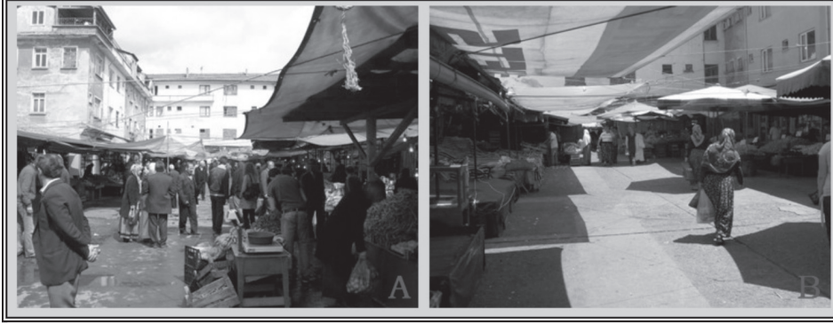
Fotoğraf 2: Hal Blokları Sokağında pazarcı sayısı Kadınlar Pazarı'nın aksine kış aylarında (A) artış gösterirken yaz aylarında (B) ise azaldığı gözlenir.

Kadınlar Pazarı'nda yer alan satıcıların sosyokültürel ve sosyoekonomik özellikleri de incelenebilecek nitelikler arasında yer alır. Bu amaçla Bartın Belediyesi Zabıta Müdürlüğüne kayıtlı 179 kadın pazarcıdan 90 tanesine çeşitli sorulardan oluşan bir anket uygulanmıştır. Buna göre pazarcıların % 72, 2'sinin yetişkin, geri kalan % 27, 8'inin ise yaşlı nüfus içerisinde yer aldığı görülür. Pazarcılar arasında bitirilen en yüksek eğitim öğretim düzeyi ilkokuldur. İlkokul mezunları % 83, 3 gibi yüksek bir orana sahiptir. Daha sonra % 12, 2'yle okuryazar olanlar, % 4, 4'le okuryazar olmayanlar gelmektedir. Bununla birlikte yaşlı nüfus içerisinde okuryazar olmayanların oranı % 19'a yükselmektedir (Tablo 1).