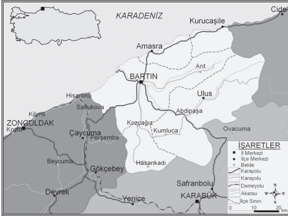
Harita 1. Bartın ili konum haritası.

Tarihi gelişimi açısından ele alındığında Bartın halk pazarının 8 köklü bir geçmişe sahip olduğu görülür. Bartın, 18. yüzyılda gelirinin önemli bir bölümünü pazarcılıktan sağlamaktaydı. Her Cumartesi kurulan pazarın ticari sınırları Safranbolu, Eflani ve Ulus'a kadar uzanan geniş bir sahayı içine alıyor ve adı geçen yerlerden gelenler çamaşır, çıra, keten tohumu, pestil, ceviz, yağ, keten ipliği, astar ve kereste gibi malları alıp satıyorlardı 9 . Daha sonraki yıllarda ilçenin ticaret sahasını genişlettiği ve bilhassa 1800'lerden sonra İstanbul'a kadar uzanarak ihracatını artırdığı görülmüştür. Bilhassa yumurta ve kereste ticareti hayli ilerlemiş, Avrupa'ya dahi ihracat yapılmaya başlanmıştır 10 .