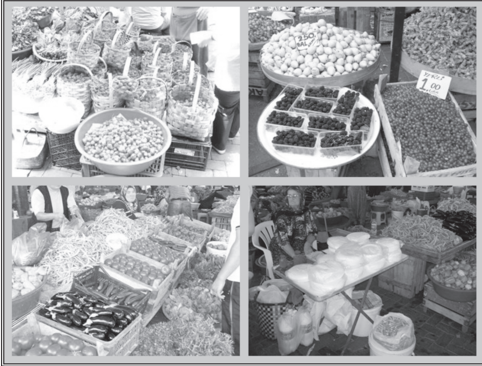
Fotoğraf 3: Bartın Kadınlar Pazar'ında satılan bazı ürünlerden görünümüler.

yonu olmaktadır. Ayrıca memleketlerine yaz tatillerini geçirmek için gelenlerin de bu tür ürünleri (konserve, pekmez, reçel, salça, turşu, komposto ve pestil gibi) yapmak ve günlük ihtiyaçlarını karşılamak amacıyla pazarı tercih etmeleri pazardaki alışveriş yoğunluğunu artırmaktadır (Fotoğraf 3).