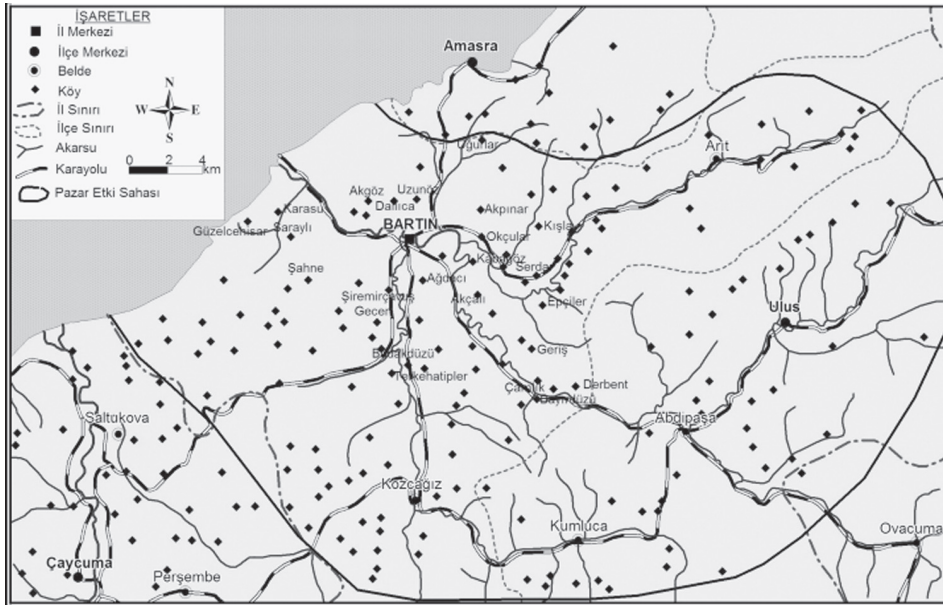
Harita 3: Bartın Kadınlar Pazarı'nın etki sahası.

Bununla birlikte satıcıların ve kırsal halkın küfe ihtiyacını karşılamak için pazarda küfe satışı da yapılmaktadır. Pazarda satılan küfelerin üretimi Uğurlar köyünde yapılmak-