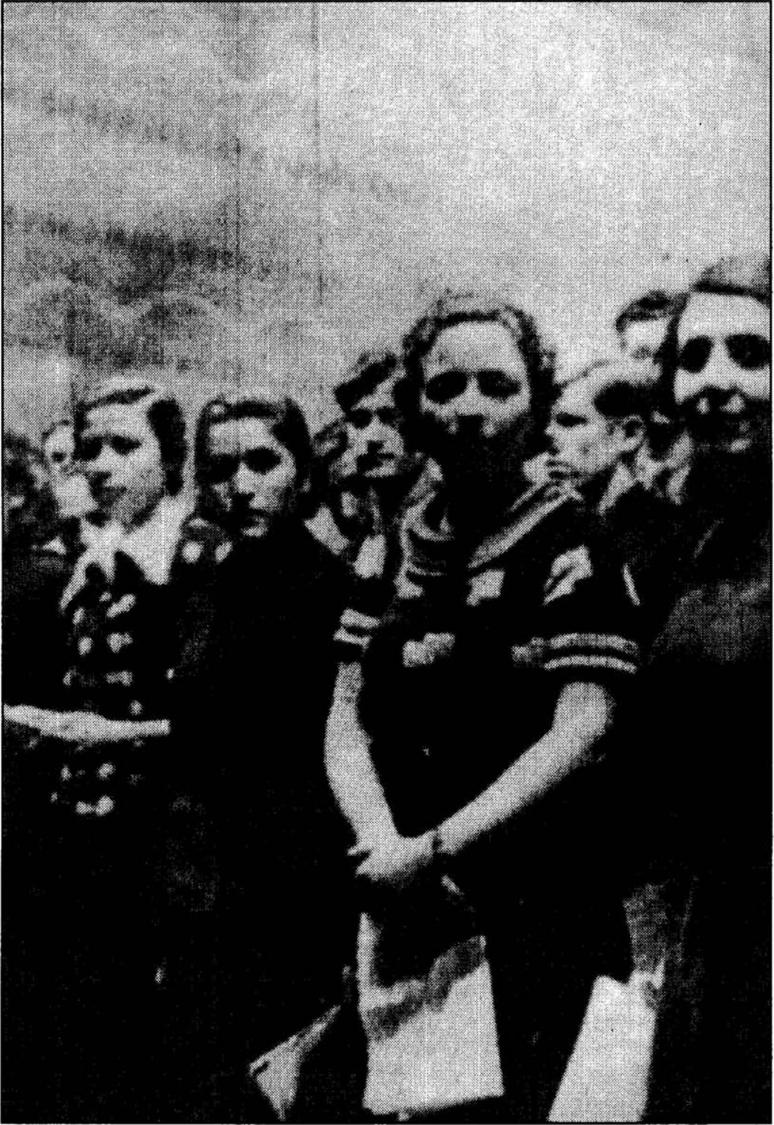
Ankara Halkevi katılımcıları 1936-37.