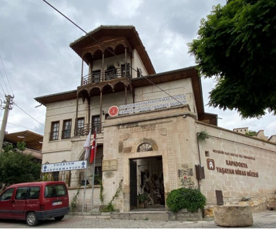
Şekil 16: Kapadokya Yaşayan Miras Müzesi