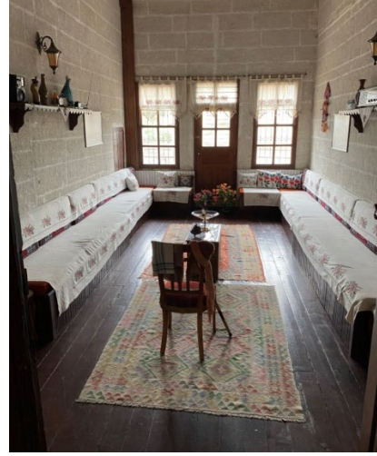
Şekil 17: Kapadokya Yaşayan Miras Müzesi/Geleneksel Halk Toplantıları Odası