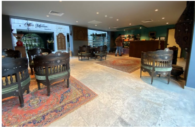
Şekil 26: Kahve Müzesi/Kafeterya Bölümü