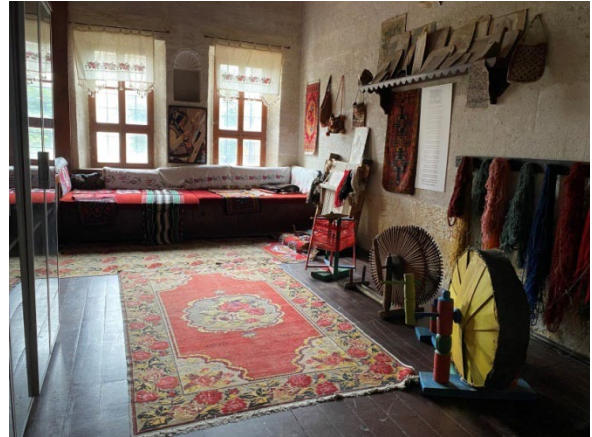
Şekil 21: Kapadokya Yaşayan Miras Müzesi/Dokuma Odası Bölümü