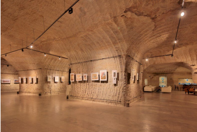
Şekil 14: Güray Müze/Galerî Bölümü