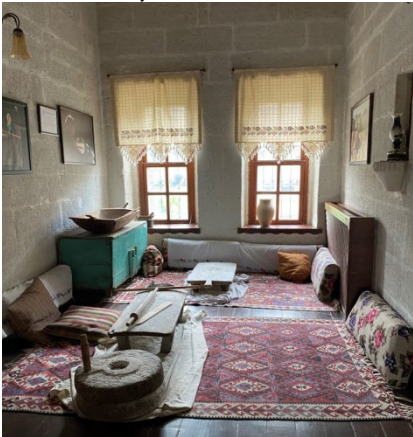
Şekil 20: Kapadokya Yaşayan Miras Müzesi/Tafana Bölümü