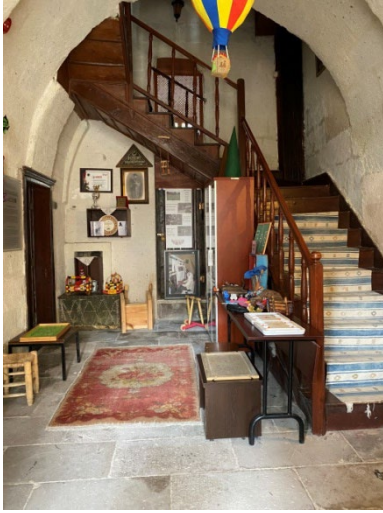
Şekil 18: Kapadokya Yaşayan Miras Müzesi/Çocuk Oyunları Bölümü