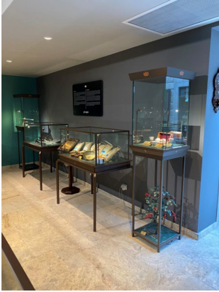
Şekil 24: Kahve Müzesi/Teşhir Salonu