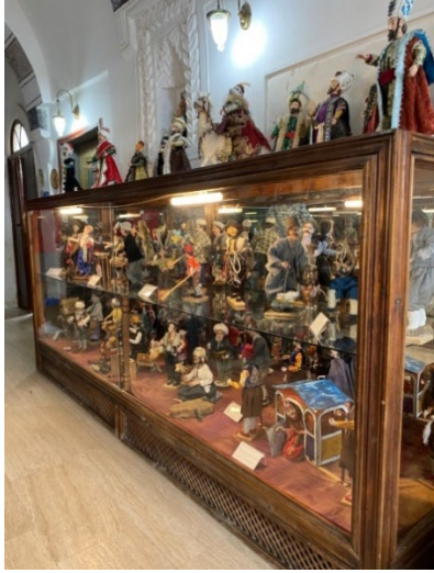
Şekil 4: Kapadokya Sanat ve Tarih Müzesi Kitre Bebek Bölümü/ Ülkemiz Kültürüne Ait Bebekler