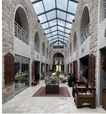
Şekil 23: Kahve Müzesi