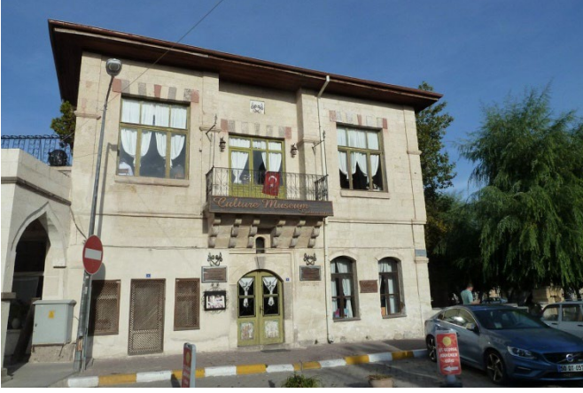
Şekil 6: Kapadokya Kültür Müzesi