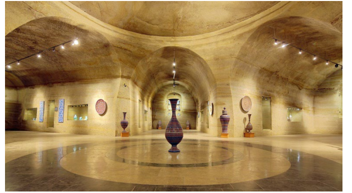
Şekil 13: Güray Müze/Modern Eserler Salonu