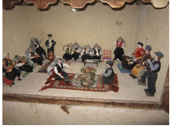
Şekil 5: Kapadokya Sanat ve Tarih Müzesi Kitre Bebek Bölümü/Nahl Geleneği