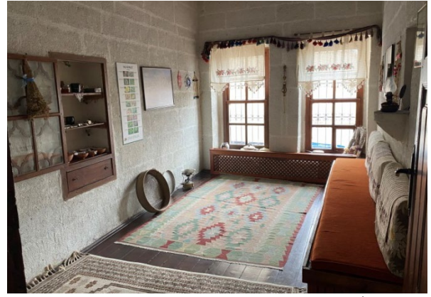
Şekil 19: Kapadokya Yaşayan Miras Müzesi/Halk Hekimliği Odası