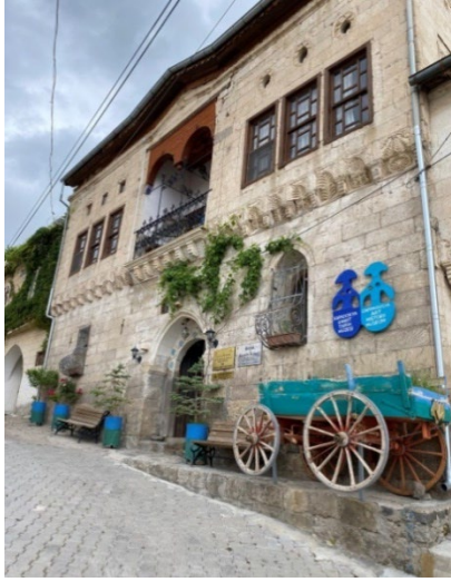
Şekil 1: Kapadokya Sanat ve Tarih Müzesi