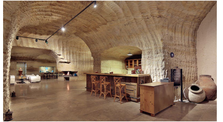
Şekil 15: Güray Müze/Fuaye Bölümü