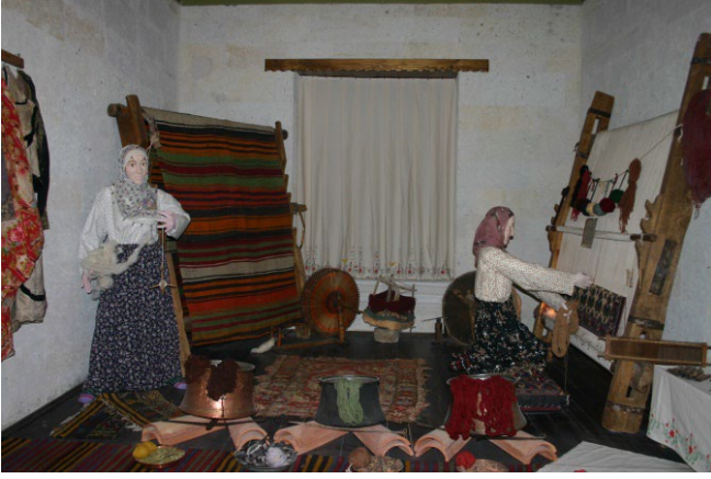
Şekil 8: Kapadokya Kültür Müzesi/Neveşehir Yöresi Dokuma Geleneği