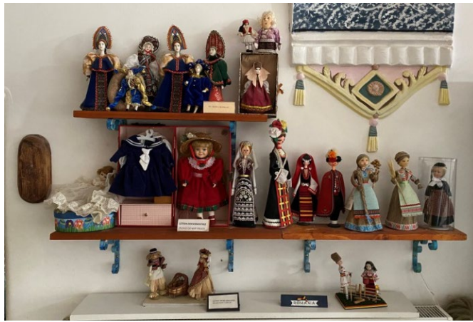
Şekil 5: Kapadokya Sanat ve Tarih Müzesi Kitre Bebek Bölümü/Yabancı Ülke Kültürlerine Ait Bebekler