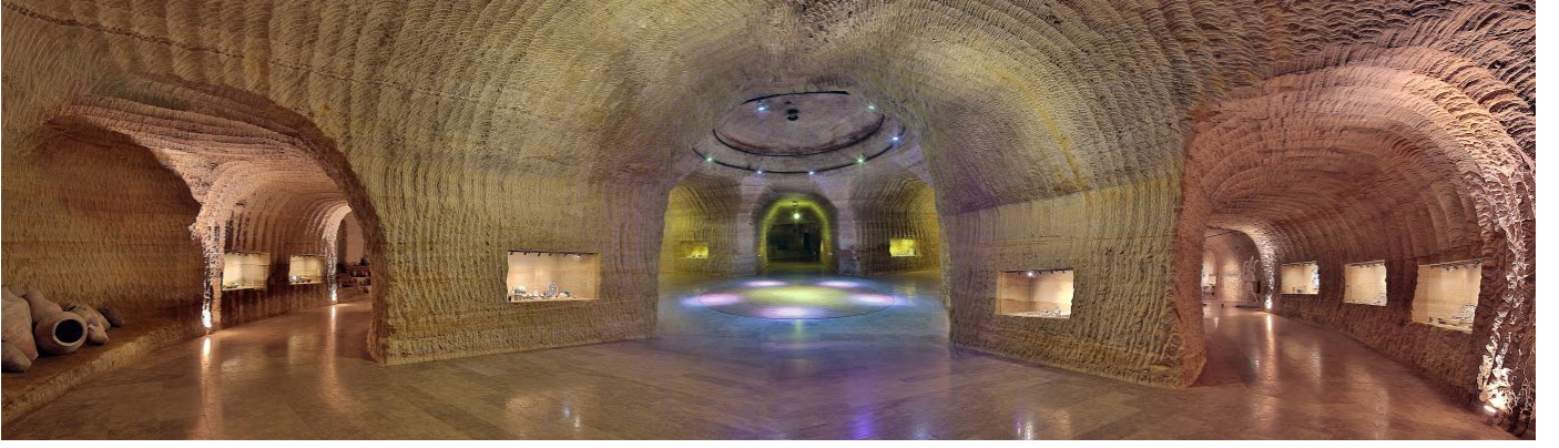
Şekil 11: Güray Müze/Antik Eserler Salonu