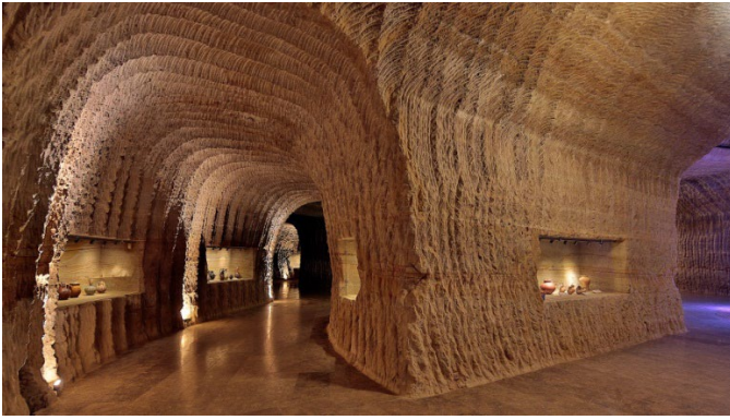
Şekil 12: Güray Müze/Antik Eserler Salonu