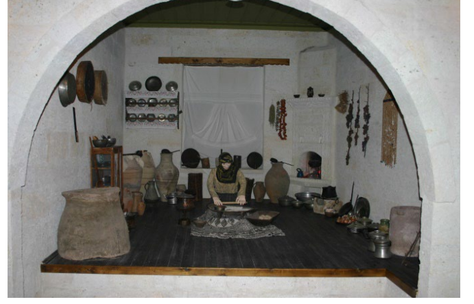
Şekil 7: Kapadokya Kültür Müzesi/Neveşehir Yöresi Ekmek Yapım Geleneği