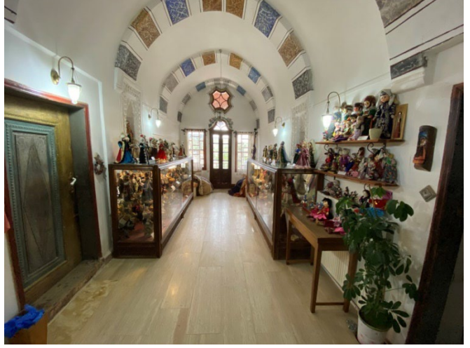
Şekil 2: Kapadokya Sanat ve Tarih Müzesi/Kitre Bebek Bölümü