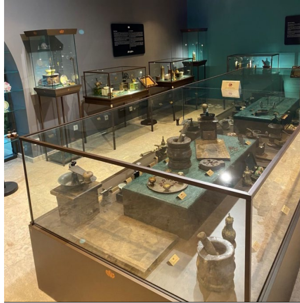
Şekil 25: Kahve Müzesi/Teşhir Salonu