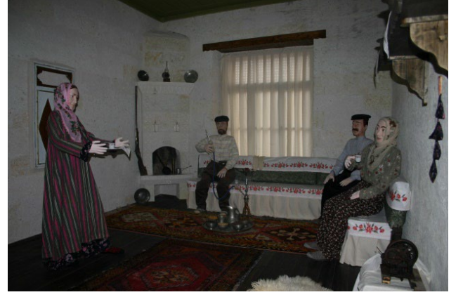
Şekil 9: Kapadokya Kültür Müzesi/Neveşehir Yöresi Kız İsteme Geleneği