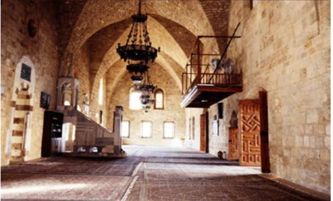
Ek 2. Sayda Hz. Ömer Camii (İç Görünümü)