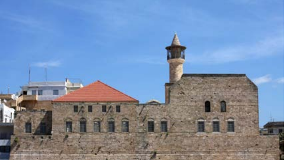
Ek 1. Sayda Hz. Ömer Camii (Dış Görünümü)