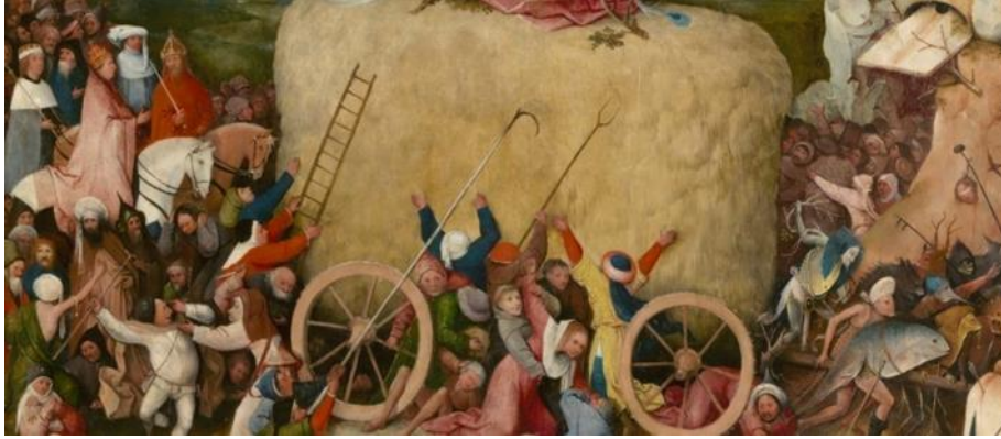
Resim 10. Hieronymus Bosch, Haywain Triptiği Ayrıntı.

Bosch'un bu kışıma zındıklar kadar mübarek insanların da karıştığı yönündeki yaklaşımına işaret eder” (El Hüseyni, 2011: 112).