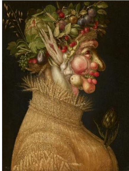
Resim 5. Giuseppe Arcimboldo, Yaz, Tuval Üzerine Yağlıboya, 63,5x76 cm, 1573, Louvre Müzesi, Paris

Archimboldo'nun eserleri incelendiğinde pek çok farklı nesnenin bir araya getirilerek başka bir formu oluşturduğu görülmektedir. İlk bakışta nesnelere tek başına görünürken uzaklaştıkça başka bir biçimin ortaya çıkışıyla karşılaşılır. Ressamın eserlerinde sebze ve meyvelerden oluşan bir portre ortaya çıkar, sebze ve meyveden oluşan bu portrenin ise gerçek dışı bir anlam taşıması; resmi, söz konusu kavramla ilişkilendirir. Sanatçının eserlerinde kullanmış olduğu bu sıra dışı teknik, fantastik unsurların kullanımı bakımından onu diğer resimlerden farklı bir konuma taşımaktadır.