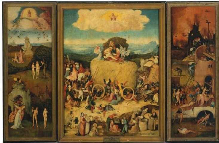
Resim 10. Hieronymus Bosch, Haywain Triptiği, Meşe Panel Üzerine Yağlıboya, 135 cm x 200 cm, 1516, Prado Müzesi, Madrid.

"Triptych, dünyanın sonu zihniyetinin ve ilahi tarihin doğrusal perspektifinin ürünüdür. Trajikomik didaktikliğiyle insanlık çıkmazından alternatif bir çıkış yolu sunar. Tasvir, felaketlerin başlangıcı olarak kabul edilen Âdem ve Havva'nın cennetten kovulmasından, dünyevi varoluşun cezalandırıldığı yeraltı dünyasına doğru sürer. Tehlikeleri ve cezbediciliğiyle insan yaşamının tüm fazlarını sembolik olarak temsil eden eser, insan doğasının merkezine çıkılan nihai bir yolculuk niteliğindedir" (Şentürk, Tablo Okuması: The Haywain Triptych-Bosch, 2023)