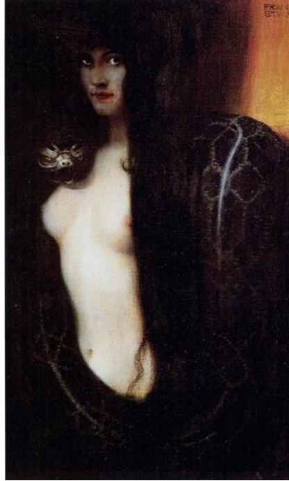
Resim 6. Franz Von Stuck, Günah , Tuval Üzerine Yağlıboya, 1893, 94,5x59,5 cm, Münih.

Eserlerinde fantastik unsurları resim düzlemine taşıyan bir ressam olan Franz Von Stuck, fantastik betimlemeler yansırken resimlerine sembolik anlamlar da yüklemiştir. Ressamın “Günah” isimli eseri (Bknz. Resim 6), içerisinde barındırdığı anlamlar ve özellikle kadın figürünün yılan ile olan duruşu bakımından fantastik unsurların kullanımına örnek sunmaktadır. Dikey bir kompozisyon uygulanan resimde karanlık arka plan, kadının etrafındaki yılanla kaynaşarak figürü ön plana çıkarmaktadır. Arka plan ve yılanın aksine figürün çok daha açık tonlarda resmedilmesi kadın figürünün vurgulanması açısından dikkat çekici olmuştur.