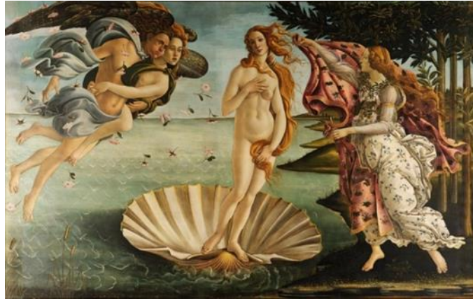
Resim 1. Sandro Botticelli, Venüs'ün Doğuşu, Tuval Üzerine Yağlıboya, 180x280 cm, 1486, Uffizi

Rönesans, Barok, Maniyerizm gibi pek çok dönemde eserlerde kullanılan fantastik öğeler, değişik temalarda uygulanmıştır. Resimlerde uygulanan fantastik unsurlar, kimi zaman yarı insan yarı hayvan olan mitolojik bir varlığı, kimi zaman da dini konular bağlamında İncil'de yer alan anlatıların tasvirini yansıtmıştır. Rönesans dönemi bağlamında bakıldığında; Sandro Botticelli'nin "Venüs'ün Doğuşu" isimli eserinde mitolojik unsurların olduğu görülürken; Leonardo Da Vinci'nin "Meryem'e Müjde" isimli eserinde dini tema çerçevesinde dünya dışı varlığın, melek figürünün yer aldığı görülmektedir. İster mitolojik ister dini temalı olsun, kullanılan resimsel elemanlar, fantastik unsurlar olarak ortaya çıkmaktadır. Anlam olarak hayali ve hakiki olamayan fantastik kavramı, barındırmış olduğu anlam neticesiyle dünya dışı varlıkların eserlerde kullanımı şeklinde varlık göstermiştir.