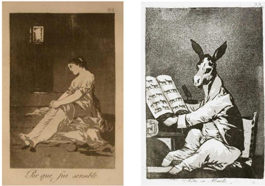
Resim 4. Los Caprichos, no: 32 Por que fue sensible (Çünkü Duygusaldı), Leke baskı.