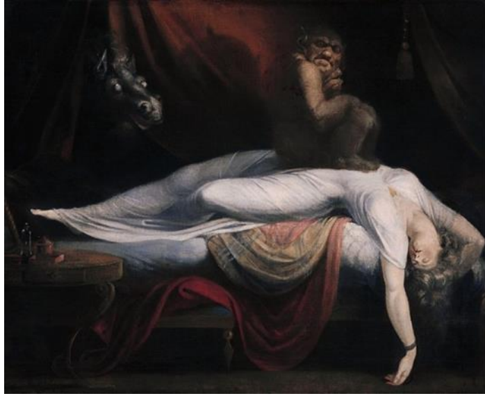
Resim 7. Johann Heinrich Füssli, Kâbus , Tuval Üzerine Yağlıboya, 101x127 cm, 1781, Detroit Sanat Enstitüsü

Johann Heinrich Füssli, resimlerinde genellikle canavarları, hayvanları kullanarak onları bir kâbusun ortasındaki en belirgin unsurlardan bir olarak göstermiş, fantastik öğelerin uygulanışı bakımından oldukça etkili olan örnekler yapmıştır. Ressamın “Kâbus” isimli çalışması (Bknz. Resim 7), fantastik dünya betimlemesine oldukça önemli bir örnek sunmaktadır. Eser incelendiğinde; karanlık bir arka planda figürleri ön plana çıkarmak için onları vurgulayan ışığın etkisi, göze çarpan özelliklerden olmuştur. Resimde yatakta uyuyan figürün üzerinde oturan bir canavar görülürken hemen arka planda da başka bir varlığın onları seyrettiği görülmektedir. Beyaz elbisesi ile vurgulanan figürün uyku halinde oluşu, gördüğü kâbusu aktarmada önemli bir detay niteliği taşımaktadır. Ressam, kâbusu daha iyi betimleyebilmek adına dünya dışı varlıklar kullanarak onun korkutucu anlamını pekiştirmiştir. “Kadın, Fuseli'nin kaybettiği sevgilisi Anna Landolt'u temsil eder” (Cumming, 2008: 248).