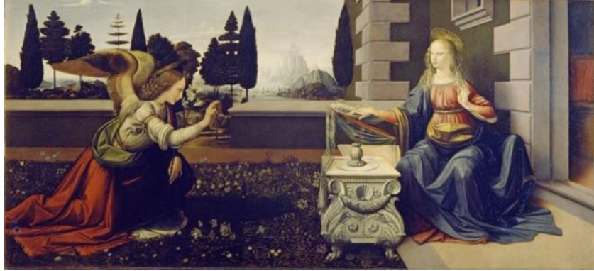
Resim 2. Leonardo Da Vinci, Meryem'e Müjde, Ahşap Panel Üzerine Yağ ve Tempera, 98 cm x 217 cm, Uffizi, Floransa.

Benzer bir başka resimde Leonardo Da Vinci'nin temasını dinden alan "Meryem'e Müjde" isimli eseridir. Ressam eserinde dünya dışı bir varlığı figürün karşısına getirerek fantastik bir anlatım yakalamıştır.