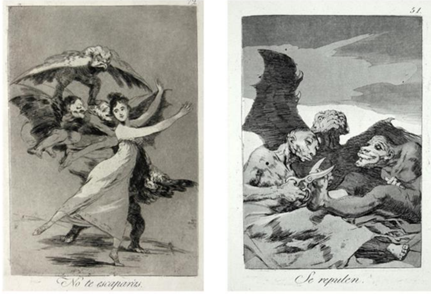
Resim 3. Los Caprichos, no: 72 No te escaparás (Kaçamayacaksın), Aside yedirme baskı, perdahlanmış leke baskı. Los Caprichos, no: 51 Se repulen (Kendilerine çekidüzen veriyorlar), Aside yedirme baskı, perdahlanmış leke baskı ve çelik kalem.