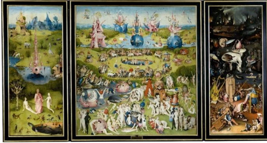
Resim 11. Hieronymus Bosch, Dünyevi Zevkler Bahçesi , 220 cm × 389 cm, Ahşap Üzerine Yağlıboya, 1503, Prado Müzesi, Madrid.

“Hieronymus Bosch’un ince ayrıntılı resimleri titizlikle ele alınmış; günah, ölüm ve çürümüşlükle ilgili karmaşık, çoğunlukla da gizli imgelerle doldurulmuştur. Kaotik görünseler de geçekte titizlikle çalışılmışlardır” (Hollingsworth, 2009: 275).