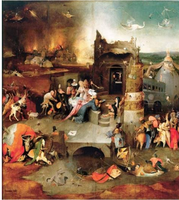
Resim 9. Hieronymus Bosch, Aziz Antonios'un Çektikleri, 1505, 172x131 cm, Lizbon.

Sanatçının “Aziz Antonios’un Çektikleri” isimli eseri fantastik unsurların kullanımına örnek teşkil etmektedir (Bknz. Resim 9). Resim incelendiğinde dikey kompozisyon düzlemine yerleştirilen resimsel unsurların çoğunun fantastik, dünya dışı varlıklar olduğu görülmektedir. Pek çok figürün yer aldığı sahneye karmaşık bir yapı egemen iken arka planda yer alan diğer yapıdan yükselen alevlerin olduğu bölümle resim iki parçaya bölünmüş hissiyatı vermektedir. Bu durum resimde derinlik etkisini arttırırken hareket olgusuna da yön vermektedir.