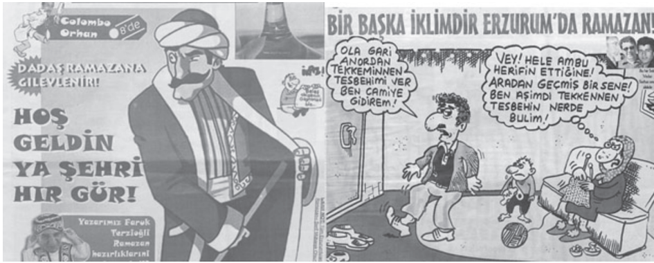
Karikatür/Fotomontaj 9: Farklı sayılarda Erzurum insanının Ramazan ayına yaklaşım biçiminin hicvedildiği bir karikatürler (8 Ekim 2003)

Dini konular, toplumsal inanç ve geleneklerle ilgili içeriklerde Fırfirik çoğunlukla toplumun mutaassıp tarafını kıyasıya hicvetmiştir. Özellikle Ramazan aylarındaki kavga olaylarının artmasını her Ramazan dönemi gündeme alarak, Ramazan klasiği haline gelen bu tür olayları tenkit etmiştir. Diğer yandan müslümanlığı ve ibadetleri sadece bir aya sığdırmaya yönelik yaklaşımı da mizah yoluyla eleştirmiştir.