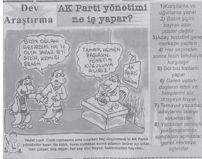
Karikatür/Fotomontaj 20: 7 Nisan 2004 tarihli sayıda çıkan Ak Parti Yönetimi Ne İş Yapar adlı karikatür

Bu ifade ve kaygılardan da anlaşıldığı üzere genel olarak yerel basında özel olarak da Fırfirik Dergisi 'nde giderek uysallaşan dilin nedeni iktidar baskısı ve ekonomik ambargodur.