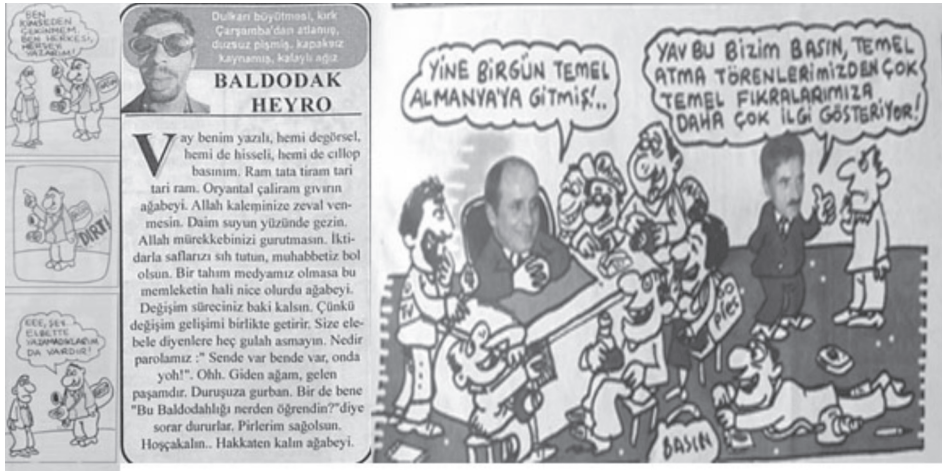
Karikatür/Fotomontaj 19: Farklı sayılardan gazeteci-yerel yönetici ilişkisini ele alan örnekler

Medya ve gazetecilikle ilgili eleştiriler %16 düz yazı, %19 karikatür/fotomontajla gazetecilik etiği ve %16 düz yazı, %10 karikatür/fotomontajla gazeteci-kaynak ilişkileri konularında yoğunlaşmıştır. Özellikle cesur gazetecilik yaptıklarını iddia eden gazetecileri eleştirerek, karikatürlerde kendi ağızlarından cesur olmadıkları itiraf ettirilmiştir. 'Nevriye Eze' tiplmesi kendisine mahallede dedikoducu ve iftiracı kimliğiyle tanıdığını, bundan rahatsız olduğunu ifade eden ve nasıl kurtulacağını soran genç bir kıza, bu dedikodu yapma ve iftira atma potansiyelini boşa harcamamasını ve hemen bir gazeteye müracaat ederse hiçbir gazetenin onu kaçırmayacağını söyleyerek, gazetecilik ve gazetecilerdeki ahlaki yapıya yönelik eleştirilerde bulunmuştur. Öte yandan Baldodak Heyro 7 Nisan 2004'deki köşesinden yerel basına 'giden ağız gelen paşam'cı tavrından dolayı methiyeler düzerek, yalakalığı onlardan öğrendiğini söylemektedir.