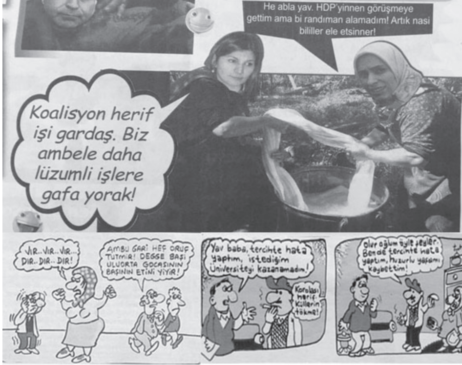
Karikatür/Fotomontaj 10: Fırfirik'te kadın temsiline dair örnekler