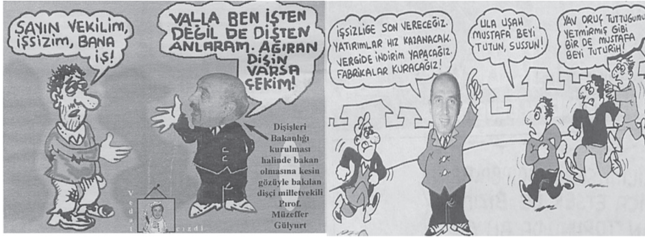
Karikatür/Fotomontaj 12: Farklı sayılardan işsizliğin işleniş biçimine örnekler.