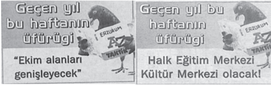
Karikatür/Fotomontaj 1: Geçen Yıl Bu Haftanın üfürüğü köşesinden iki örnek

Son olarak dergide bir de ‘Geçen Yıl Bu Haftanın Üfürüğü’ adlı, siyasi ve yöneticilerin vaatlerini takip ederek, yerine getirilmeyen vaatlerin hatırlatıldığı bir bölüm vardır. Yerine getirilmeyen söz, hem sözü hem de söz vereni küçümsemek anlamında, üfürük olarak tanımlanır. Bu köşede de Fırfirik toplumun hafızası işlevi görerek siyasetçilere ve yöneticilere verdikleri sözleri hatırlatmaktadır.