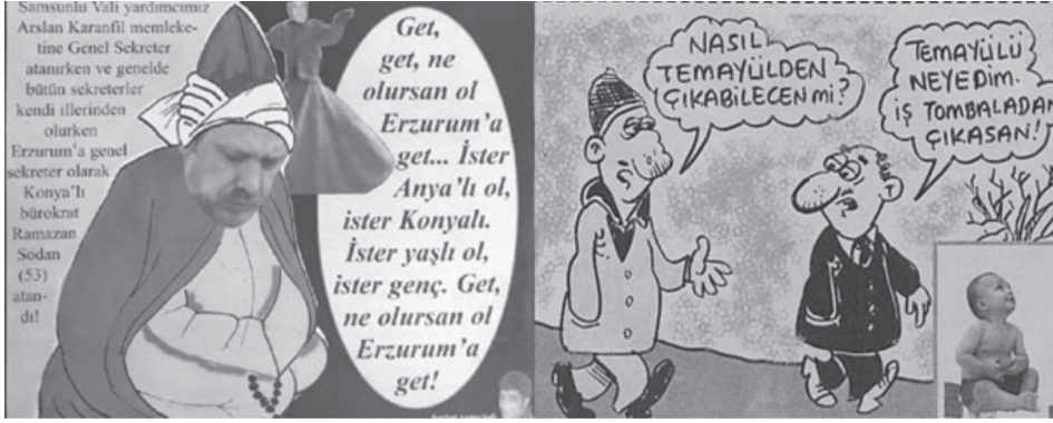
Karikatür/Fotomontaj 5: Farklı sayılardan şehre atanan yöneticilerin Erzurumlu olmamasının ve aday belirleme sürecinin eleştirildiği karikatürler

Diğer yandan hizmet eksiklikleri noktasında, belediyeler musluk suyunun kirliliği, yolların bozuk oluşu, çöplerin yeterince toplanmaması noktasında eleştirilmiştir. Ulaşım problemleri ise daha çok otobüs ve minibüs şoförlerinin halka yönelik kaba tutumu ve trafik kurallarını hiçe saymaları bağlamında irdelenmiştir.