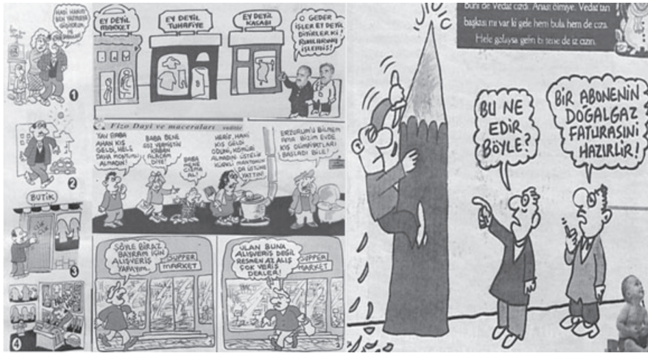
Karikatür/Fotomontaj 11: Fırırık'ın farklı sayılarından hayat pahalılığı/yaşam güçlüğüne dair örnekler.

İşsizlik ile ilgili konular ise %22 düz yazı, %18 karikatür/fotomontaj oranında ele alınmıştır. Fırırık işsizliği hem halkın kronik bir problemi olarak, hem de siyasilerin çözmeye muktedir olmadıkları bir konu olarak sunmaktadır.