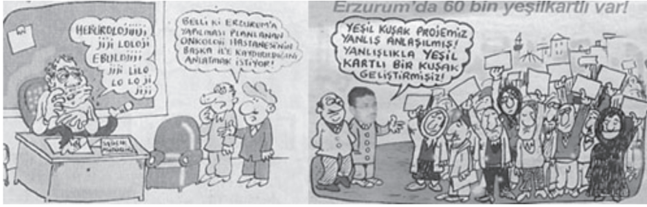
Karikatür/Fotomontaj 13: Farklı sayılardan sağlık konusuna ilişkin örnekler.