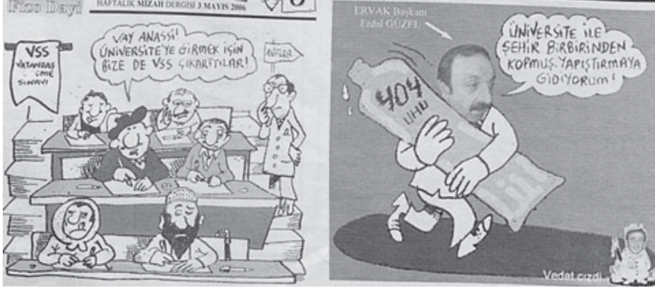
Karikatür/Fotomontaj 14: Farklı sayılardan üniversitenin halktan, şehirden kopuk olduğuna ilişkin karikatürler

Öğrenci ise Fırfirik için esnafın velinimetidir. Birçok yazılı ve görsel metinde öğrencilerin Erzurum halkı ve esnafı için bir velinimet olduğuna ilişkin vurgu yapılmıştır. Üniversite yönetiminden de özellikle öğrencilerin şehirle bağlarını güçlendirecek uygulamalar beklenmektedir.