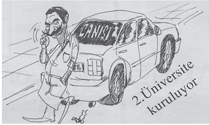
Karikatür/Fotomontaj 16: Fırfirik'te çizilen üniversite kızlarını tuzağa düşürmeye çalışan maganda tiplemesi

Öte yandan dergide Erzurum'da ikinci üniversite (Erzurum Teknik Üniversitesi) kurulma haberi, şehrin ekonomisine yapacağı katkılar dışında, şehir magandalarının musallat olacağı yeni kız öğrenciler geleceği için sinsiz bir gülümseme ile bıyıklı buran erkek ile karikatürize edilmiştir (Karikatür/Fotomontaj 16). Dergideki bu ve buna benzer temsiller üniversitedeki kız öğrencilerin yaşadıkları problemlerden ve iyi niyetlerinden yaralanarak onları tuzağa çeken, körpe bir yaşamın trajediye çeviren toplumsal bir yaraya işaret etmesi bakımından önemlidir.