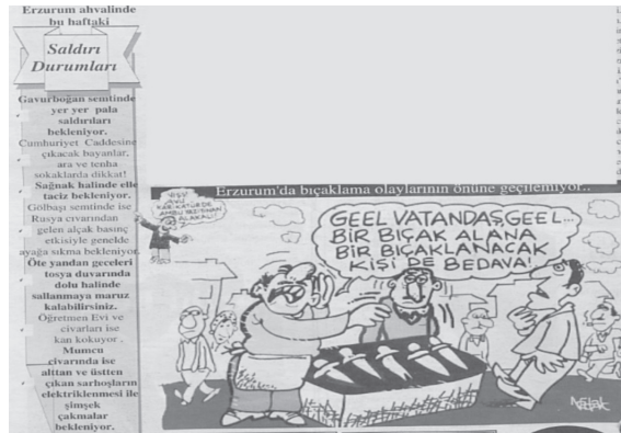
Karikatür/Fotomontaj 8: Şehirdeki bıçaklama olaylarının ele alındığı karikatür ve yazı (8 Ekim 2003)

Suç ve asayiş olayları kapsamında şehirde bir ara oldukça sık yaşanan kavga ve bıçaklama olayları ele alınmış, bu çerçeve de hem halkın sorunlarına çözüm yolu olarak şiddeti tercih etmesi, hem de başta Emniyet Müdürü ve Vali olmak üzere yöneticilerin asayiş sağlama konusundaki ilgisizliği eleştirilmiştir.