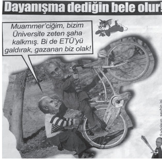
Karikatür/Fotomontaj 17: Erzurum Teknik Üniversite'nin tek başına gelişme gösteremediğine ilişkin yapılan bir fotomontaj.