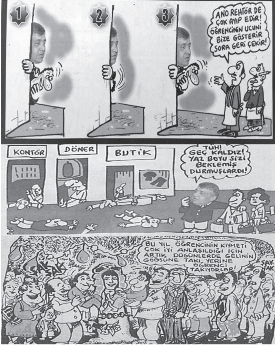
Karikatür/Fotomontaj 15: Erzurum esnafının üniversite öğrencisine bağımlılığını anlatan bir karikatür.