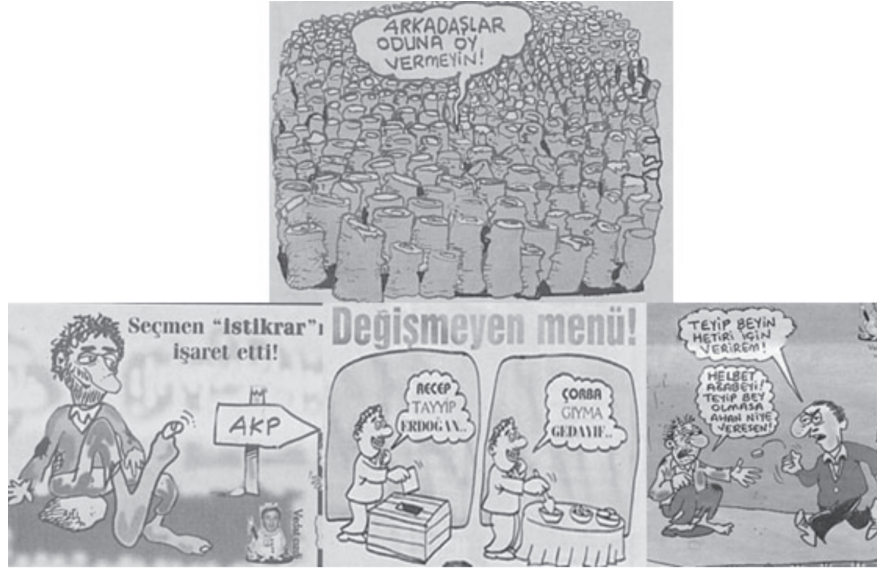
Karikatür/Fotomontaj 6: Fırfirik'te halk temsiline ilişkin örnekler