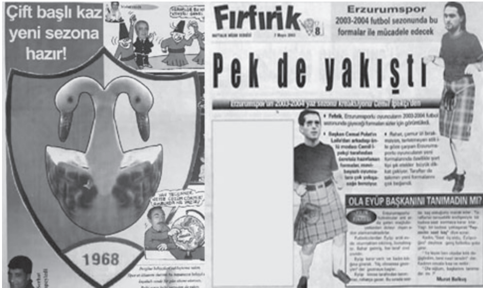
Karikatür/Fotomontaj 7: Erzurumspor'un eleştirildiği yazı ve fotomontajlardan oluşan örnekler.

Bu veriler ışığında Fırfirik için sporun büyük ölçüde futboldan ibaret olduğu söylenebilir. Öyle ki futbol haberlerinin diğer spor dallarına göre ezici oranda fazlalığı ve bu içeriklerde kullanılan dil spor medyasında hegemonik erkekliğin Fırfirik 'te yeniden kurulduğunu göstermektedir. Erzurum sporla ilgili yazı ve karikatürler takımın, futbolcuların ve yöneticilerin başarısızlıkları bağlamında çerçevelenmiştir. Takımdaki oyuncular performanslarını tam anlamıyla ortaya koymadıkları, taraftarlar tribünü doldurmadıkları, iş adamları ve yöneticiler kulübe maddi destek vermedikleri, kulüp başkanları ise yanlış taktiklerinden dolayı Fırfirik 'in hedefi haline gelmiştir. Takımın sürekli başkan değiştirmesi ve her başkan döneminde kötüye gidişi de dergide sık sık gündeme gelmiş ve sert bir mizahi üslupla eleştirilmiştir.