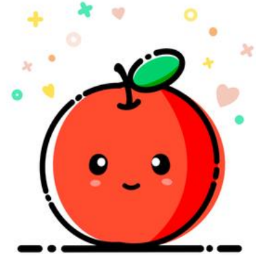
Resim 6. Anna Sun MBE stil illüstrasyon çalışması

Kaynak: https://www.behance.net/gallery/57401161/MBE-Style-Illustration