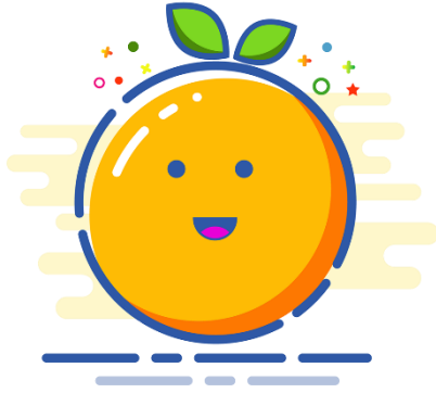
Resim 5. Aan Ragil Julianko MBE stil illüstrasyon çalışması