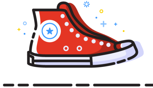
Resim 7. Sylvain Drolet MBE stil illüstrasyon çalışması