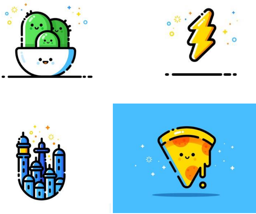
Resim 3. Elvis Ferreri'ye illüstrasyon çizimlerinden örnekler