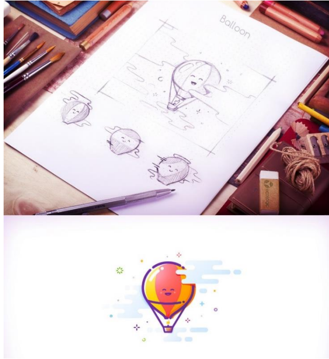
Resim 8. Andrey Prokopenko MBE stil illüstrasyon çalışması

Kaynak: https://www.behance.net/gallery/38487037/MBE-Style-Illustration-process?tracking_source=search_projects