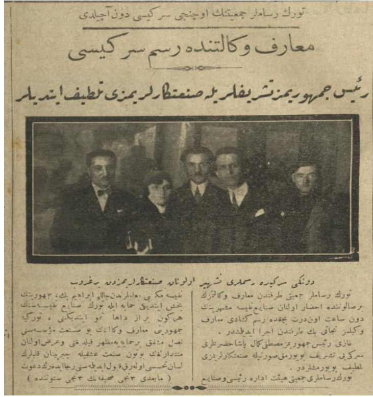
Maarif Vekaletinde düzenlenen resim sergisinde eserleri teşhir edilen resamlardan bir grup