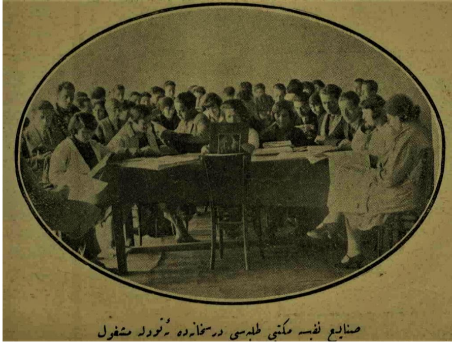
Sanâyi-i Neffise Mektebi talebesi dershanede etütle meşgul