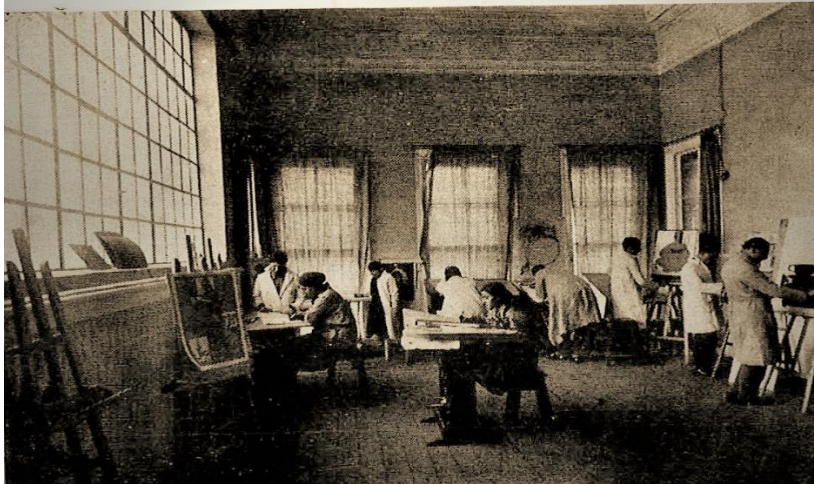
Güzel Sanatlar Akademisi Resim ve Tezyini Sanatlar Atölyeleri