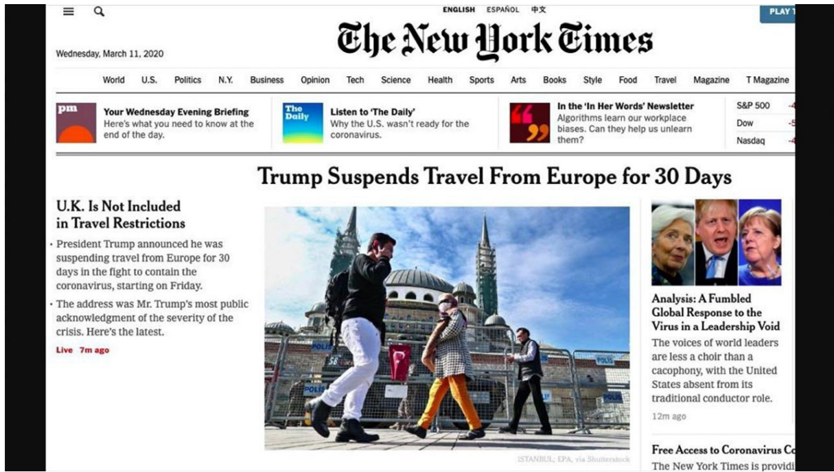
Şekil 1: The New York Times'ın 11 Mart 2020 Tarihli Web Sitesinin Ana Sayfası

Türkiye'de daha ilk vakaların ortaya çıkmaya başladığı bu dönemde CNN International , BBC ve Associated Press gibi diğer uluslararası medya kuruluşları da COVID-19 ile ilgili gelişmeleri aktardıkları haberlerini ve bu haberleri servis ettikleri sosyal medya hesaplarını, içeriğinde Türkiye hakkında bir bilgi olmamasına rağmen Türkiye'de dezenfekte edilen bir caminin fotoğraflarıyla birlikte yayınladılar. BBC , ABD'ye seyahat yasaklarını ve İtalya'da alışveriş merkezlerinin kapanmasına yer verdiği haberinde, CNN International ise İtalya, Çin ve İran'daki COVID-19 vaka sayılarını verdiği haberinde aynı cami görselini kullanmıştır. Hiç kuşkusuz bu haberlerde yer bulan Türk bayrağı ve cami görselleri, Batı'nın konvansiyonel ve dijital iletişim ağında tesadüf eseri kullanılmamaktadır. Kitle iletişim araçları vasıtasıyla "Terörle Savaş" gibi kavramlar üzerinden inşa edilen İslamofobi böylece COVID-19 haberlerinde de kendine örtük bir şekilde yer bulmuştur.