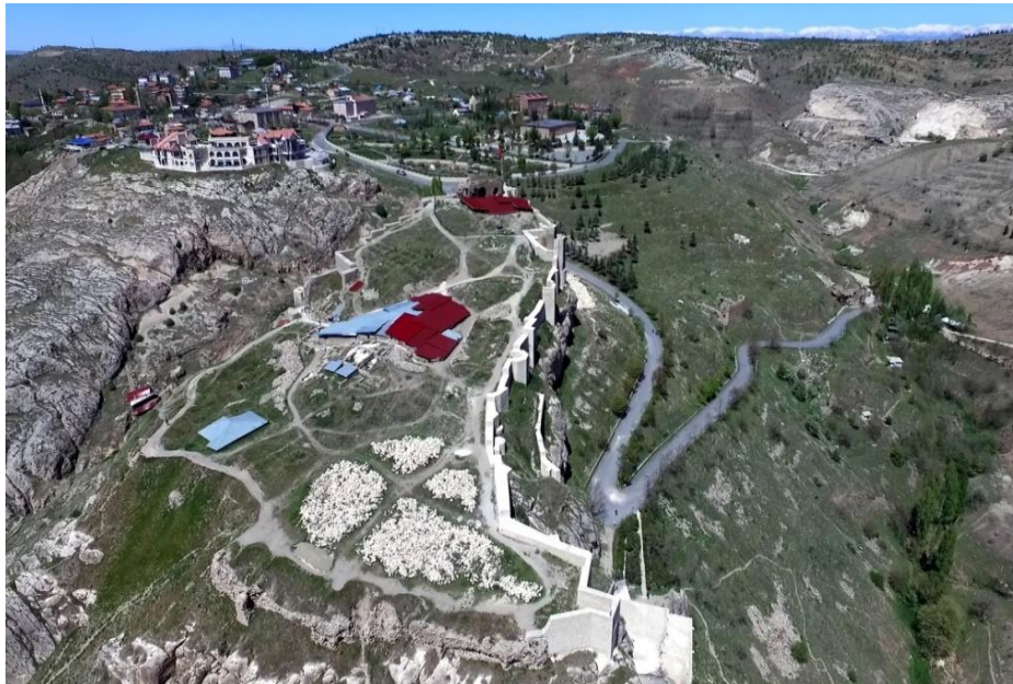
Resim 1. Harput Kalesi kuş bakışı görünüm (Figure 1. Harput Castle from upon)

Harput, Doğu Anadolu Bölgesi'nin Yukarı Fırat Bölümü içinde yer alan bugünkü Elazığ il sınırlarının 5km. kuzeydoğusundadır. Kuzeyinde Kızıldağ, doğusunda Hasret Dağı, güneydoğusunda Karlitepe, güneyinde ise bereketli bir ova olan Uluova yer almaktadır (Danık, 2001:1). Harput ve çevresi, yaşam için elverişli koşulları sayesinde bölgeye barınan kadim halkları kucağında büyümüştür. O kadim medeniyetler de yaptıkları eserler sayesinde hem coğrafyayı her taşın altında bir iz bulunan medeniyet yuvası haline getirmişler, hem de eserleri koruyarak, eklemeler yaparak günümüze kadar ulaşmasını sağlamışlardır. Bu nedenle Harput ve çevresi, barındırdığı kültür hazinelerini ve güzelliklerini bir sünger gibi emerek tarih hafızamızı her daim zinde tutmaktadır. Harput'a gelen birçok gezgin Harput'un bu güzelliklerine notlarında yer vermiştir. Örneğin, İngiliz gezgin H.F. Tozer, anılarında yerli halkın cennet bahçelerinin Harput'ta olduğuna inandığından söz etmiştir (Tozer, 1881:215). Ayrıca bir kayalık üzerine konumlandırılan Harput Kalesi güvenlik açısından korunaklı ve ovaya hâkim durumundan dolayı Urartulardan başlayarak Osmanlı Devleti'nin son dönemlerine kadar sürekli iskân yaşamıştır (Resim 1).