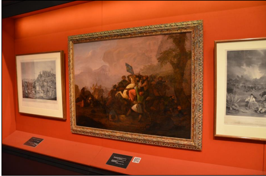
Şekil 4. Dönemin Yunan resim sanatına dair örneklerden bazıları Atina'daki War Museum çatısı altındadır. Görselde söz konusu müzede bulunan ve Yunan İsyanı dönemini hedef alan "Fighting for the Flag (The Output of Missolonghi)" isimli çalışma yer almaktadır.

Athanasia Glycofrydi - Leontsini 'nin ifadesiyle 1844-1862 aralığında ulus kimliğini pekiştirme çabasını sürdüren Yunanlar, tuvalerde Avrupa ile paralel biçimde egzotik elementler de aramış, Yunan topraklarının yanı sıra Doğu istikametinde seyahatler yapan sanatçılar da bu türeve girebilecek kadrajları sıcak renkler ve açık tonlarla resmetmiştir. Böylece geç periyotta (1863-1881) Yunanistan'da izlenimci üsluplar baskınlaşırken ressamlar araştırma sahalarını genişletmiş, Doğu'nun uzak köşelerindeki üretimlerde "coğrafi belge" niteliğindeki manzaralar öne çıkmıştır (Glycofrydi - Leontsni, 2014, s.199-200).