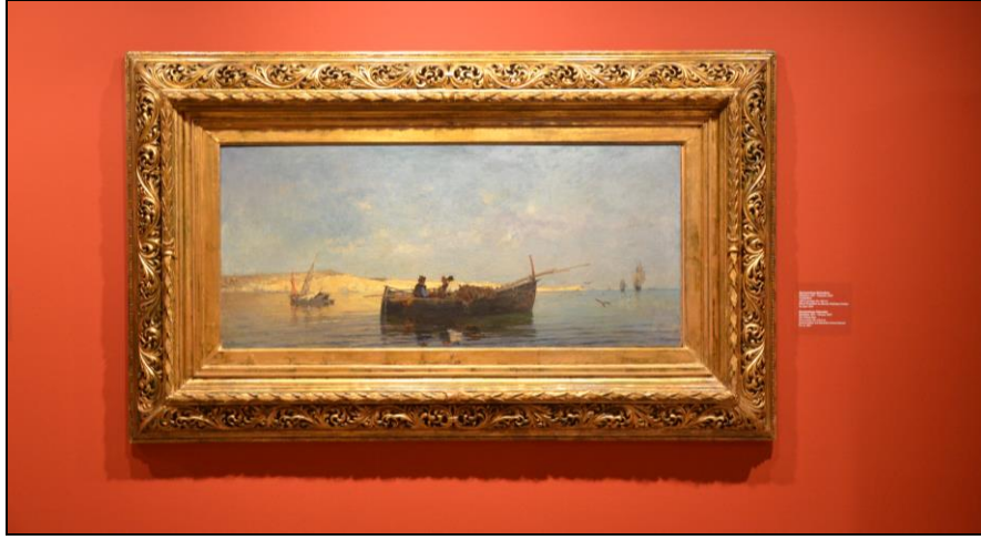
Şekil 5. İzlenimci Yunan sanatçılardan tarihi sahneler içeren deniz resimlerinin önemli temsilcisi Konstantinos Volanakis'in (1837-1907) Fishing Boat adlı çalışması. 58x130,5cm. B&M Museum.

Bu türden kesitler sonraki kuşak Yunan ressamlar tarafından da resmedilirken 19.yy sonlarına doğru eğitimlerini tamamlayan, 20.yy başlarında ise ilk ciddi üretimlerini gerçekleştiren sanatçılar, özgünleşme yolunda ard izlenimci çizgiye daha yakın durmuştur. Paul Cezanne (1839-1906) ve Vincent Van Gogh (1853-1890) gibi isimlerin gündeme getirdiği kritikleri takip eden bu sanatçılar izlenimciliğin sınırlamalarını geride bırakma gayesiyle sübjektif yaklaşımlara yönelirken, peyzajlarda yaygınlaşan üslupsa "liriklik" olmuştur.