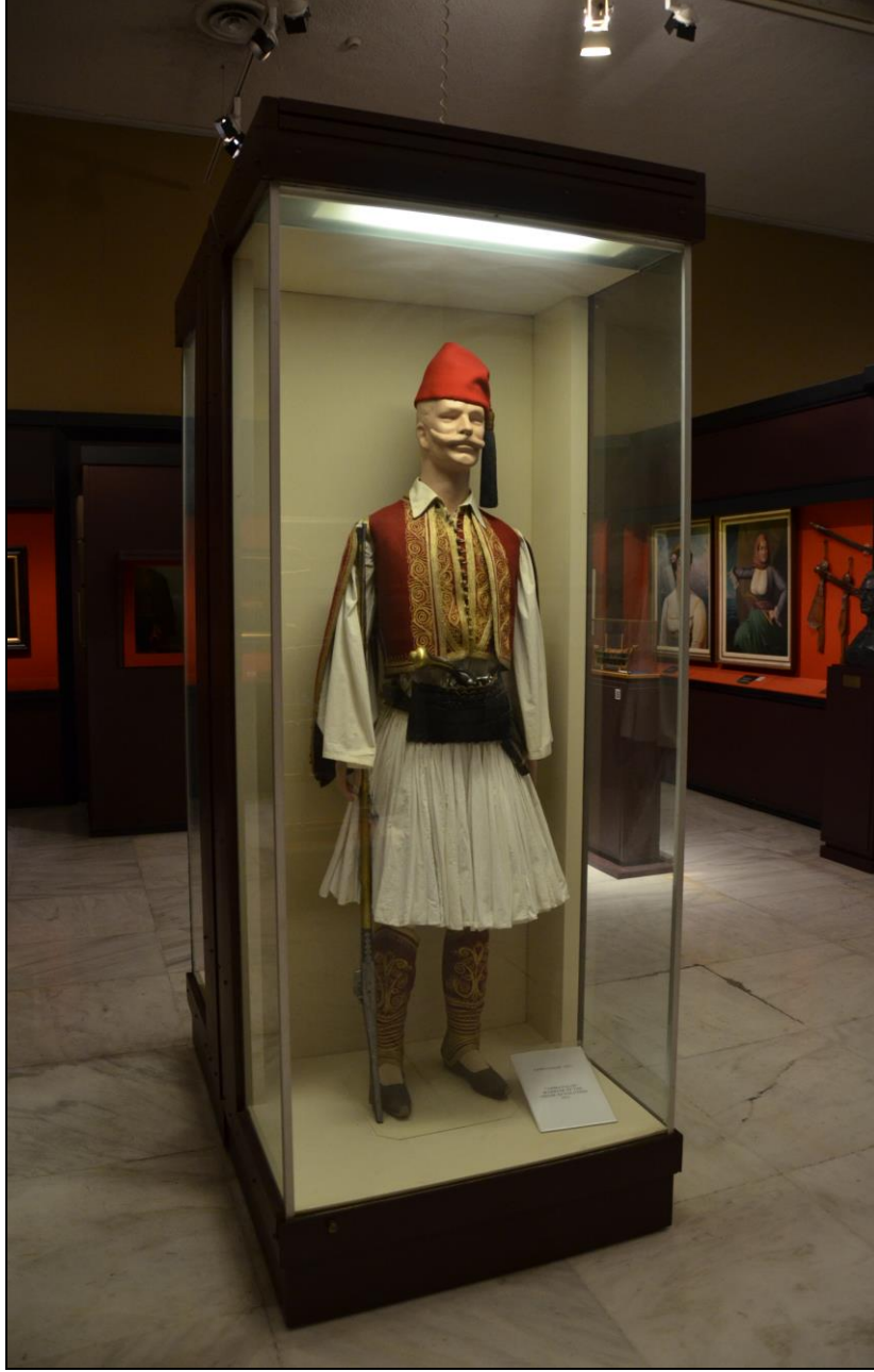
Şekil 1. Atina'daki War Museum'da yer alan ve ayaklanma döneminde Osmanlılar karşısında Yunanların askeri kolu olan Armatolos'ların (Armatoli) askeri kıyafeti. 1821.

Kısa sürede Orta Yunanistan ve Girit adasına sıçrayan isyan başlarda Osmanlı'nın üstünlüğüne tanık olmuştur. (Öncesinde Tepedelenli Ali Paşa 'nın (1744-1822) Yanya ayaklanmasıyla uğraşan) Osmanlılar, Mora'daki durumu kontrol altına almak için Mısır Valisi Kavalalı Mehmet Ali Paşa 'dan (1769-1849) yardım almıştır. Ancak Batı ülkelerinin duruma müdahil olmasıyla üstünlük Yunanlara geçmiş, Kavalalı Mehmet Ali Paşa 'nın askeri gücünü