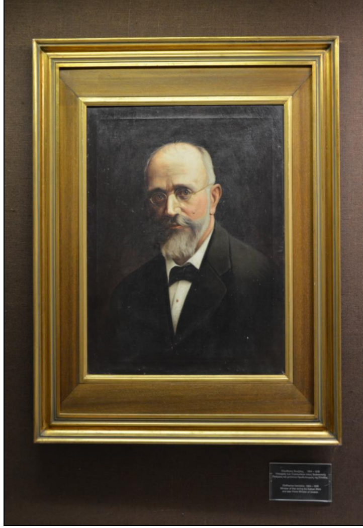
Şekil 3. E. Venizelos 'un War Museum' daki portresi.

Bu aşamada İngiltere ile bir kez daha yakınlaşan Yunanlar Anadolu coğrafyasındaki yenilgi sonrasında Türk ve Yunan halkları arasında nüfus mübadelesinin zorunlu olduğuna kanaat getirmiştir. Yine savaş tazminatı, kamu kurumlarının durumu, Batı Trakya ve Ege'deki adalar gibi konular Türk ve Yunanlar için problem teşkil etmiş, mevzu bahis problemlerin çözüme kavuşturulacağı yer ise İsviçre'nin Lozan şehri olmuştur (Cin, 2012, s.80-81).