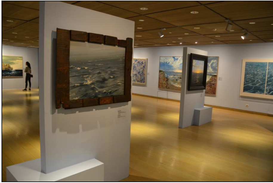
Şekil 7. B&M Museum. İç Mekândan Kesit 2. Kaynak. B.Boyraz Arşivi, 2017.

Konstantinos Parthenis (1878-1967) 10 , Thalia Flora-Karavia (1871-1960) 11 ve metnin sanatçısı K. Maleas gibi Ege coğrafyasından uzakta doğan veya Asya ya da Doğu kurumlarında da eğitim almış sanatçılar eserlerine bu çizgiyi taşımıştır. Dahası edindikleri vizyonun etkisiyle Türkiye, Mısır, Lübnan ve Fas gibi ülkelerden manzaraları daha yalın biçimde resmetmiş ve Yunan izlenimciliğinin şekillenmesi için “sadeleştirilmiş” bir kapı açmışlardır. Aynı üslubu seyahatlerinden döndüklerinde de sürdüren sanatçılar deniz manzaralarına ayrı bir özen göstermişlerdir. Ege toplumlarının ortak noktası olan deniz kültürünün Yunan modernizmini sembolize edercesine öne çıktığı bu çalışmalarda; kıyıları, sahil kasabaları, balıkçılar ve tekneler sıklıkla tercih edilen sahnelerken, Doğu coğrafyalarına özgü ışık-gölge kontrastları burada kendini Grek Işığı olarak göstermiştir.