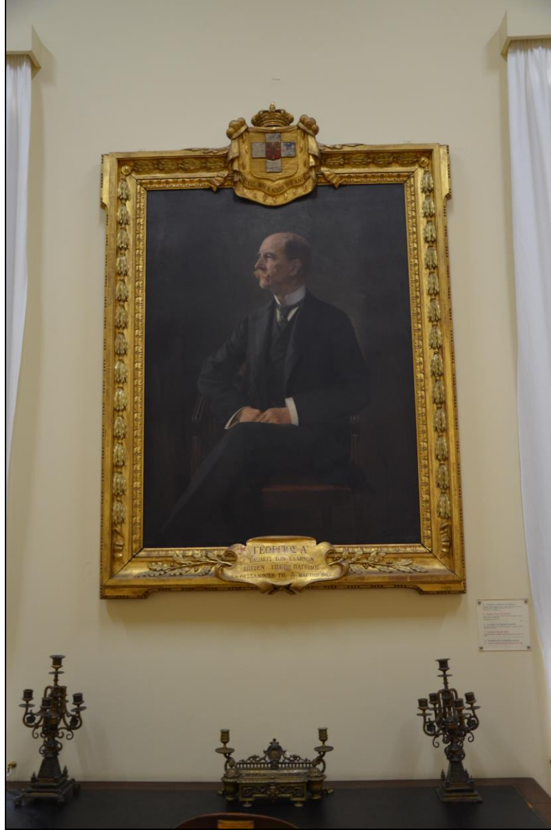
Şekil 2. Atina'daki National History Museum 'da yer alan I. George' un portresi. G. Lakovidis , 1914.