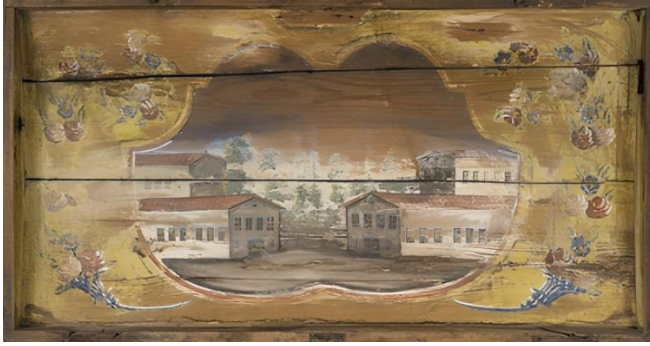
Resim 13: Yapı Tasvirli Sandık Kapağı

farklı boylarda ağaçlar vardır. C ve S kıvrımlarıyla oluşturulmuş alanın dış yüzeylerinde, her iki yanında aşağıdan yukarıya doğru uzayan bereket boynuzları dikkat çekmektedir (Resim 13).