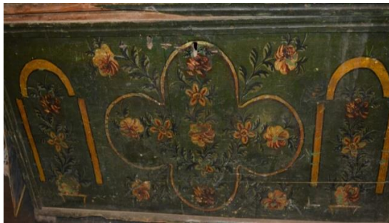
Resim 7: Bitkisel Bezemeli Sandık

Çalışmada incelenen bir diğer grup çiçek buketleriyle vazo/saksı düzenlemelerinden oluşmaktadır. İstanbul'daki çeşitli antikacılarda yapılan araştırmalar ve görüşmeler doğrultusunda, Tokat'ta üretildiği öğrenilen sandıklardan birinin ön yüzünden geometrik motiflerle ortak seçilmiş bitkisel bezemeler görülmektedir. Yeşil bir zemin üzerinde üç bölüme ayrılan kompozisyonun merkezinde C kıvrımlarından oluşan bir çerçeve yer almaktadır. Çerçevenin hem içerisinde hem de köşelerinde farklı cinslerde çiçekler görülmekteyken merkezin her iki yanında ise birbirine benzer betimlemeler vardır. Burada yuvarlak kemer izlenimi uyandıran kompozisyon ve onun hemen içerisinde küçük bir saksı üzerinde yükselen çeşitli çiçekler dikkati çekmektedir (Resim 7).