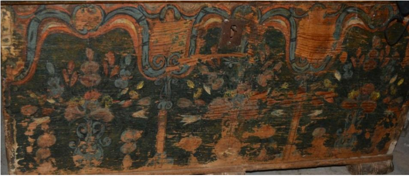
Resim 10: Vazo Düzenlemesi