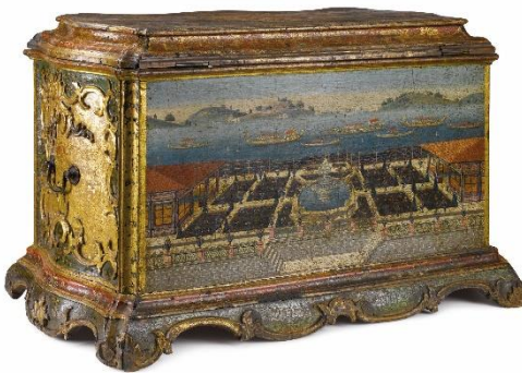
Resim 11: Manzara Resimli Sandık

Bu erken örneğimiz İstanbul panoramasını konu almasıyla ayrıcalıklı bir kompozisyon olarak dikkati çeker. Betimlemenin ön düzleminde tarhlarla ayrılmış, fiskiyeli havuzun olduğu bir bahçeye nazır köşkler ve köşkların hemen gerisinde farklı konumlarda bulunan saltanat kayıkları ile boğaz trafiği dikkat çekmektedir. Resmin arka düzleminde ise kara parçaları ve bunların denize bakan yamaçlarında sahil köşklere veya kasırlar, 18. yüzyıl sonlarından itibaren İstanbul'un değişen görünümünü yansıtır. İstanbul'un değişen silüeti sanatçılar için aktarılması gereken yeni bir görüntü olması açısından önemlidir (Resim 12).