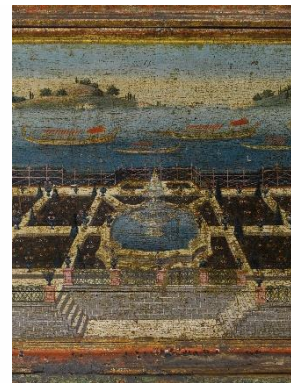
Resim 12: Manzara Resimli Sandık Detay

İkinci örnek, yine Tokat'ta karşımıza çıkmaktadır ve resim, sandık kapağının iç yüzeyinde yer almaktadır. Kompozisyonun merkezinde çerçeve içerisinde birbirine paralel bir şekilde yerleştirilmiş ve mimari olarak benzer özellikleri taşıyan kırma çatılı yapılar görülmektedir ve hayali bir manzara olduğu açıktır. Resmin arka düzleminde ise