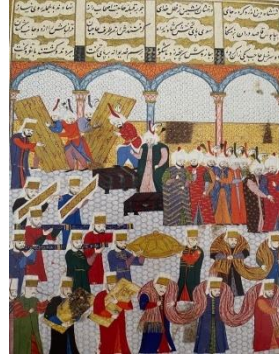
Resim 5: Şehinşehnâme İÜK. F1404

Tarihsel süreç içerisinde sandıkların kullanım biçimleri değişmiştir. Bu doğrultuda “Sandıklar kaç gruba ayrılmaktadır?” sorusu karşımıza çıkmaktadır. Kabaca bakıldığında mal sandığı, cephane sandığı ve çeyiz sandığı olarak genel bir gruplamaya gidilebilmekle birlikte kullanım yöntemleri değiştikçe sandıkların çeşitlerini de çoğaltmak mümkündür. Konak ve hanelerde cilalı sandıklar görülürken yapıldığı malzemeye göre ceviz sandık, silme sandık, ıhlamur, çam, servi, ardıç sandıklarla örgüsüne göre sepet sandıklar görülür. Ayrıca yatak/yorgan gibi büyük kullanım eşyaları için yatak ambarı denilen ve köseleden yapıldığı için dayanıklı oldukları için yol sandıkları olarak anılan türleri de yaygındır (Abdüüaziz Bey 2002: 200). Ancak bir kez daha çalışmamızda temel olarak resimli sandıkların ön planda ele alınacağını vurgulamak gereklidir.