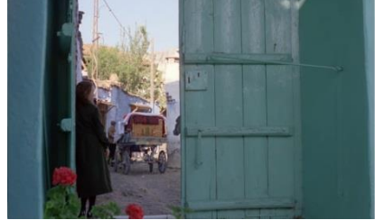
Resim 1: Kula'da Üç Gün Belgeseli (Yön. Suha Arın) Resim 2: Kula'da Üç Gün Belgeseli (Yön. Suha Arın)