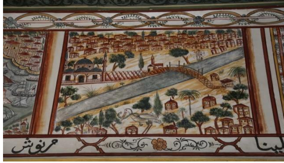
Resim 20: Muğla, Mehmet Ali Ağa Konağı

min mimari detaylarında farklılıklar olmakla birlikte topografik özellikler ve yapıların yerleştirilmesi ortak bir hafızanın varlığına işaret eder. Bu durum belleklerdeki imgele- rin sürekliliğini göstermesi açısından kayda değer olmakla birlikte yukarıda Assmann'ın da bahsettiği gibi "Bellek canlıdır ve sürekli iletişim içinde varlığını sürdürür" sözünü doğrular niteliktedir (2015: 45).