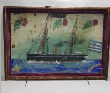
Resim 14: Gemi Tasvirli Sandık Kapağı

Sandıklardaki gemi tasvirlerinde çeşitlilik göze çarpmaktadır. Bu tür eserlerin bir kısmında gemiler tek başına betimlenirken bazı örneklerde gemilerin çevresine sanatçılar tarafından farklı cinslerdeki çiçekler nakşedilmiştir. Gemi imgesi sevilen bir tema olarak sandıklarda yer bulmuş ve Anadolu'nun birçok kentindeki sanatçılar tarafından üretilmiştir.