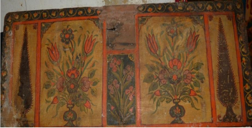
Resim 8: Vazo Düzenlemeleri ve Ağaç Tasvirleri

de kapağın iç yüzeyinde yer almaktadır. Resimler sanatçı tarafından bölümlere ayrılarak nakşedilmiştir. Kapağın iç yüzeyinin merkezinde küçük bir dikdörtgen alan içerisinde çiçek buketi vardır. Buketin her iki yanında birbirine oldukça benzer iki vazodüzenlemesi görülmektedir. Yüzeyin en dışında kalan bölümünde ise paralel bir şekilde yapılmış servi ağaçları betimlenmiştir. Bu kompozisyon ulama formunda ilerleyen C, S kıvrımlı bitkisel bezemelerle çevrilidir. Sandığın merkezindeki bitkisel bezemenin üstünde bir boşluk vardır ve diğer örnekler dikkate alındığında eserin özgün hâlinde burada bir aynanın olduğunu söylemek mümkündür (Resim 8).