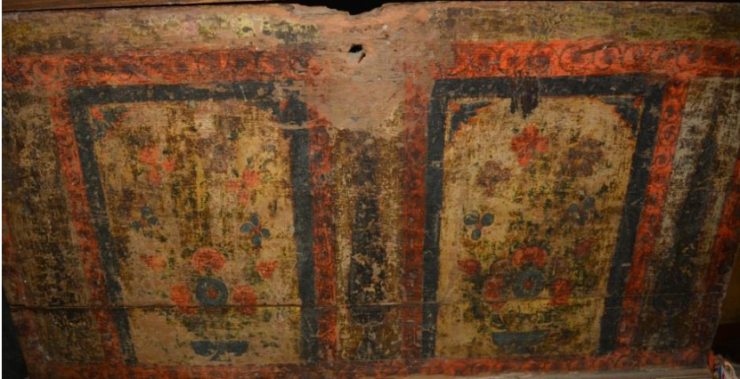
Resim 9: Vazo Düzenlemesi ve Ağaç Tasvirleri

Sandığın ön yüzünde de yine dikdörtgen çerçevelerle ayrılmış resimler vardır. Burada simetrik bir şekilde yapılmış üç servi ağacı ve çeşitli çiçeklerden oluşan iki vazodüzenlemesi görülmektedir. Resimler, iç kapakta olduğu gibi kıvrımlı bitkisel bezemelerle çevrilidir ve yine Tokat'ta üretilen bu eserde kiremit kırmızısı, hardal sarısı, koyu yeşil ve turuncu renkler hâkimdir (Resim 9).