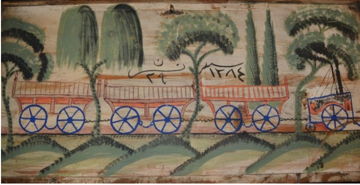
Resim 16: Tren ve Manzara Tasvirli Sandık

İmparatorluk sınırları içinde yaygınlaşan bir diğer konu tren kullanımınıdır ve hemen karşılığını bezeme programında bulmuştur. Dönemin gündeminde diğer bir ulaşım aracı olarak tren/demir yolu da gemiler gibi yine yoğun bir şekilde sandıklarda karşımıza çıkarken çalışma kapsamında incelediğimiz örnekte, bu kez tek başına değil detaylı bir şekilde gösterilen ağaçların ve tepelerin arasında yani doğa ile birlikte betimlendiği görülmektedir. Sandık kapağının merkezinde dört bölümlü bir tren tasviri vardır. Resmin ön düzleminde yan yana sıralı küçük tepeler ve farklı yerlerde duran çeşitli ağaç betimlemeleri görülmektedir. Sanatçının renk tonlamaları ve optik perspektif denemelerinin gözlemlendiği bu eserin merkezinde H. 1284 tarihi okunmaktadır. Bu doğrultuda sandığın M. 1867-68 yıllarına ait olduğu anlaşılmaktadır (Resim 16).