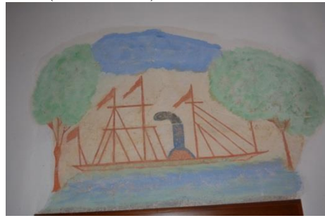
Resim 22: Aydın, Cincin Köyü Camii

Gemi tasvirli sandık kapaklarında dikkat çeken bir diğer ayrıntı bayraklardır. Tas- vir edilenler genellikle Türk bayrağı olmakla birlikte Fransa, Yunanistan, Almanya ve daha birçok ülkenin bayrak veya flamlarının sanatçılar tarafından işlendiğini kanıtla- maktadır. Bu tür örnekler genellikle 19. yüzyıl ile 20. yüzyılın başlarına ait sandıklarda karşımıza çıkmaktadır ve söz konusu yüzyıllar hem Osmanlı Devleti hem de diğer ülke- ler için köklü değişikliklerin olduğu bir dönemdir. Farklılaşan politikalar, savaşlar, ticaretteki rekabetler ve tüm bu hadiselerin nesnesi olan gemilerin doğal olarak dikkat