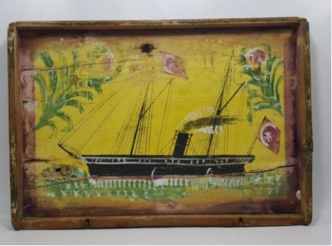
Resim 15: Gemi Tasvirli Sandık Kapağı