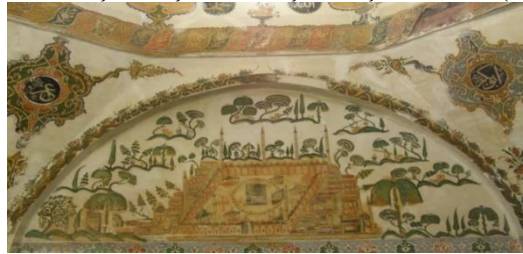
Resim 25: Musa Fakih Türbesi Duvar Resimleri Kaynak: Yetiş 2017: 65

Söz konusu sandık kapağı sadece tren açısından duvar resimleriyle örtüşmemektedir aynı zamanda etrafında bulunan ağaçlar ve küçük tepelerin betimlenmesiyle üslup açısından da büyük benzerlikler vardır. Yukarıda bahsedilen şadırvanlardaki dağ ve ağaç tasvirleri sandıktaki örneklerle birebir örtüşmektedir. Bununla birlikte sandığın üretim merkezi olan Tokat'taki Musa Fakih Türbesi (Resim 25) ve Şeyh Mehmed Türbesi'nde de benzer özellikler açık bir şekilde karşımıza çıkmaktadır (Yetiş 2017: 65,80).