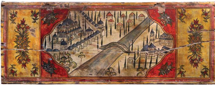
Resim 19: Kent Manzaralı Sandık

Başkent dışı üretimlere örnek verebileceğimiz bir diğer sandık Edirne'de karşımıza çıkmaktadır (Resim 19). Bu sandığı önemli kılan noktalardan biri üzerinde kentin görsel yansımasının yer almasıdır. Edirne kentinin simge yapıları olarak bilinen Üç Şerefeli Cami ile Selimiye Cami sanatçı tarafından tasvir edilmiştir ve eserin bütün yüzeyinde hem çeşitli yapı tasvirleri hem de kent betimlemeleri vardır (Karaçağ 2011: 254). Farklı bölgelerde benzer özellikte resimli sandıkların olması ortak bir beğeni dünyasına ve yaygın bir üretimin varlığını işaret etmektedir.