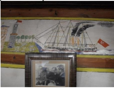
Resim 21: Safranbolu, Sipahioğlu Konağı

İncelenen örneklerde resmin öznesi olarak ulaşım araçlarının önemli bir yer tuttu- ğuna işaret edilmişti. Bu grup içerisinde öne çıkan gemi tasvirleri dikkate alındığında, (Resim 14-15) gemilerin sanatçıların imge dünyasında olmasının en önemli nedenleri arasında dönemin gelişen teknolojisi yatmaktadır. Bilindiği gibi Osmanlı Devleti'nde ilk buharlı gemi, II. Mahmud (sal. 1808-1839) döneminde ülkenin karasularında görül- meye başlamıştır. Servet-i Fünun gibi, 19. yüzyılın çeşitli gazete ve dergilerinde buharlı gemilere yönelik haberler yapılmış ve bu haberler gemi görselleriyle desteklenmiştir. Ayrıca çeşitli kartpostallarda ve efemeralarda gemi görsellerinin yoğunluğu dikkat çeki- cidir. Bu durum gemi imgesinin görsel dünyadaki yoğunluğuna işaret etmekle birlikte söz konusu tasvirin duvar resimlerine ve sandıklara giden yoluna da ışık tutar. Sandık- lardaki gemi tasvirlerinin benzerlerini farklı kentlerde duvar resimleri olarak görmek mümkündür. Çeşitli sanat türlerinde aynı konuların işlenmesi de sanatçıların ortak bir repertuvaya sahip olduklarını kanıtlar niteliktedir (Resim 21-22).