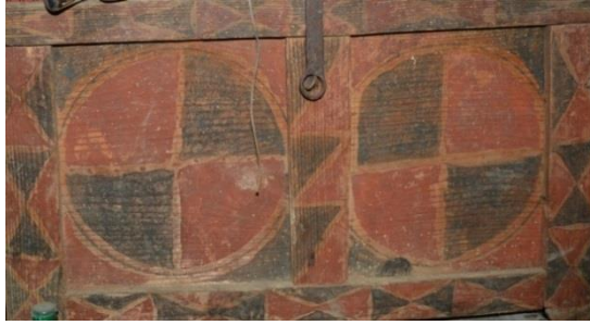
Resim 6: Geometrik Bezemeli Sandık

Sandıklarda geometrik bezemeler en sık karşılaşılan düzenlemeler olarak karşımıza çıkarken incelenen örnekler doğrultusunda kare, daire, yıldız vb. geometrik motiflerin varlığı dikkat çekicidir. Ayrıca çalışmanın ilerleyen safhalarında anlatılacağı gibi bir kısmı da bitkisel bezemelerle ortak kompoze edilmektedir. Bu çalışmada ele alınan sandığın ön yüzünde çeşitli geometrik motifler vardır. Kompozisyonda dört parçaya bölünmüş ve farklı renklere boyanmış daireler bulunmaktadır. Dairelerin etrafı birbirine simetrik bir şekilde yapılmaya çalışılmış ulama formunda ilerleyen üçgenlerden oluşmaktadır. Taşra örneklerini temsilen Tokat'ta üretilen bu eser, kırmızı ve siyah gibi görünen koyu bir tonla boyalıdır (Resim 6).