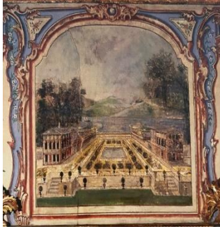
Resim 17: Topkapı Sarayı III. Selim Has Odası