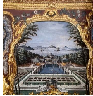
Resim 18: Topkapı Sarayı, Mihrîşah Sultan Dairesi

Meriç'in bahsettiği gibi padişaha verilen hediyeler arasında nakışlı ve resimli sandıkların olduğu kayıtlara geçmiştir. Müellifin incelediği belgeler klasik döneme ışık tutmakla birlikte başkentte sandıkları resimleme geleneğinin yüzyıllar boyunca devam ettiği anlaşılmaktadır (Meriç 1963: 771). Bu çalışmanın öznelereinden biri olan ve saray veya çevresi için üretildiğini düşündüğümüz sandık da bunun kanıtıdır.