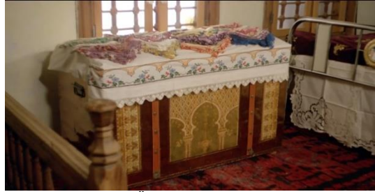
Resim 3: Kula'da Üç Gün Belgeseli (Yön. Suha Arın)