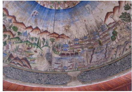
Resim 23: Amasya II. Bayezid Cami Şadırvanı