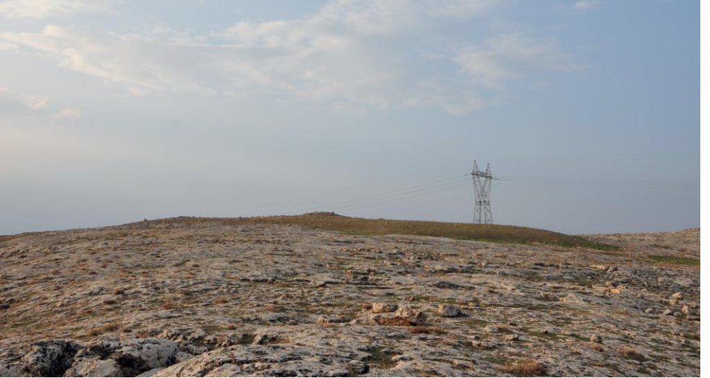
Resim 2: Kurt Tepesi'nin Doğudan Genel Görünümü.