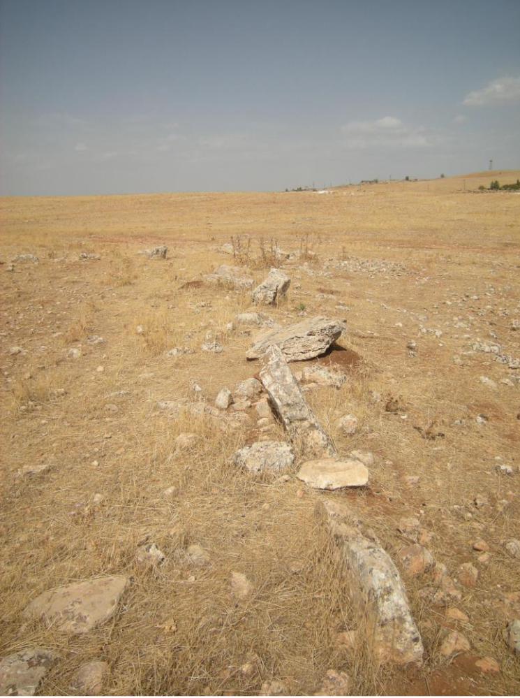
Resim 6: Tahtik Köyü Batı Mevkii Avlak Alanından bir Görünüm.