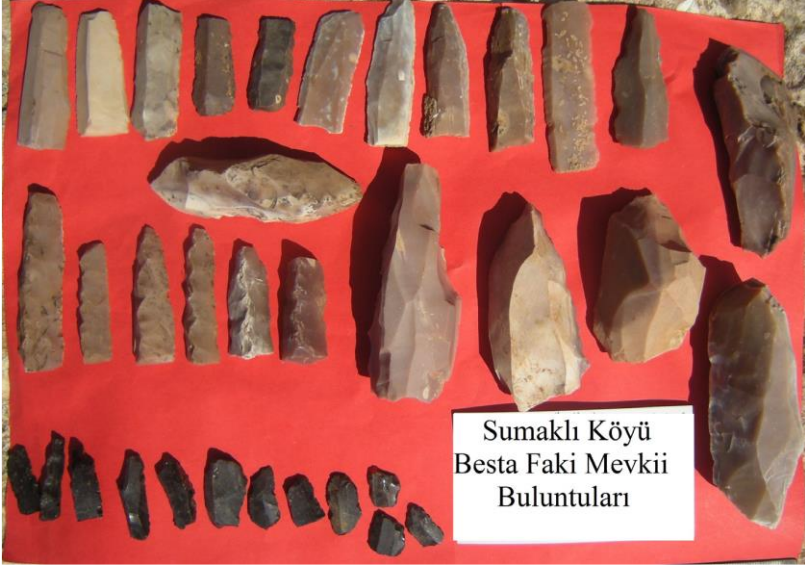
Resim 5: Sumaklı Köyü Besta Faki Mevkii Buluntuları.