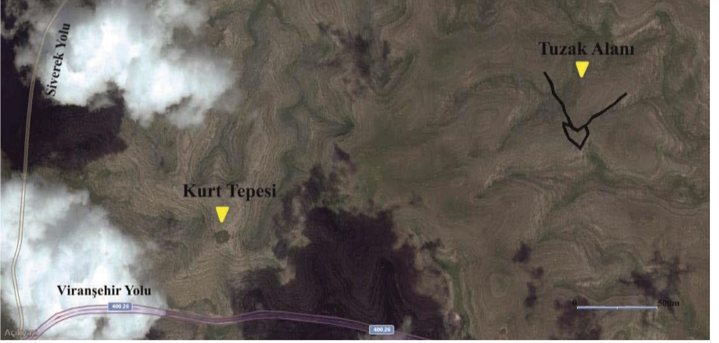
Resim 1: Kurt Tepesi ve Çoban Deresi Boğazı'nın Havan Genel Görünümü.