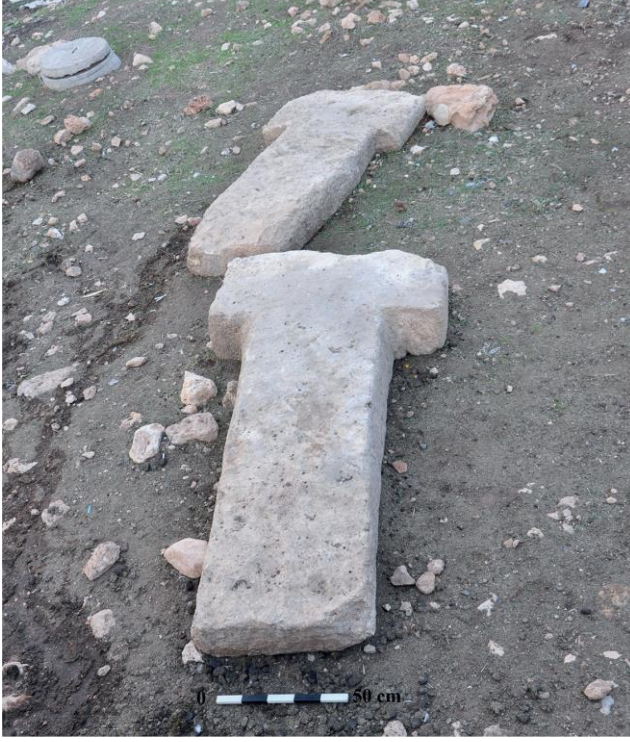
Resim 3: Kurt Tepesi'nden iki adet "T" şeklinde dikilitaş.