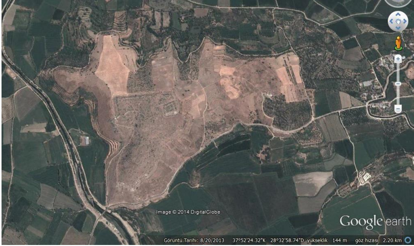
Lev. 1. Antiokheia ad Maeandrum(Googleearth)