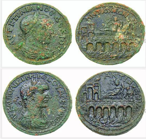
(Valerianus Dönemi İ.S. 253-260)