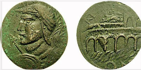
(Gallienus Dönemi İ.S. 253-268)