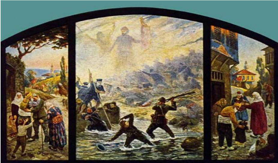
Şekil 2. Çanakkale Zaferi

Resim, askerlerin verdikleri mücadeleyi, toplumun birlikteliğini ve orduya duyulan hayranlığı yansıtmaktadır. Mehmet Ruhi Arel bu kurgu ile savaşı belgelendirirken, aslında Osmanlı döneminde İstanbul'un bir bölgesinde kullanılan yöresel kıyafetleri, sivil mimariyahşap evleri, coğrafi özellikleri ve doğayı da göstermiştir.