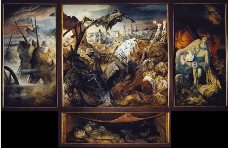
Şekil 1. Savaş

Otto Dix dışavurumcu akımının bir temsilcisi olarak, savaşın gerçeğini daha vurucu bir biçimde betimleyebilmesi için üslubunu kullanmıştır. Almanya'da savaşta yaşanan bütün acı ve felaketleri resimde yansıtmıştır.