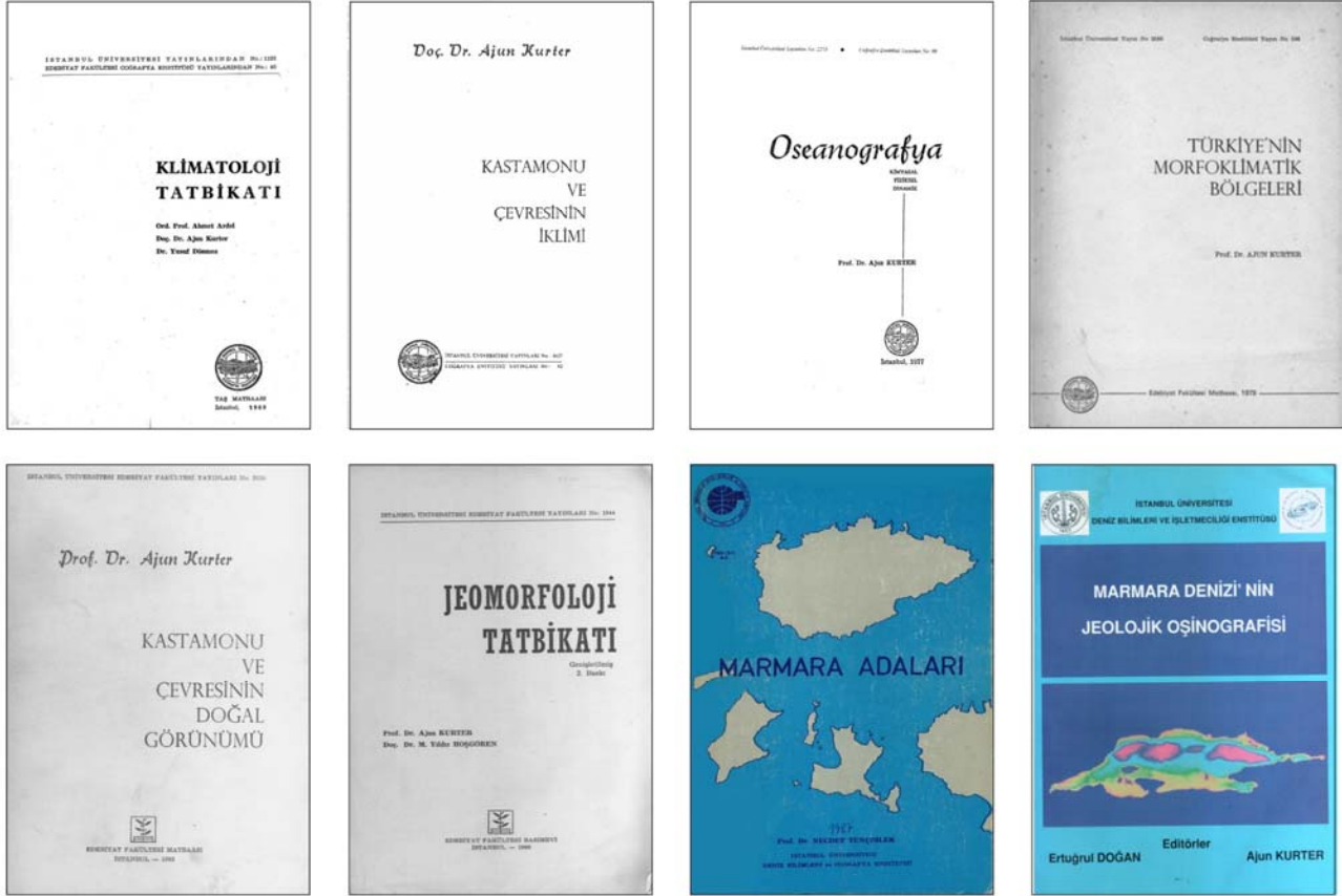
Şekil 1: Prof. Dr. Ajun KURTER'in 1969 ve 2000 yılları arasında yayımlanmış çeşitli konulardaki kitapları.

haddinden emekli olmuştur. Model uçak hobisi olan, ciddi bir koleksiyona da sahip olan Kurter, "Türk Havacılık Tarihi" konusunda da uzun yıllardır araştırmalar yapmıştır. Fransızca ve İngilizce bilen, evli ve bir çocuk babası olan Ajun hoca, 13 Şubat 2016 günü vefat etmiştir.