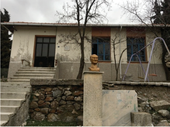
Fotoğraf 10 Yamanlar Köyü'ndeki ilkokul ( Yazarlarca çekilmiştir. )

Köyde taşmalı sisteme geçilmesinden ötürü atıl durumda olan bir ilkokul binası mevcuttur.