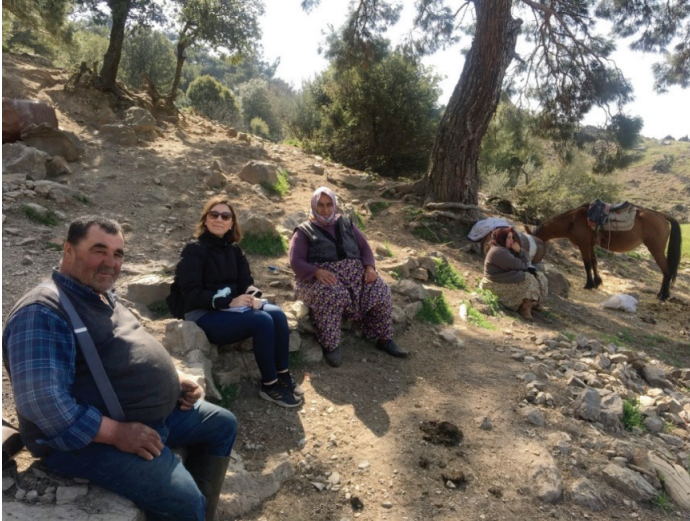
Fotoğraf 5 Köyde yaşayan bir aile ile yapılan görüşmelerden bir görünüm

Köye yerleşimin üç kanaldan olduğu anlaşılmaktadır. Birincisi; veba salgını 14 üzerine hâlihazırdaki mevkiye yakın Cocular Tepesi'ndeki Manastıryayla'dan 15 gelen Yörük nüfus, ikincisi Konya civarından bölgeye göçen Yörük nüfus, üçüncüsü ise köyde üç nesildir ikamet eden üç haneden oluşan Yunan işgali üzerine Arnavutluk'tan gelen Arnavut asıllı Müslüman Türk nüfus. Köyü çevreleyen tepelerde Ovacık, Çamurlu, Yukarıdağ (Ev), Çalibey, Göldağı, Buğdayalan yaylaları bulunmaktadır. 1913 yılında I. Dünya Savaşı ve öncesinde İzmir'in pek çok kaza ve nahiyesinde görülen çekirge istilasının yaşandığı köylerden biri olduğu da kayıtlara geçmiştir (Gökmen, 2010, s.129).