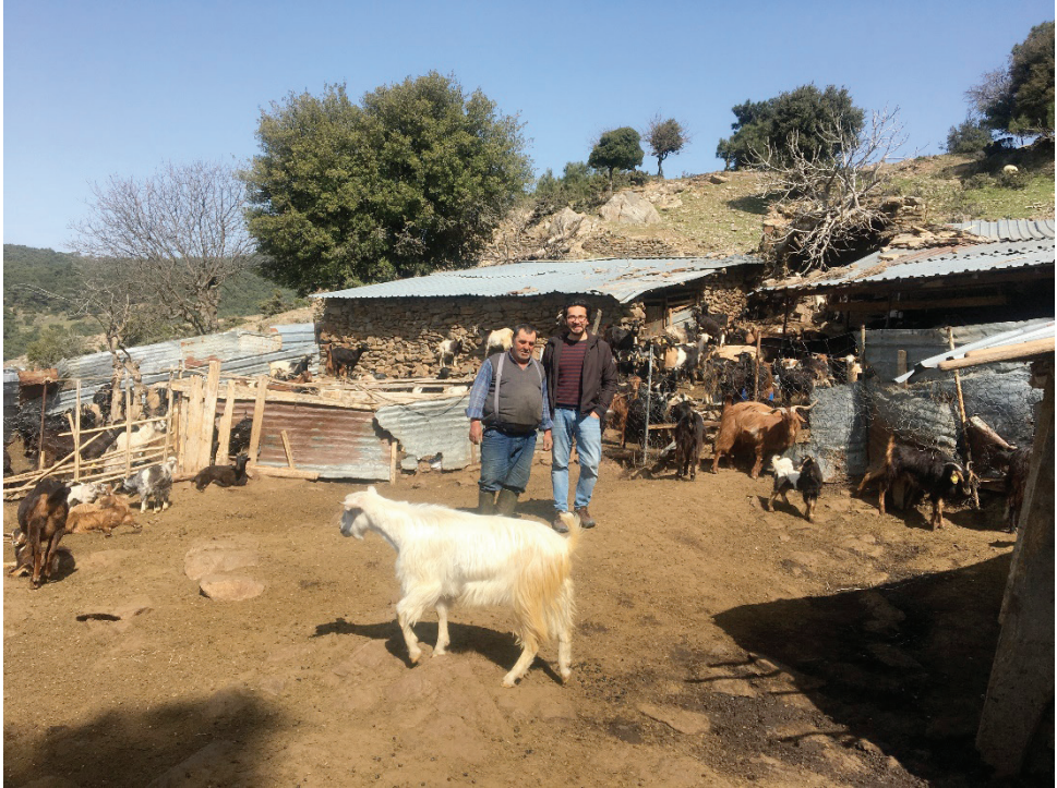
Fotoğraf 13: Yamanlar Köyü’ndeki ağıldan bir görünüm

Arazi mülkiyetinin el değiştirmesi yerel haklın yüzyıllar içerisinde uyarlandığı ve sürdürmekte olduğu yaylak tipi hayvancılığı devam ettirmelerini zorlaştırmıştır. Ekin yetiştirilen alanların özel mülkiyete tabi olması ve meralık alanların küçülmesi hayvancılık ile uğraşanları ticari yemlere bağımlı kılmıştır. Kentlerin kırsal alana ve kırsal yerleşimlere doğru saçaklanarak genişlemesi, kırsal yerleşimlerin çözümlen[ç]meyen sorunlarının üzerine kent- sel baskıların da eklenmesi, yasal-yönetmelikler ile kırsal yerleşimlerin kent statüsüne geçmesi sorunları daha da artırmaktadır (Çilingir ve Görgün, 2018, s.140). Conrad P. Kottak (2010), küreselleşmenin ekonomik ve politik aktörlerinin ekoloji üzerindeki kontrol arzularının, yerel toplulukların yaşadığı bölgelerdeki doğal kaynaklar üzerindeki hak taleplerini baskı ve zor yoluyla engellediğine dikkat çekmektedir. Buna göre, küresel kapitalist ekonominin aşırı kâr hırsıyla doğal bir yıkıma sebep olmanın yanı sıra kırsal toplulukların geliştirmiş oldukları uyarlanma stratejilerini (yaylak tipi hayvancılık) olumsuz yönde etkilemektedir (s.25). “Biz eskiden Yörük idik” ifadesi, yaylalara çıkıp çadır kuran Yörüklerin yerleşik yaşama geçerek tarımla uğraşmalarına, başka bir deyişle Yörüklerin iktisadi yapılarının değişimine işaret etmektedir (Aydın, 2020, s.1161-1162). Yamanlar Yörükleri de zamanla yaylacılıktan vazgeçerek kendi bahçelerinde sebze yetiştirmeye başlamışlardır.