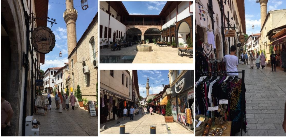
Görsel 5: Yazmacılar Hanı'nın İç ve Dış Görüntüsü

Halit Sokak'ta bulunan han iki kattan ve avludan oluşmaktadır. 2008 yılında Vakıflar Bölge Müdürlüğü'ne geçmeden önce özel mülkiyet olarak kullanılmıştır. Tokat yazmacılığının önemli bir merkezi olan Yazmacılar Han'ın restorasyon çalışmaları başlamasıyla handan yazmacılar taşınmıştır. Ancak hanın etrafında yer alan dükkanlarda yazmacılık satışına devam etmektedir. Turistlerin en sık ziyaret ettiği bu han günümüzde butik otel ve restoran olarak hizmet vermektedir. Yazmacılar ise günümüzde 75. Yıl Yazmacılar Sitesi'nde mesleklerini icra etmektedir.