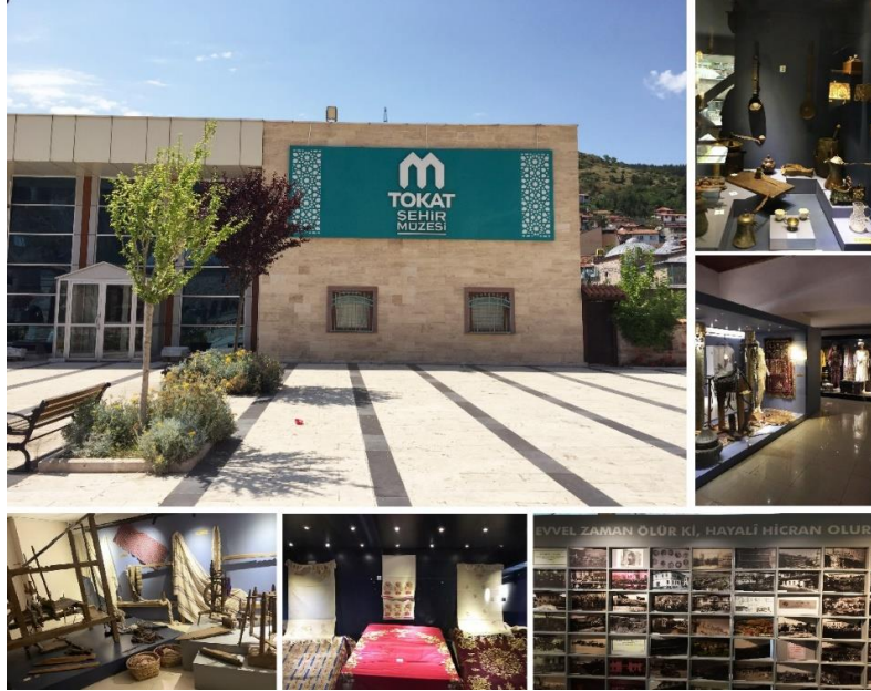
Görsel 7: Tokat Şehir Müzesi'nin Dışı ve İçeride Yer Alan Bazı Eserler

Üst kat el sanatı ürünleri, seramik eşyalar, mutfak araç gereçleri, minyatürler, ahşap oyma eserler, geleneksel giyim-kuşam, kumaş dokuma tezgahı ve ürünleri, yorgancılık ile ilgili öğeler, geleneksel Tokat bakırcılık ürünleri, kapı tokmakları, müzik aletleri, hayvancılık ile ilgili eşyalar, kent hakkında genel bilgiler içeren yazılar, tarihi konak maketlere ayrılmıştır. Bunlar yanı sıra bu katta Danişment Ahmed Gazi, Gazi Osman Paşa ve İbn-i Kemal başta olmak üzere bal mumu heykelleri ile tarihi şahsiyetler canlandırılmıştır.