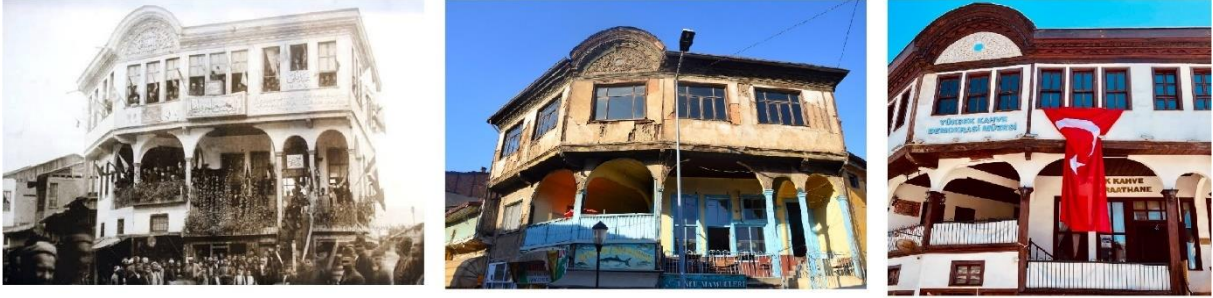
Görsel 14: Yüksek Kahvenin Zaman İçerisindeki Değişimi (URL-15)

geldiklerinde toplantılar düzenledikleri, balkonundan halka hitaben konuşmalar yaptıkları bir mekândır (URL-14). Üç kattan oluşan binanın üst katı Tokat'taki siyasi hayatı yansıtan bir müzeye dönüştürülmüştür. Orta katında bulunan kıraathanede ise Tokat'taki geleneksel kahvehane kültürünün yaşatıldığı görülmektedir. Ayrıca binada günümüzde çeşitli toplantılar ve eğlenceler de yapılmaktadır. “Tokat Tarihi Yüksek Kahve Salı Sohbetleri” altında düzenlenen sohbetlerde çeşitli araştırmacılar ve bilim insanları dinleyicilere sunumlar gerçekleştirmektedir. Alt katında ise çeşitli dükkanlar bulunmaktadır.