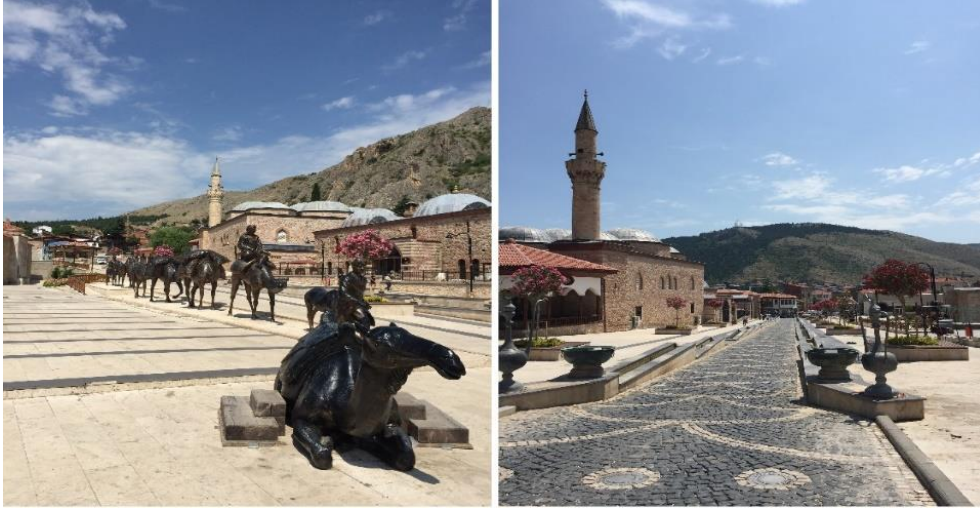
Görsel 6: Sulusokak Tarihi Kent Meydanı

Tokat'ın en eski ticaret merkezlerinden biri olarak Sulu Sokak, 1980 yılına kadar ticari canlılığını sürdürmüştür. Danişment, Anadolu Selçuklu, İlhanlı ve Osmanlı dönemlerinden kalan birçok esere yapılan restorasyon çalışmaları, bu eserlerin yeni işlevler kazanarak korunmasını kısmi olarak sağlamıştır. Kültür yolu projesinden önce kentten kopuk olarak varlığını sürdüren Sulu Sokak, proje ile birlikte kendisini tekrar kente entegre etmiş ve Anadolu Selçuklu, İlhanlı ve Osmanlı dönemlerine ait birçok kültürel eserin yer aldığı "Meydan" adıyla bilinen alanla kendisini bağlamıştır (URL-4).