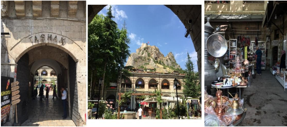
Görsel 2: Taşhan

Osmanlı'nın Doğu politikasının değişmesiyle birlikte 1650 yıllardan itibaren Tokat, voyvodalık olarak anılmıştır. Voyvodalık mali ve idari bir yönetim birimine karşılık gelmektedir. 1600'lü yılların ortalarından itibaren Tokat'ın voyvodalık olmasıyla buraya gelen Voyvodalar tarafından şehre kazandırılan eserlerden biri olması sebebiyle Taşhan "Voyvoda Han" olarak da isimlendirilmiştir. Ancak toplumun bazı kesimleri tarafından bu yönetim birimi Kazıklı Voyvoda ile karıştırılmaktadır. Kazıklı Voyvoda, XV. yüzyılda Eflak prensinin çocuklarından olup kardeşiyle birlikte Osmanlı'ya rehin verilmiştir. Tokat ve Kütahya'da uzun süre rehin kalan Vlad Dracula/Kazıklı Voyvoda daha sonra Eflak'a giderek Osmanlı'ya karşı isyan etmiştir. Tokat Kalesi kendisinin esir tutulduğu zindan olarak basında yer alması ise Tokat'ın tanıtımında önemli bir yere sahip olmuştur (Afyoncu, 2015: 22-23).