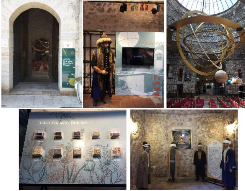
Görsel 10: Türk İslam Bilim Tarihi Müzesi