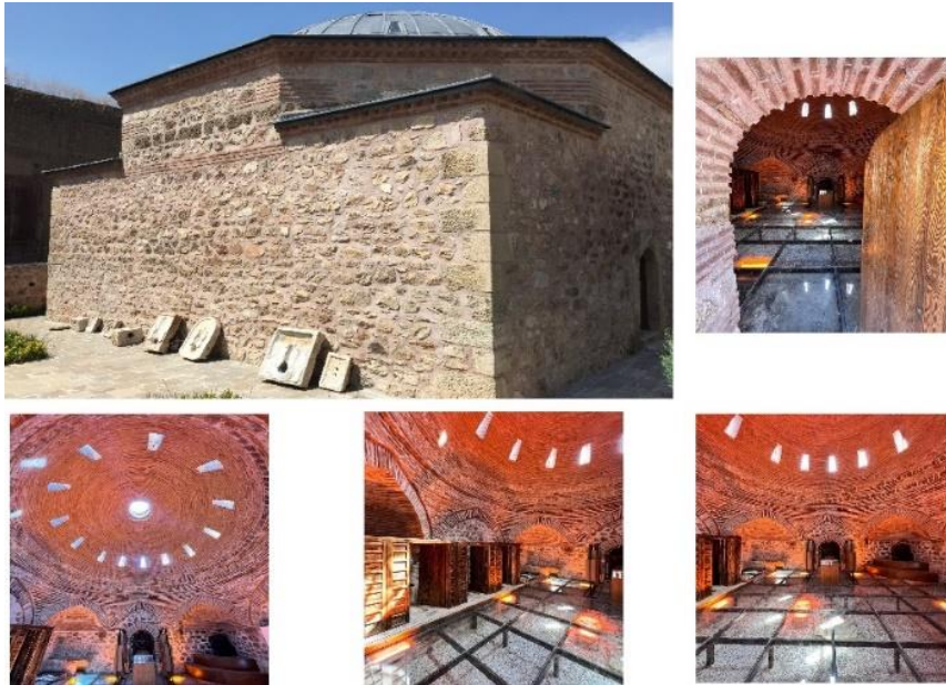
Görsel 13: Sık Dışını Helası-Su ve Temizlik Müzesi

Eski zamanlarda esnafın ve yerel halkın kullanılması için yapılan ancak talebi karşılayamamasından ötürü önünde kuyrukların oluşması sebebiyle halk arasında "Sık Dışını Helası" olarak anılmaya başlanmıştır. Kötü bir durumda olan yapı Tokat Belediyesi tarafından restore edilerek "Su ve Temizlik Müzesi" olarak halka açılmıştır. Türkiye'de bir ilk olan müze günlük yaşamda kullanılan el yapımı temizlik malzemeleri, tuvalet yapımında kullanılan arkeolojik eserler ve altyapı sistemi sergilenmektedir. Bu açıdan müze eski zamanlardaki su ve temizlik kültürünü yansıtmaktadır.