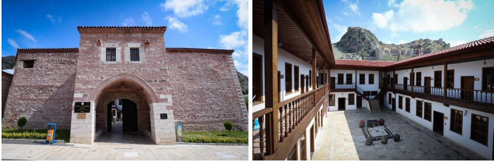
Görsel 12: Sulu Han Çocuk Müzesi (URL-12)

Sulu Sokak'ta Arastalı Bedesteni'nin yanında yer alan yapının kitabesinin bulunmaması ve çeşitli restorasyonlar geçirmesi sebebiyle inşa tarihi bilinmemektedir. Bugünkü görünümüyle iki katlı, açık avlulu bir han (URL-10) olan Sulu Han 1900'lü yıllarda kısa bir dönem cezaevi, 1957 yılında restore edilerek öğrenci yurdu, 1997-2015 yılları arasında "Tokat Belediyesi Aşevi" olarak faaliyet göstermiştir. 2015 yılından günümüze kadar kapalı olan han günümüzde çocuk müzesine dönüştürülmüştür (URL-11).