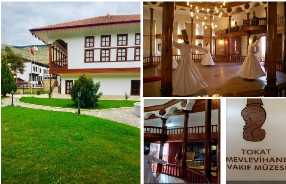
Görsel 15: Tokat Mevlevihanesi

Mevlevilik ile ilgili en eski kaynak olan “Menâkıbü'l Ârifin” kitabındaki bilgiler ışığında Muînüddin Süleyman Pervane'nin isteği üzerine Mevlana, Fahreddini Iraki adındaki halifesini Tokat'a göndermiş ve Pervane'nin 13. yüzyılda yaptırdığı zaviyeyle Tokat'ta Mevlevilik anlayışı yayılmaya başlamıştır. Yaptırılan bu zaviyenin 15. yüzyıl sonunda Uzun Hasan'ın Tokat'ı işgal etmesi ve yakması esnasında yok olduğu tahmin edilmektedir. İkinci defa Sülün Mustafa Paşa tarafından 1638 yılında Bey Sokağı'nda bulunan arsaya inşa ettirilmiştir. Bu yapının tamamı günümüze kadar varlığını sürdürememiştir. Bugün özel mülkiyet olan Mevlana Hamamı, girişte yer alan taş kapı, konak içindeki hamam ve bitişindeki oda o dönemden kalmıştır (URL-16). 19. yüzyıl Tokat evlerinin mimari uygun şekilde restore edilip müze statüsünde olan Mevlevihane'nin semahane bölümünde bal mumundan yapılan dönen heykeller ile Mevlevi sema törenleri canlandırılmaktadır. Ayrıca sema törenlerinde kullanılan çeşitli müzik aletleri sergilenmektedir.