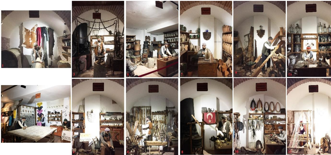
Görsel 8: Tokat Şehir Müzesi'nde Bulunan Geleneksel Meslekler

Somut ve somut olmayan kültürel mirasın iç içe sergilendiği bu müzenin alt katında bulunan geleneksel meslekler arasında dabakçılık, yazmacılık, demircilik, yemenicilik, bakırcılık, urgancılık, çömlükçilik, dökmeçilik, marangozluk, saraçlık, tenekeçilik ve dokumacılık (Görsel 8) yer almaktadır. Müzeyi ziyaret eden kişilerin bir usta eşliğinde tahta baskı kalıplarla uygulamalı olarak baskı yapabildiği bir köşe de bulunmaktadır. Bunlar ile birlikte Tokat'ın geleneksel mutfağı canlandırılarak sini, güğüm, ibrik, kepçe, kazan gibi mutfak araçlarının sergilendiği bölüm yapılmıştır. Mutfak dışında ölçü ve tartı, marangoz, nalbant ve bakırcılık aletleri müzede sergilenen diğer kültür öğeleridir.