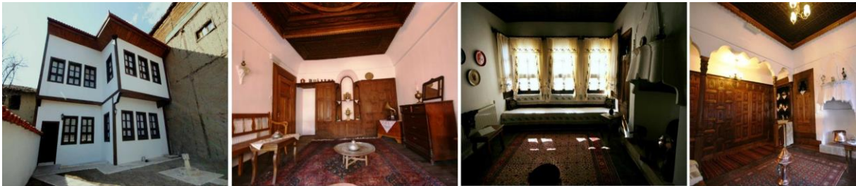
Görsel 11: Tokat Kültür Evinin İç ve Dış Görünümü (URL-9)

Sulu Sokak'ta bulunan cami, medrese, şehir hanı, hamam, bedesten, türbe, çeşme gibi yapılar arasında kendisini gizleyen Tokat Kültür Evi binası barok tarzda inşa edilmiş bir sivil mimari örneğidir. Mütevazı bir mekân olan evin içine girildiğinde mahzen hariç iki katlı, ahşap çatılı, kerpiç dolgu ve kireç sıvasından yapılmıştır. Çift kanatlı kapıyla alt kattaki sofaya girilmektedir. Her iki katta sofanın sol yanına ikişerli olarak odalar yerleştirilmiştir. Bahçeye bakan odalarda dolaplar, oyma tavanlar geleneksel oyma ve süsleme teknikleri ile işlenmiştir. Geleneksel Tokat mimarisine uygun olarak yapılan binanın bahçesinde Tokat su kültürünün özelliklerini yansıtan şadırvan ve çeşme bulunmaktadır (URL-9).