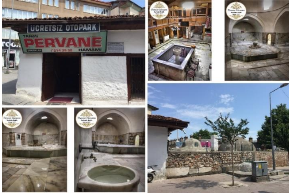
Görsel 3: Pervane Hamamı'nın İç (URL-6) ve Dış Görüntüsü (Gökhan Karabudak Arşivinden)

Taşhan'ın güney batısında bulunan Pervane Hamamı, Pervane Muinüddin Süleyman tarafından 1275 yıllarında inşa ettirilmiştir. Mescit, darüşşifa, medrese ve tekmeden ibaret külliye'nin bir kısmını teşkil ettiği bilinmektedir. Çifte hamam olarak yapılan hamamın zemin katı, çevresinin yükselmesi yüzünden günümüzde sokak kotundan yaklaşık olarak iki metre daha aşağıdadır (Önge, 1995: 245-247).