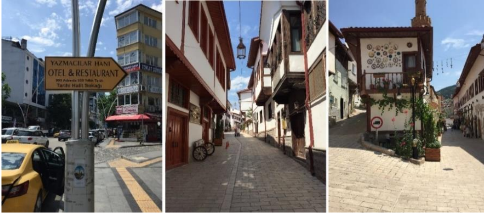
Görsel 4: Halit Sokak

satılmasıdır. Sokakta bulunan yapılarda ikamet eden insanların yanı sıra vakıf binalarına, kafe gibi çeşitli işletmeler yer almaktadır.