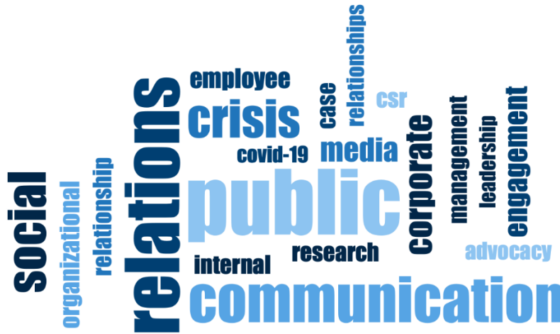
Görsel-1. Makalelere İlişkin Kelime Bulutu

Kamu kelimesi analize tabi tutulan makalelerin %35,34'ünde, ilişkiler kelimesi ise %33,21'inde yer almaktadır. Frekans değeri düşük anlama ve covid-19 kelimeleri ise makalelerin %4,81'inde yer almaktadır.