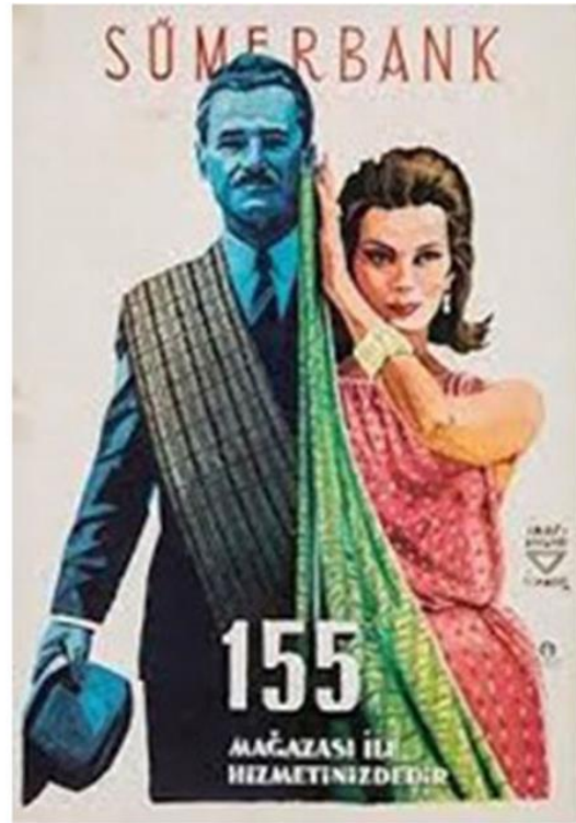
Görsel 3. İhap Hulusi Görey tarafından Sumerbank için yapılan afiş örnekleri (Koraltürk, 1997)