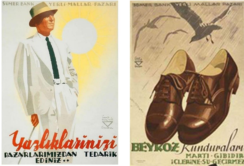
Görsel 4. İhap Hulusi Görey tarafından Sümerbank için yapılan afiş örnekleri (Koraltürk, 1997)

Sümerbank bir devlet girişimi olarak memlekette endüstrileşmede öncülük rolünü benimseyerek tekstilde sermaye ve üretimde önder olacaktır. Amaç, ileri metotlarla çalışan bir endüstri düzeyine erişmektir. 1929-1939 döneminde memleketin tekstil üretim kapasitesi iki misli arttı, bu oldukça yüksek bir artıştı. Bununla birlikte, özel sektör hala büyük ölçüde geleneksel el sanatları düzeyinde kalmıştı. Tüm sanayide işgücü % 3'ü geçmiyordu. Sümerbank programlarda pamuklu sanayisine öncelik vermiştir. Sonunda ithalat % 37,5'ten % 21,53'e inmiştir (İnalçık 2008, s. 152). 1950'lerde Sümerbank ve özel tekstil üretim ve girişimi büyük gelişmeler göstermiştir (İnalçık 2008, s. 154).