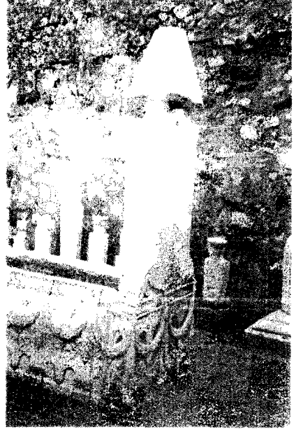
Resim 2: Carhaçı Ali Paşa'nın Mezarı