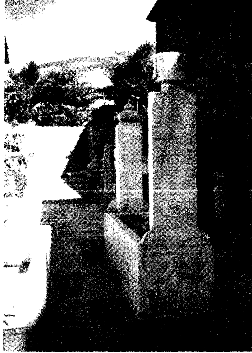
Resim 3: Çeçenzâde Hasan Paşa'nın Mezarı