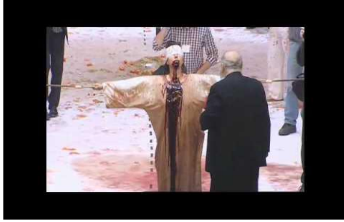
R.6: Nitsch, Orgien Mysterien Tiyatrosu, 122. Aksiyon.