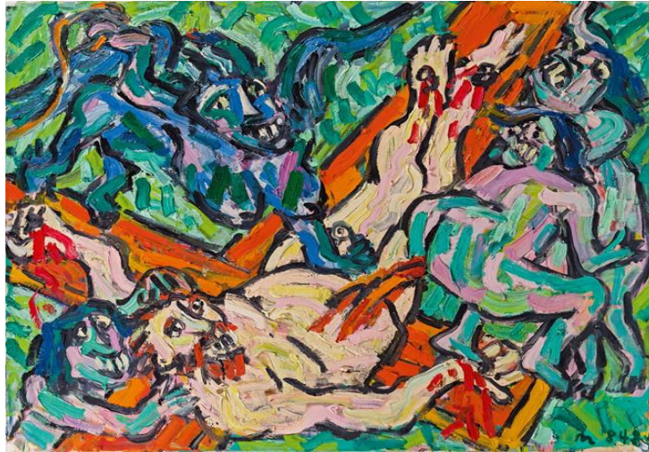
R.12: Otto Mühl, Çarmıha Gerilme.

Mühl çalışmalarında, performatif etkileri sergilediği resimleri ile daha fazla dikkat çeker. Özellikle İsa ve çarmıh dogmatizmini resimlerinde betimlediğini görmek mümkündür. Çarmıha gerilen İsa ve çilesi, bu resimlerden adeta dışarı fırlarcasına bir etki yaratmakta, sanatçının duyguları Hristiyanlığın bu dogmatizmiyle yoğunluktadır (R.12-R.13) (Kuspit, 2006: 146).