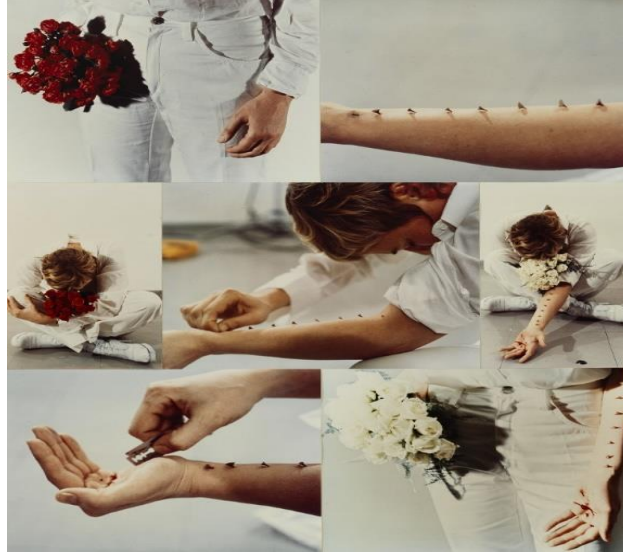
R.15: Gina Pane, Azione Sentimentale.