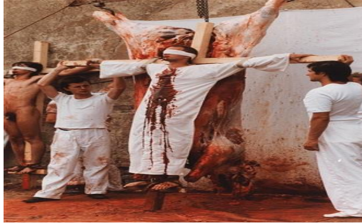
R.7: Nitsch, 80. Eylem.