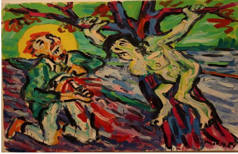
R.13: Otto Muehl, Untitled.