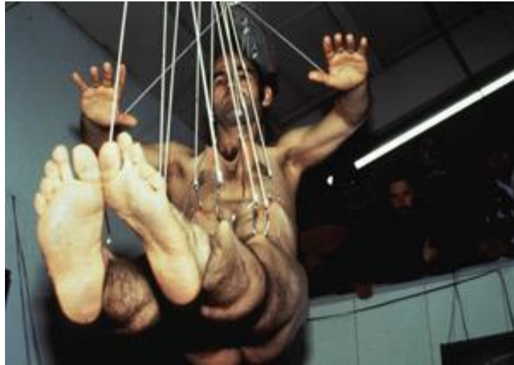
R.16: Stelarc, Uzatılmış Beden.

Sanatçı Stelarc da performanslarında insan ve bedenin dayanma sınırlarını ölçmek istemektedir. Dolayısıyla sanatında teknoloji ile tıp biliminden fazlasıyla yararlanmıştır. Haziran 2009'da İstanbul'da bir üniversite salonunda gösteri yaptığı bilinen sanatçının, izleyenlerde bırakmak istediği izlenim istem dışı hareketlerin bir yansımasıdır. Çoğu deneyiminde doktorlardan da faydalanan Stelarc, insan biyolojisinin yetersizliğinden yola çıkıp insan olmanın sınırlarını zorlar, mükemmel olmanın da yollarını araştırır (Web 7). Sanatçının "Uzatılmış Beden" adlı gösterisi, kendisini vücuduna geçirdiği kancalardan faydalanarak boşlukta sallandırmak ya da asmak deneyiminden ibarettir. (Uçkan, 1998: 197-211). Bu durum ister istemez asılma, sallandırma gibi ilginç görünümüyle, İsa ile özdeşleştirme çabamızda bize yardımcı olabilmektedir. Neticede, vücudun yaralanması, acı çekme deneyimi ve asılma olguları bunu düşünmemize yardımcı kılar (R.16).