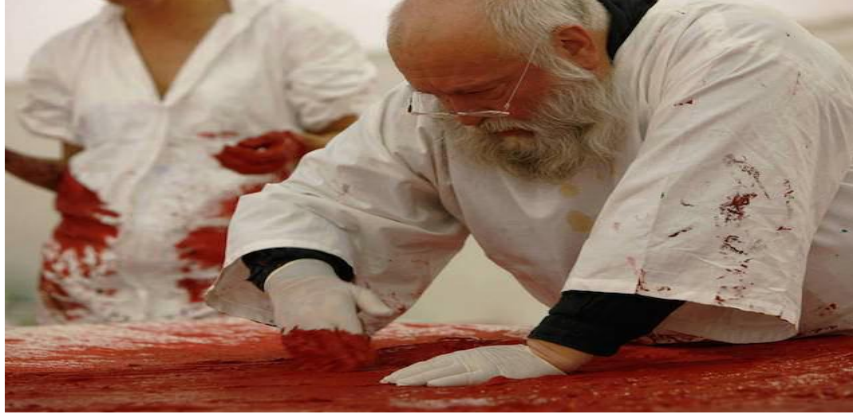
R.2: Nitsch, Painting Action, 2009.

Gösteri sanatı disiplinler arası bir yaklaşım olduğu için, sanatçının çarpmıha şeklinde nesnelere meydana getirdiği sahnelemeleri diğer tabirle enstalasyonları da önemlidir (R.2-R.8).