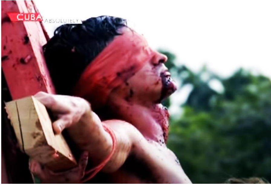
R.4: Nitsch, Performans Art.