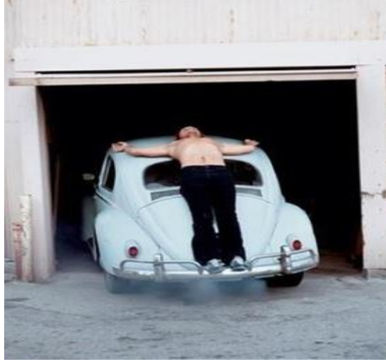
R.9: Burden, Trans Fixed “Sabitlenen Geçiş”.

arabanın tamponu üzerine uzanmış ve resmen çarpmıha gerilmiş halde kendisini arabaya ellerinden çivilemiştir (İsa çarpmıhta olgusu). Bu gösteride, araba yaklaşık iki dakika çalıştırılmış ve ilerlemesi sağlanmıştır. Ardından da araç garajına geri bırakılmıştır (R.9) (Yılmaz, 2012: 272; Yılmaz, 2013: 12-26).