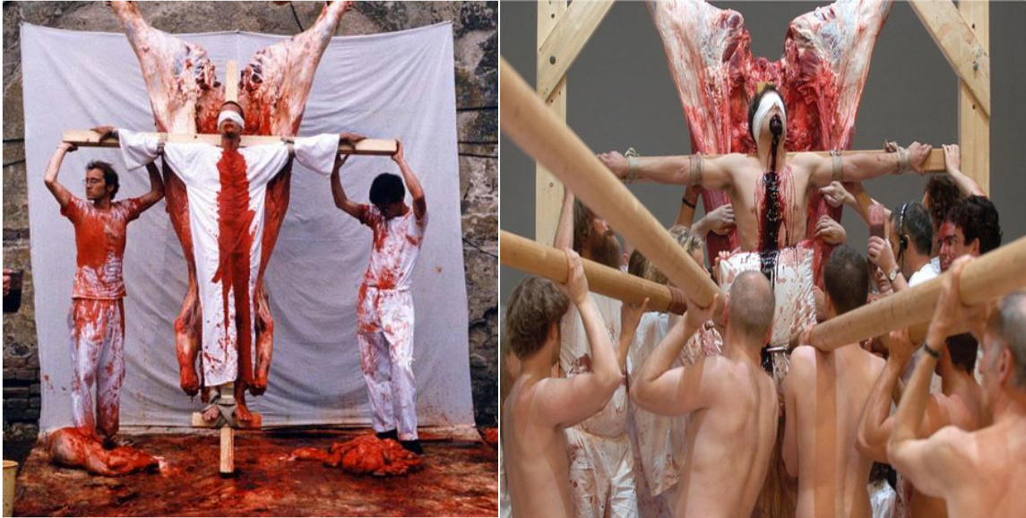
R.5: Nitsch, Orgien Mysterien Tiyatrosu-1998.