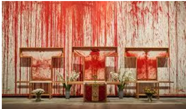
R.8: Nitsch, Enstalasyon Çalışması.