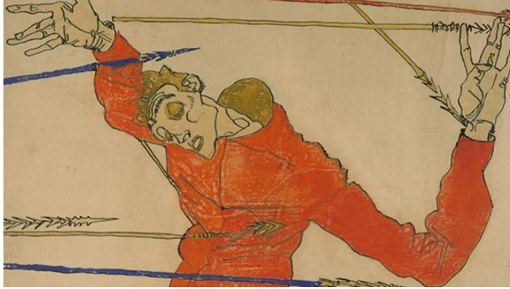
R.11: Rudolf Schwarzkogler, Body, Psyche and Taboo.

Sanatçı Brus'da tıpkı diğer Viyanalı Aksiyonistleri gibi çarmıhtaki İsa ile kendilerini bütünleştiren sanatçılardan birisidir. Ayrıca çıplak asistanlarla gerçekleşen performanslarını da hatırlamak gerekir. Rudolf Schwarzkogler de oldukça yara almış ve hırpalanarak kendini kaybetmiş bir model kullanarak en çarpıcı performanslar sergileyen sanatçılardan bir diğeri olmuştur (Web 6). Çalışmada, Schwarzkogler'nin İsa ile bütünleştiği yapıtı "Body, Psyche and Taboo" ismini taşımaktadır (R.11).