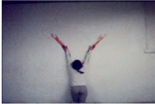
R.14: Mendiata, Body Tracks.

Kübalı sanatçı Ana Mendiata, bedenini sanat için kullanan diğer bir sanatçıdır. Sanatçının ritüel olanla ilgisi çocukluğuna dayanır. Ayinler, Kızılderili tanrıça inanışları ile özellikle ABD’de gösteriler yapan sanatçı, “Body Tracks” ismiyle gerçekleştirdiği performansında bedenini kullanmıştır. Kana bulandırdığı kollarını bir duvara dönük olarak iki yana açılmış haliyle yukarı doğru açmış ve ardından aşağıya doğru kollarını bir iz bırakacak biçimde geriye çekerek, böylelikle duvarda bir kan izi bırakmayı başarmıştır. Sanatçının bu performansı gerçekleştirirken verdiği görüntüde, kolları iki yana açık haliyle İsa peygamberi akla getirmiyor değildir (R.14) (Web 2; Peterson, and Mathews, 2012: 307).