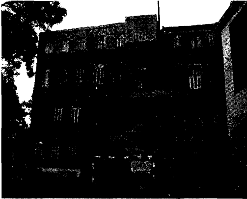
Tiflis'te bugün de eğitim öğretim hayatına devam eden Mirze Feteli Ahundov 73 sayılı Azerbaycan Orta Mektebi

Tiflis'te yer alan bir başka Türk okulu da Türkler'in en fazla yoğunlaştığı mahallelerden biri olan Harpuh Mahallesi'ndeki Puşkin Mektebi'dir. 1902 yılında Gürcü, Ermeni ve Azerbaycan-Türk Dili Bölümleri'yle öğretime başlayan okul, 1913 yılında "Türk Okulu statüsü" alır ve 1919 yılında da adı "Sedi" olarak değiştirilir. 1921-1922 eğitim öğretim yılında adı 97 Sayılı Mektep olarak değiştirilen okula, daha sonra Mirze Feteli AHUNDOV'un doğumunun 120. yılı olan 1931 yılında "Mirze Feteli Ahundov" adı verilir. Ardından 1934-1935 eğitim öğretim yılında da Gürcistan'daki Türk okulları 97 Sayılı Mekteple birleştirilir. 1938 yılında "Mirze Feteli Ahundov 97 Sayılı Orta Mektebi" olarak değiştirilen okulun adı, 1949 yılında da "Mirze Feteli Ahundov 73 Sayılı Azerbaycan Mektebi" olarak değiştirilir.