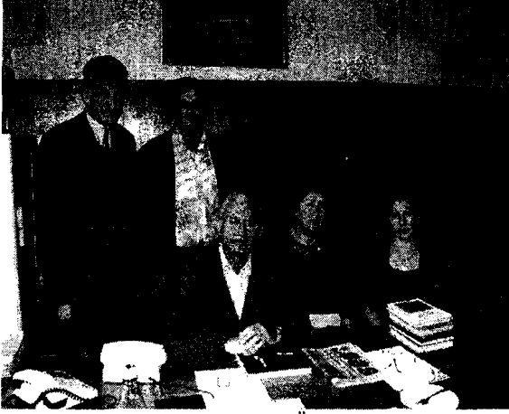
Gürcistan Pedagoji Üniversitesi Azerbaycan Dili ve Edebiyatı Bölümü Öğretim Elemanları