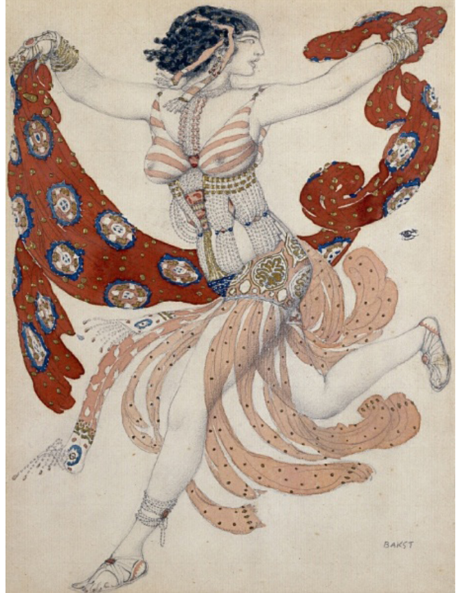
Resim 7. Kleopatra Balesi, 1909