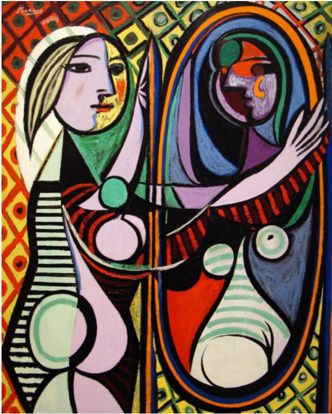
Resim 9. Pablo Picasso, 'Ayna Karşısındaki Kız', 1932

Ballets Russes'un ikinci dönemindeki kostüm ve sahne tasarımlarını ilk döneme göre daha avangart olarak tanımlamak mümkündür. Bu anlamda daha fazla soyutlanmış, gerçeküstü fikirler ya da kübizm ve konstrüktivizm gibi sanat akımlarının etkisi öne çıkmaktadır. Tasarımcıların yanısıra Matisse, Picasso, Naum Gabo, Anton Pevsner ve George Braque gibi ressam ya da heykeltıraş sanatçılar da çeşitli gösteriler için Diaghilev ile çalışmışlardır (the redlist, 2016). Bu durum, hem Diaghilev'in çok yönlü bir sanat anlayışına sahip olması hem de dönemin çok çeşitli kültürlerden beslenen ve işbirliğine açık atmosferinin yarattığı bir sonuçtur. Öyle ki Amerikalı yazar Roger Shattuck, bu dönemin Rönesans'tan sonra sanatçıların en fazla beraber yaşayıp, üretip, paylaştığı bir zaman dilimi olduğunu dile getirmiştir (Hargrove, 1998). Topluluğun ikinci dönemi olarak adlandırılan kısımda modern sanat ile ilişkisi öne çıkan gösteriler, Tören (1917) (Resim 10), Bülbül (1920) (Resim 11), Palyaço (1921) (Resim 12), Mavi Tren (1924) (Resim 13), Kedi (1927) (Resim 14), Ode (1928) (Resim 15) ve Balo (1929) (Resim 16) baleleridir.