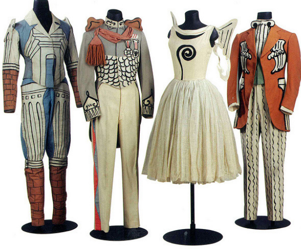
Resim 16. Balo Balesi, 1929

çerçeve içerisinde ele almak uygun olacaktır. Diaghilev'in kurduğu Ballets Russes topluluğu, farklı ve çeşitli kültürlerden topladığı değerler ile yarattığı eserler ve bu eserlerin izleyicilerde yarattığı etkiler açısından oldukça önemli bir örnektir. Özellikle de aktif olduğu 1909-1929 zaman dilimini incelediğimizde topluluğun dönemin sosyal, psikolojik, ekonomik, kültürel ve sanatsal atmosferini çok başarılı bir biçimde yansıttığını, aynı zamanda bu atmosfer ve enerjiden de etkilenip beslendiğini ifade etmek mümkündür. Topluluk çok çeşitli ve fazla sayıda gösteriler yapmıştır, bu sebeple sözü geçen dönemi ayrıntılı incelemek ve önemli ipuçları yakalamak için oldukça uygun bir örnektir. Gösterilerinde hem klasik bale konuları ve bunlara uygun klasik dekor ve kostüm uygulamaları gözlenirken bir taraftan da 1910 ve 1920'lerin çok yönlü, zengin ve dinamik sanat ve tasarım eğilimlerini yansıtan eserleri görmek mümkündür. Bu dönemin öne çıkan iki özelliği olan Oryantalizm ve Modernizm de, topluluğun gösterilerinde görkemli ve başarılı bir biçimde yansıtılmıştır. Bu etkiler, başta kostümlerde olmak üzere kısmi olsa da eserlerin müzik ve danslarında da hissedilmektedir.