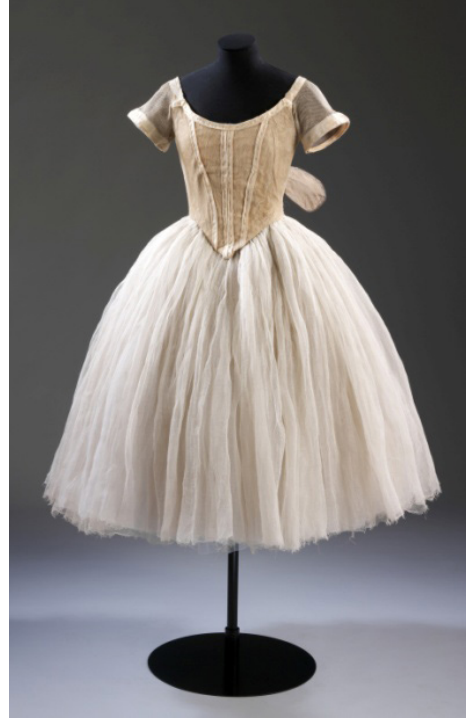
Resim 1. Hava Perisi Balesi.

Diaghilev, Ballets Russes ile 20 yıl süresince sergilediği çeşitli ve çok sayıdaki bale gösterilerinin kostümlerinin hazırlanması için dönemin ruhunu ve kendi ruhunu yansıtan pek çok sanatçı ve tasarımcı ile çalışmıştır. Bu süreçte yaratılan giysilerin bazen klasik bale kostümlerine yakın durduğu; bazen de oryantalist etkilerin vurgulu olduğu ya da modern sanat etkisinde çok fütürist görünen kostümlerin yaratıldığı gözlenmiştir. Kostüm açısından incelendiğinde baleyi iki döneme ayırmak mümkündür.