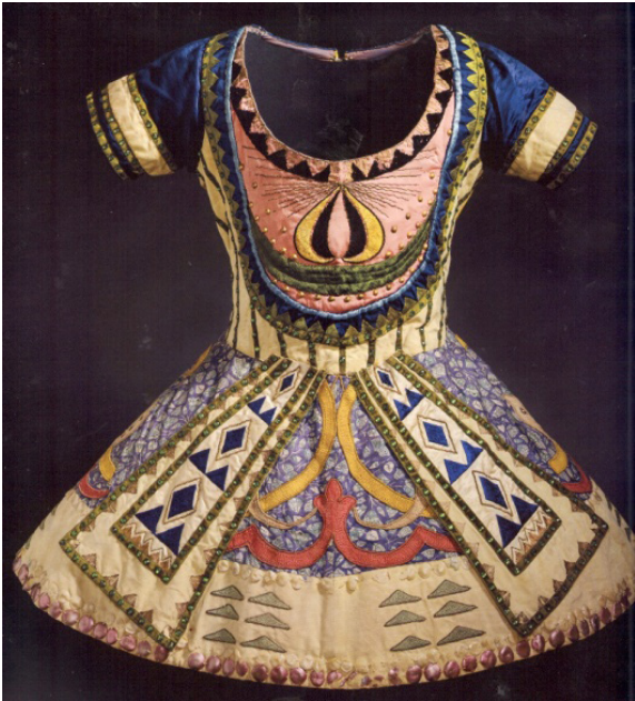
Resim 6. Mavi Tanrı Balesi, 1912

lüeti yaratmıştır. Bu form hem sağlık açısından sakıncalı hem de kadının doğal beden şekline ve duruşuna ters düşen bir anlayıştır. Art Deco ve beraberinde gelen modern yaşam tarzı ile bu abartılı kavisler yerini daha dörtgen, düz ve net hatlara sahip bir kadın görüntüsüne bırakırken bel vurgusunu sırt ve bacaklara taşıyarak korseyi büyük oranda yok etmiştir. Benzer şekilde, keşfedilen Doğu kültürlerinin canlı renkleri, kullandıkları motif ve desenler de Art Nouveau'nun pastel tonlarını gölgede bırakarak Paris modasında büyük bir sükse yaratmıştır. Bu renkler ve desen anlayışı sadece modayı değil sanatçıları da etkilemiş; örneğin Japon resmindeki iki boyutluluğu ya da Doğu'nun coşkulu renkleri ve yalınlığını içselleştirerek Henri Matisse (Resim 8) ya da Pablo Picasso (Resim 9) gibi sanatçıların kendi özgün sanat dillerini zenginleştirdikleri görülmüştür. Giysi modasını oluşturan tasarımcılardan Sonia Delaunay ve Coco Chanel gibileri de Diaghilev'in gösterilerine tasarım yaparak tasarım ile sanat arasındaki işbirliğine örnek olmuşlar ve modern çizgilerini bale sahnesine taşımışlardır.