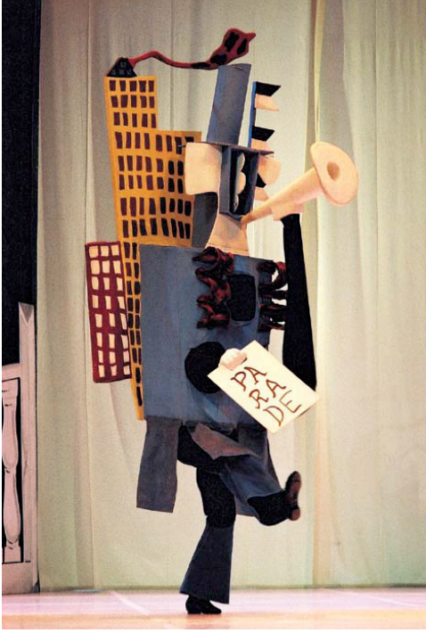
Resim 10. Tören Balesi, 1917