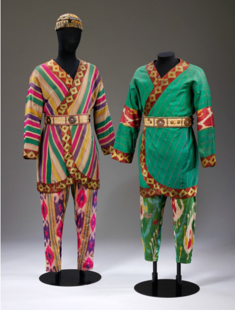
Resim 2. Prens İgor Balesi