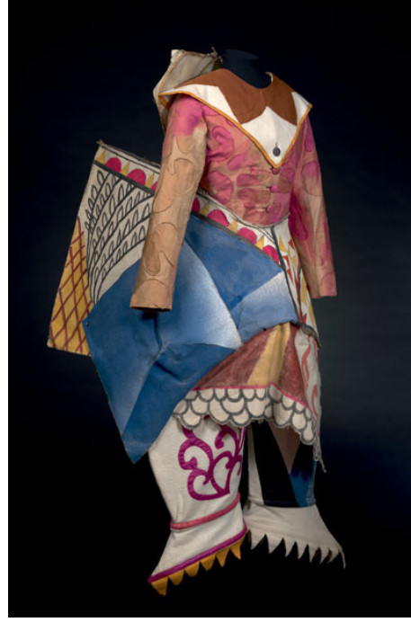
Resim 12. Palyaço Balesi, 1921