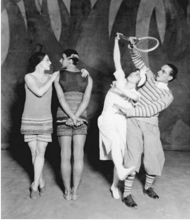
Resim 13. Mavi Tren Balesi, 1924