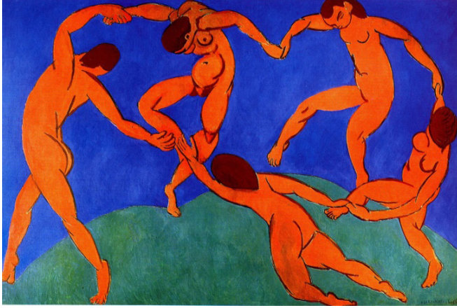
Resim 8. Henri Matisse, Dans, 1910

Diaghilev de bu kültürel zenginlik ve dinamizmin farkında olarak topluluğun kimliğini biçimlendirmiştir; çünkü gösterilerin aldığı tepkilerden seyirciyi cezbeden önemli unsurların başında egzotizmin geldiğini kavramıştır (Rutherford, 2009: 102).