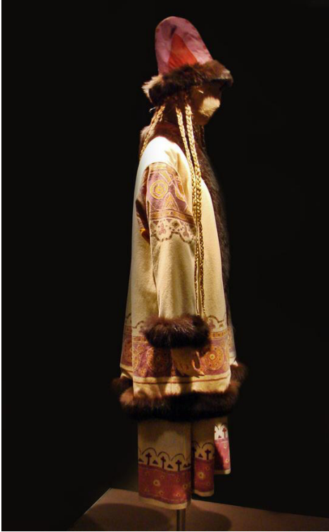
Resim 3. Prens İgor Balesi

göze çarpmaktadır. Tasarladığı kostümlerin hepsi olmasa da çoğu güçlü bir oryantalist etki yansıtmaktadır. Dönemin oryantalist atmosferi içerisinde hayranlık ile karşılanan