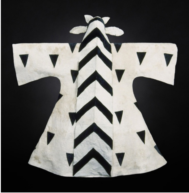
Resim 11. Bülbül Balesi, 1920

folk hikayelerinden yola çıkarak ('Diaghilev and the Ballets Russes , 1909-1929 When Art Danced with Music' Sergi Kataloğu, 2013: 19-21) bu fikri kübist bir yorumla giysilere yansıtmıştır. Giysiler hem iki boyutlu hissi vermekte hem de