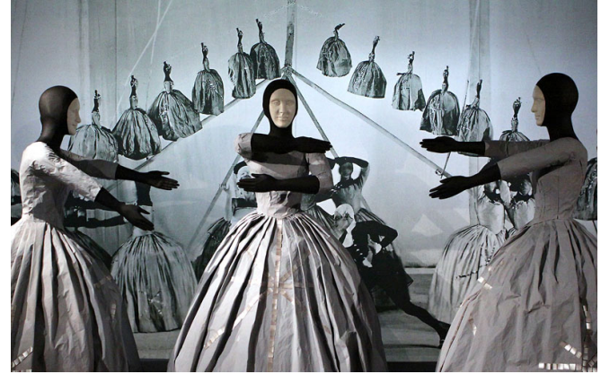
Resim 15. Ode Balesi, 1928

Ode Balesi'nin set ve kostümlerini sanatçı ve dekor tasarımcısı Pavel Tchelichew ve Pierre Charbonnier tasarlamıştır (Resim 15). Balenin tasarımları radikal derecede konstrüktivist bir özellik taşır (nga, 2016). İplere dizilmiş minyatür kukla dansçıların yanı sıra, 18. yüzyıl giysilerini andıran kostümlerle dansçılar, modern ve sıra dışı bir anlatım sunmaktadırlar.