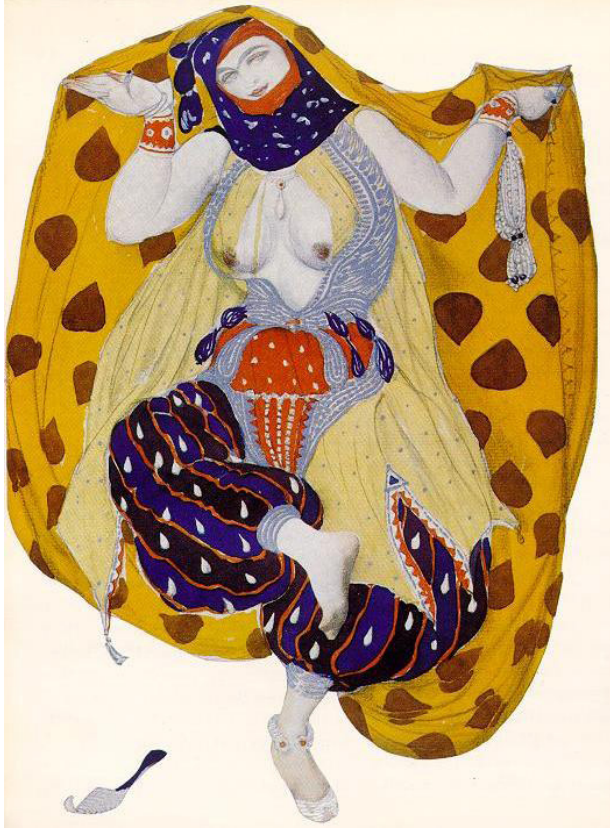
Resim 5. Şehrazat Balesi, 1910