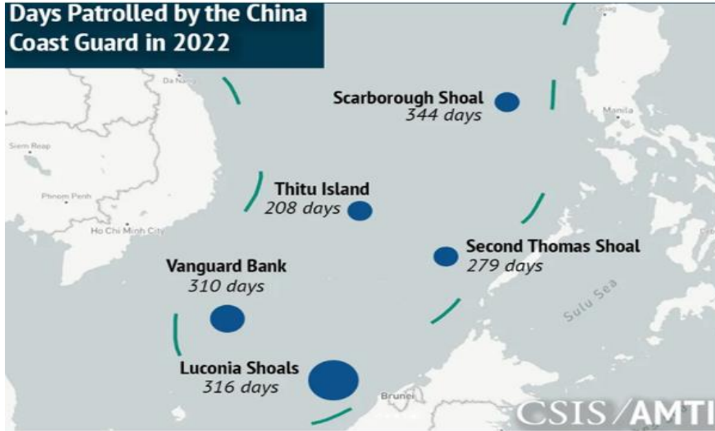
Şekil 1: Çin Sahil Güvenliğinin Devriye Gezdiği Günler

Son yıllarda Çin'in Güney Çin Denizindeki sahil güvenlik varlığının her zamankinden daha güçlü olduğu gözlemlenmektedir. AIS 2022 verilerine göre, Çin Sahil Güvenliği (ÇSG-ÇCG) Güney Çin Denizi'ndeki önemli noktalarda nerdeyse her gün devriye gezdirmektedir. AMTI, 2022 yılına ait AIS verilerini Çin devriyelerinin en sık kullandığı Second Thomas Shoal, Luconia Shoals, Scarborough Shoal, Vanguard Bank ve Thitu Adalarını analiz etmiştir. 2020 verileriyle karşılaştırılınca, bir ÇSG gemisinin devriye gezdiği gün sayısının genel olarak arttığı gözlemlenmektedir. Örneğin ÇSG'nin, Vietnam'ın önemli bir petrol ve gaz geliştirme sahası olan Vanguard Bank'ta devriye gezdirdiği gün sayısı, 2020'de 142 günden 2022'de 310 güne çıkartılarak iki katı artmıştır. Yine ÇSG; Filipinler'in BRP Sierra Madre'de tehlikeli bir garnizon bulunduğu Second Thomas Shoal'da devriye sayısını 232 günden 279 güne çıkarmış, Malezya'nın önemli petrol ve gaz operasyonlarının yakınındaki Luconia Shoals'ta 279'dan 316'ya ve Filipinler tarafından yönetilen Scarborough Shoal'da 287'den 344'e çıkarmıştır. Scarborough ve Shoal'da, aynı anda birden fazla ÇSG gemisi mevcuttur (Asia Maritime Transparency Initiative, 30 Ocak 2023).