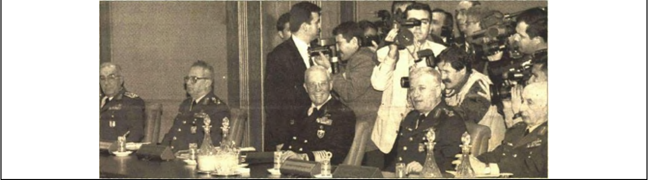
Şekil 1. MGK toplantısında komuta kademesi.

ve Doğruyol Partilerinin laiklik ilkesini görmezden geldiğine atıfta bulunarak gerçekleştirmektedir. Haberde olaya ilişkin fotoğraf kullanımıyla, retorik öğelerin güçlendirilmesi amaçlanmaktadır. Görselde MGK toplantısında her ne kadar Erbakan ve Çiller'in görüntülerine yer verilmese de karşılığında askeri üst düzey komutanlar öne çıkarılarak Refahiyol Hükûmeti liderlerini itham edercesine bir anlayışla ve emin tutumlarıyla sergilenmişlerdir. Fotoğraf altı metinde "Milli Güvenlik Kurulu, REFAHYOL'a en uzun 28 şubati yaşattı. Cumhurbaşkanı başkanlığında yapılan toplantıda komutanlar, Çiller ve Erbakan'ın karşısına oturdular" ifadesinde komuta kademesince hükûmet benimsedikleri ilkeler doğrultusunda yola getirilme hedeflenmiştir.