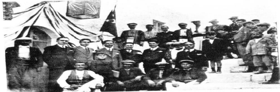
Cumhuriyet Bayramında Halkevimizi Kut'ulamaya Gelen Köylülerin Mümessilleri Köyçüler Komitesiile Birlikte Halkevi Kapısında

Cumhuriyet Bayramı Kutlamaları, Mardin, H.Dilek A.g.t. s. 126-141.