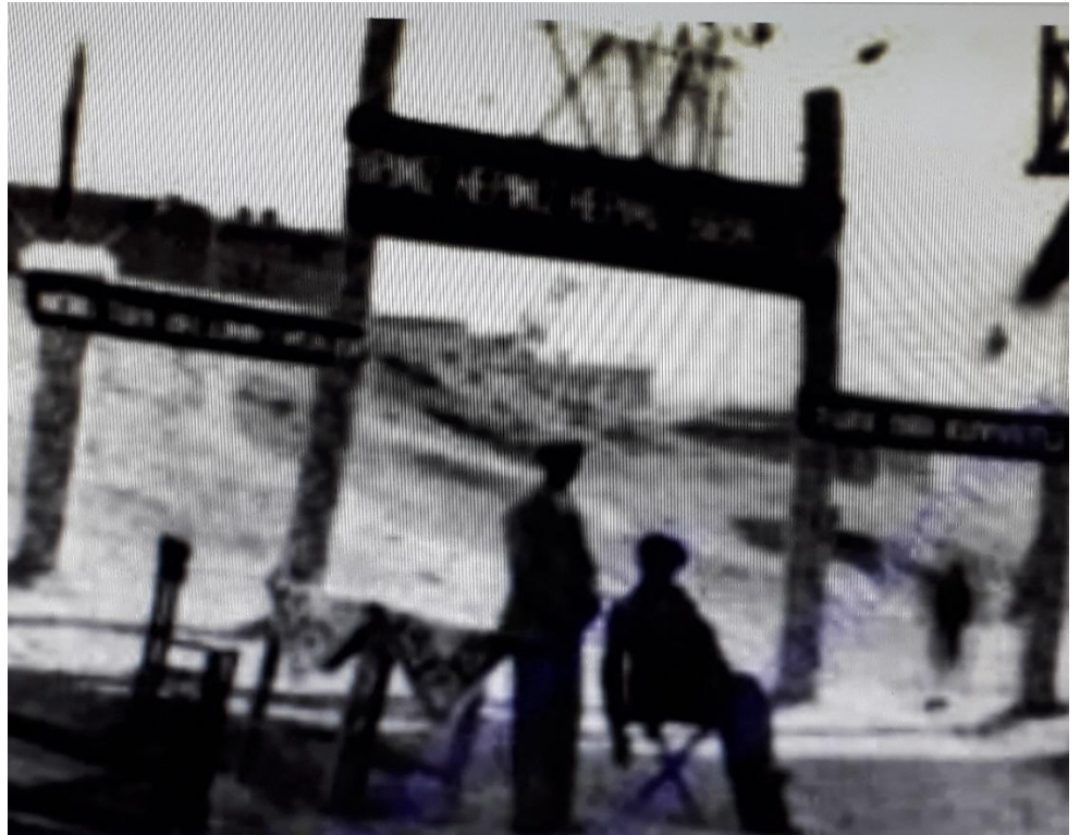
XVI. Cumhuriyet Bayramı Kutlamaları, Hakkâri. Cumhuriyet Bayramı Kutlamaları, Hakkâri