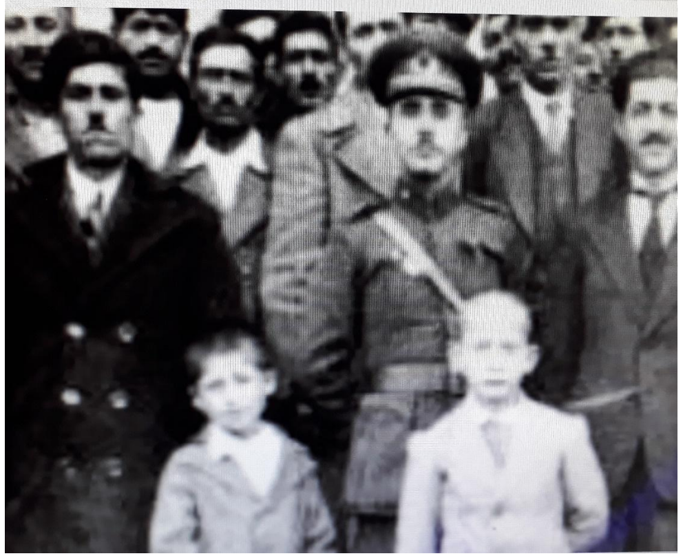
Cumhuriyet Bayramı Kutlamaları, Hakkâri