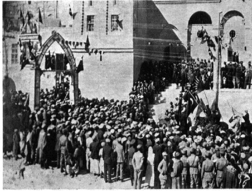
Cumhuriyet Bayramına aid bir int.ba " Köylüler Belediye önünde "

Cumhuriyet Bayramı Kutlamaları, Mardin, H.Dilek A.g.t. s. 126-141.