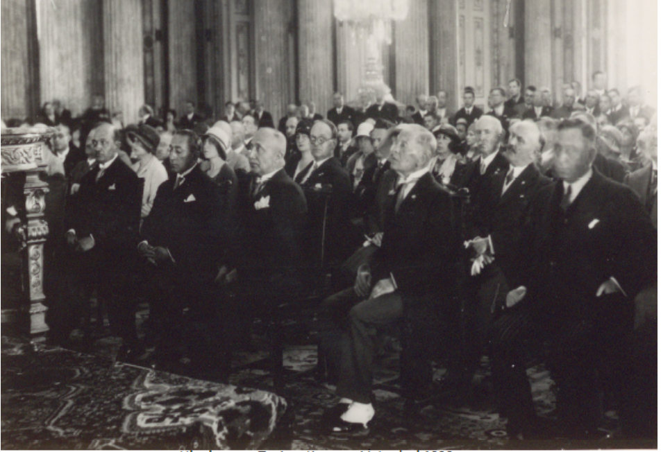
Uluslararası Turizm Kongresi İstanbul 1930